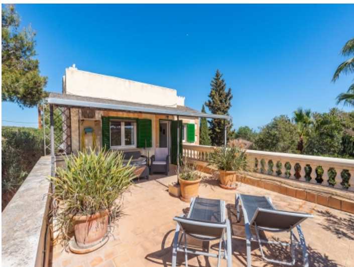
Dachterrasse mit Sonnenliegen