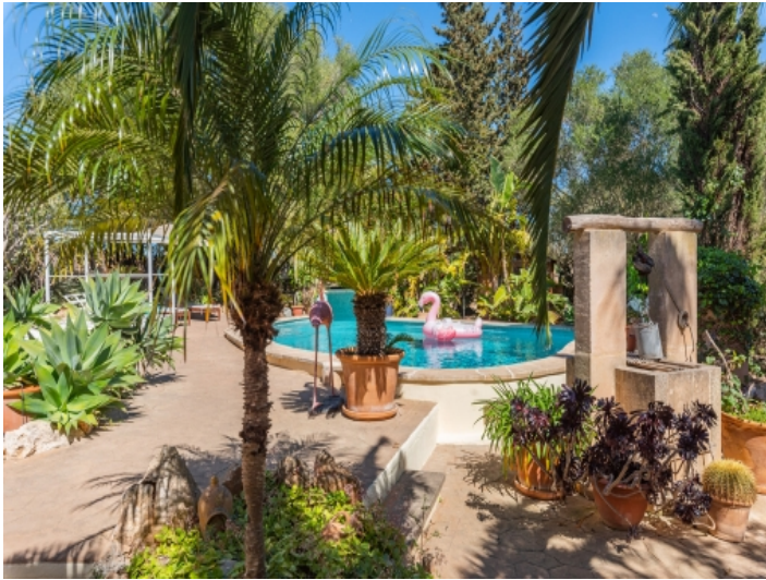
Poolbereich und Garten