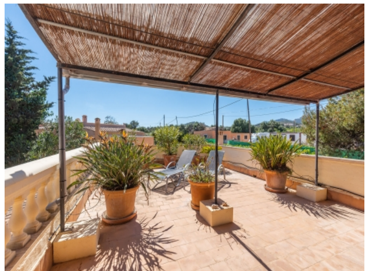
Partiell überdachte Terrasse