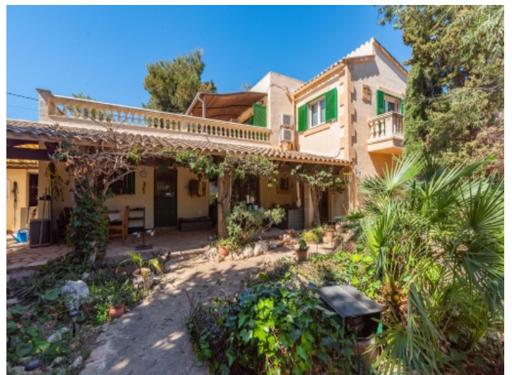
Aussenansicht der Finca