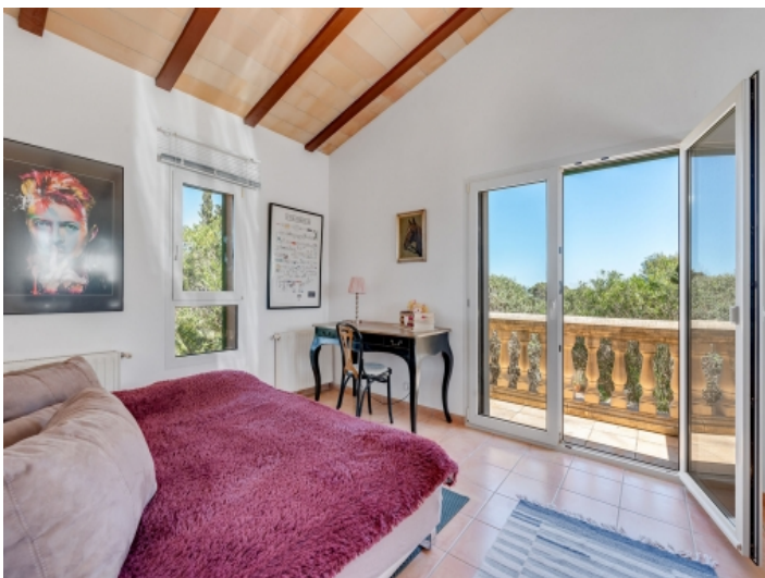
Schlafzimmer eines von 4 Schlafzimmern