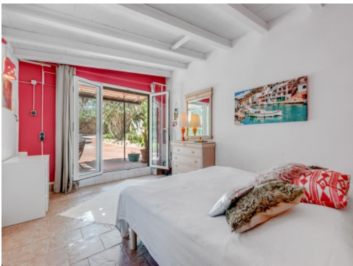
Schlafzimmer im Gästehaus