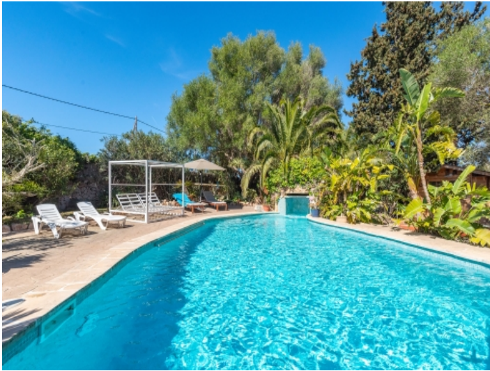
Poolbereich mit Wasserfall