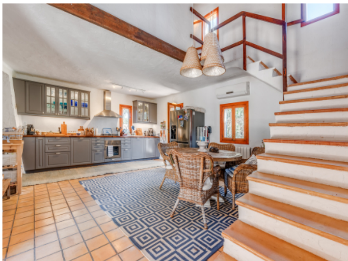
Renovierte Küche mit Essbereich