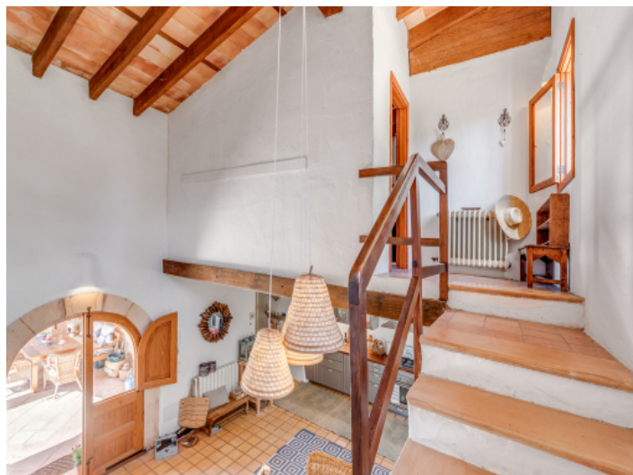
Treppe ins Obergeschoss