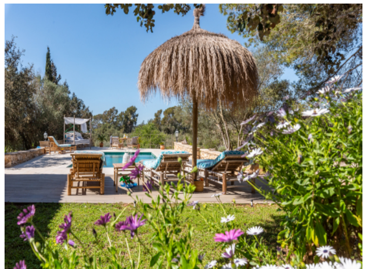
Idyllisch gelegener Poolbereich