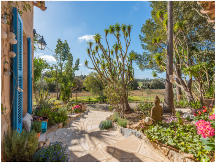
Schön angelegter Garten