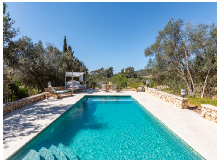
Entspannter Pool in absoluter Privatsphäre