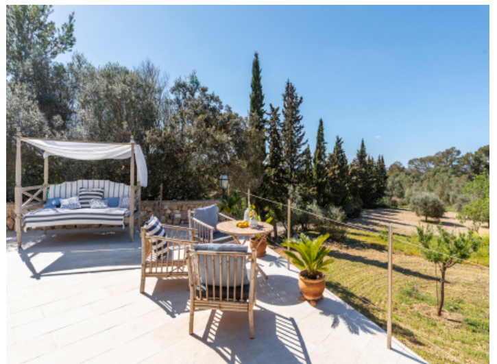
Traumhafte Sonnenterrasse mit Gartenblick