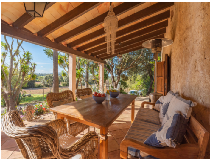
Essbereich im Freien mit Blick in die Natur