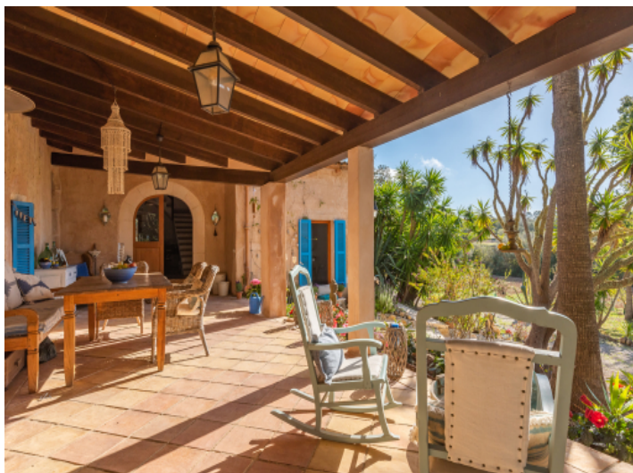
Große Terrasse mit Eingang zum Haus