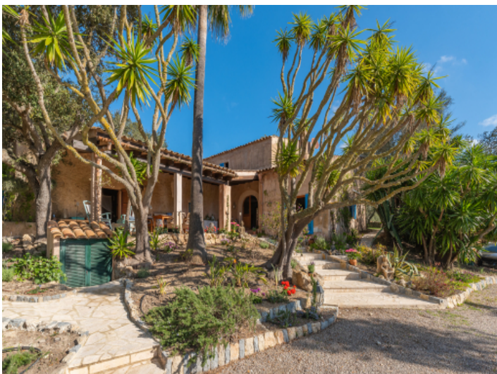
Zugang und Blick zur Finca