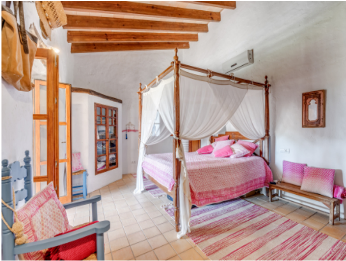
Gemütliches Schlafzimmer mit Terrasse