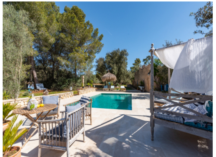
Perfekter Ort für heiße Sommertage