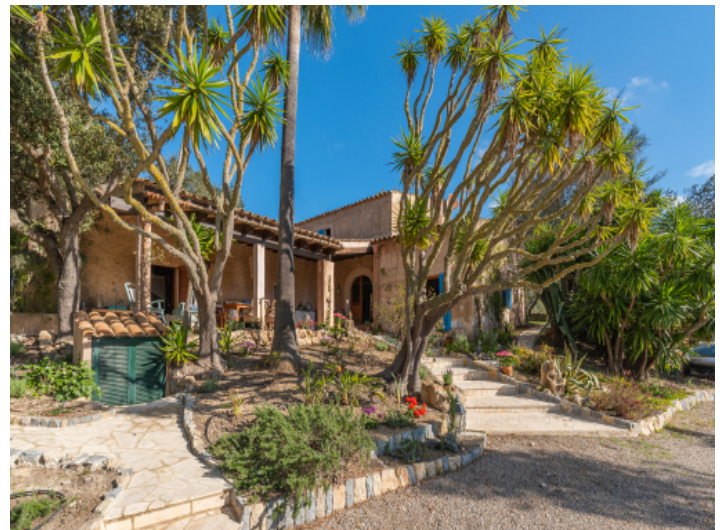
Zugang und Blick zur Finca