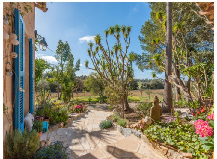
Schön angelegter Garten