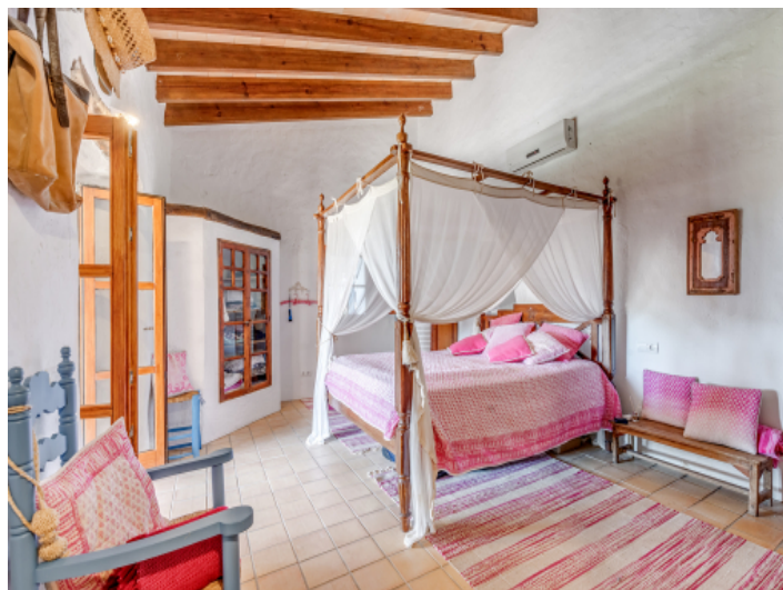
Gemütliches Schlafzimmer mit Terrasse