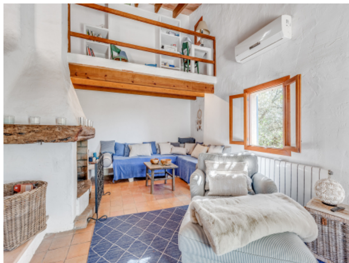
Wohnbereich mit Terrassenzugang