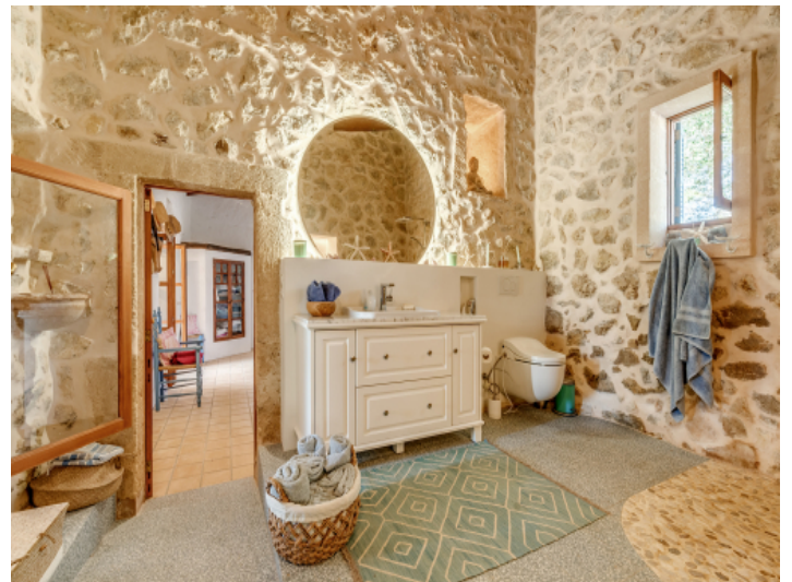
Authentisches Badezimmer mit Charme