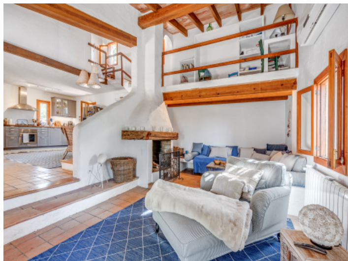
Gemütlicher Wohnbereich mit offenem Kamin