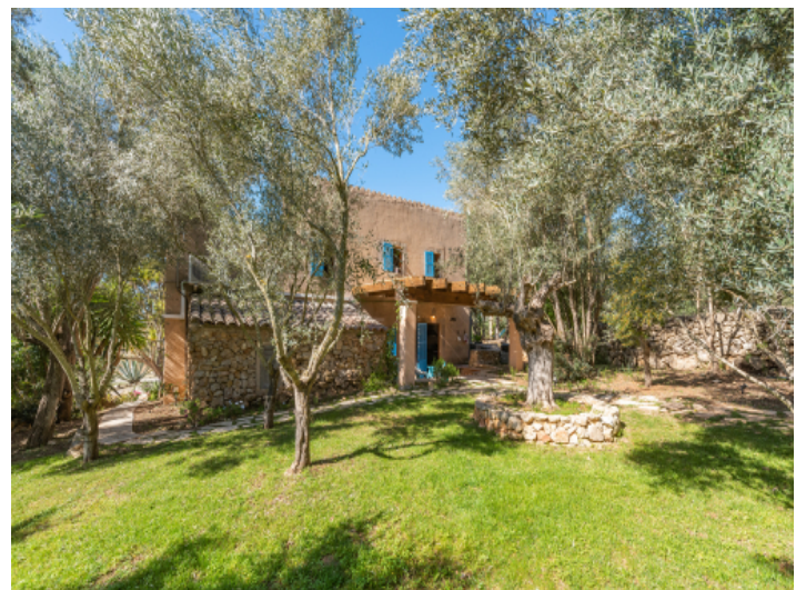
Grüner mediterraner Garten