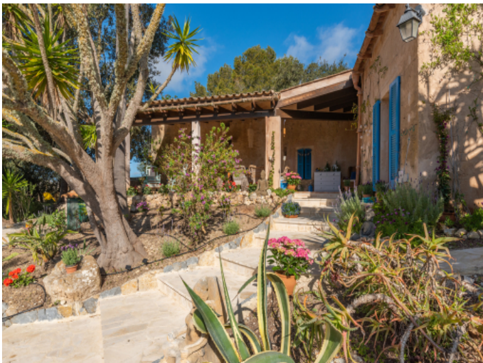
Finca mit mediterranem Garten