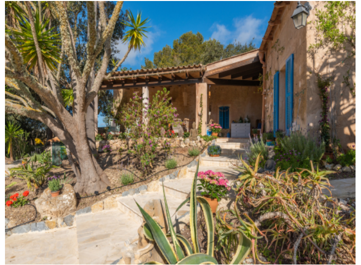
Finca mit mediterranem Garten