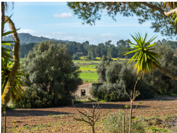
Blick über die grüne Landschaft