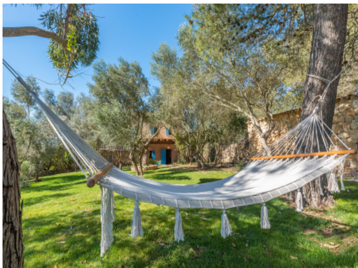
Verschiedene Plätze zum Entspannen