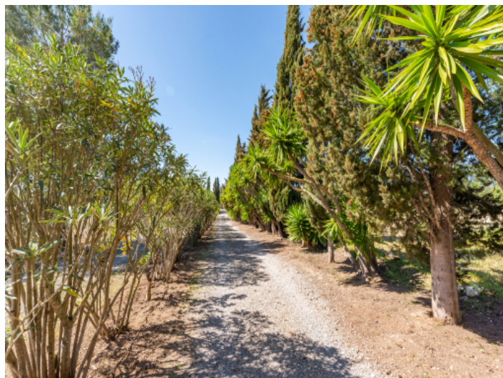
Yuccapalmen-Allee zur Finca