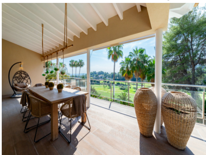
Überdachte Terrasse mit Sitzmöglichkeit