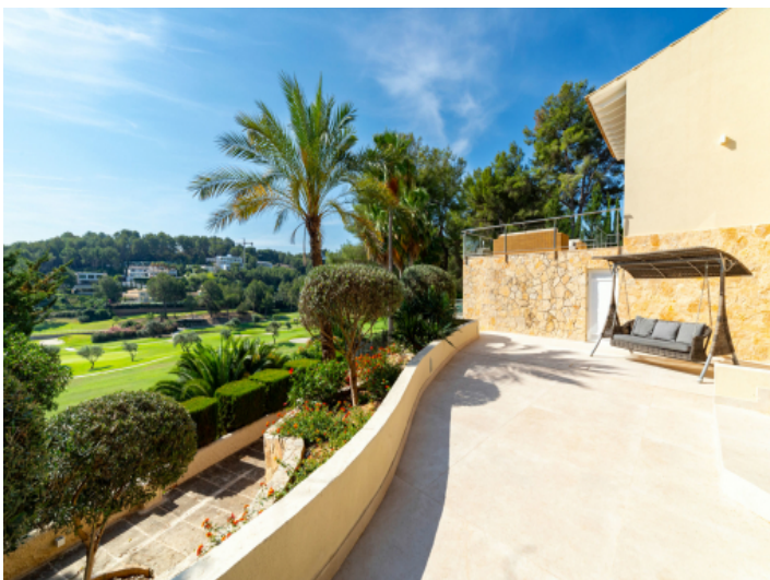
Sonnterrasse mit Ausblick