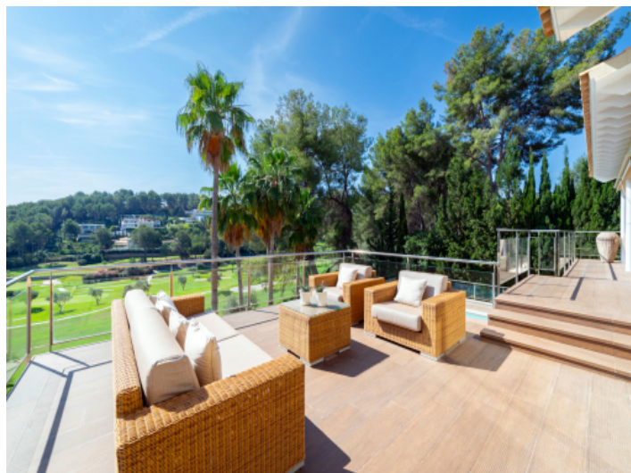
Sonnenterrasse mit Weitblick