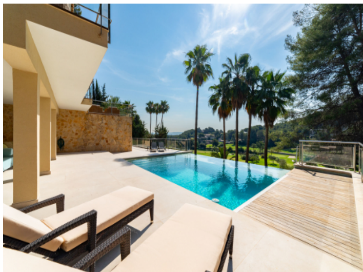
Familienfreundliche Villa mit Pool und erstklassigem Blick