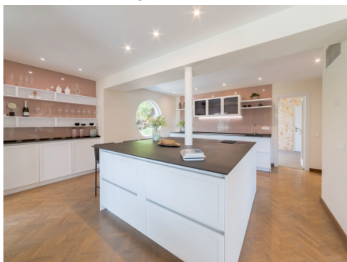
Komplett ausgestattete Küche