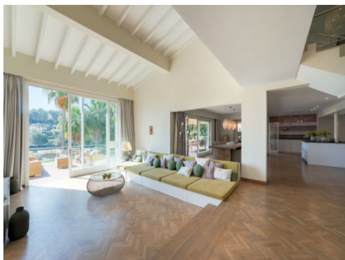
Sehr geräumiger Wohnbereich