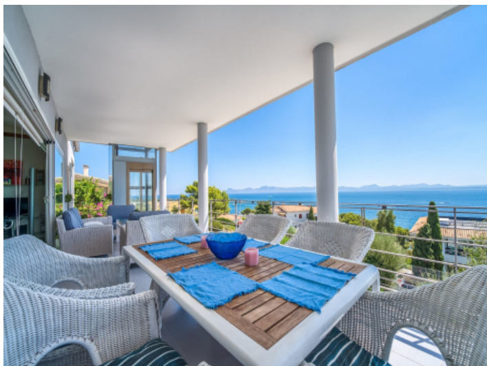
Überdachte Terrasse mit Weitblick