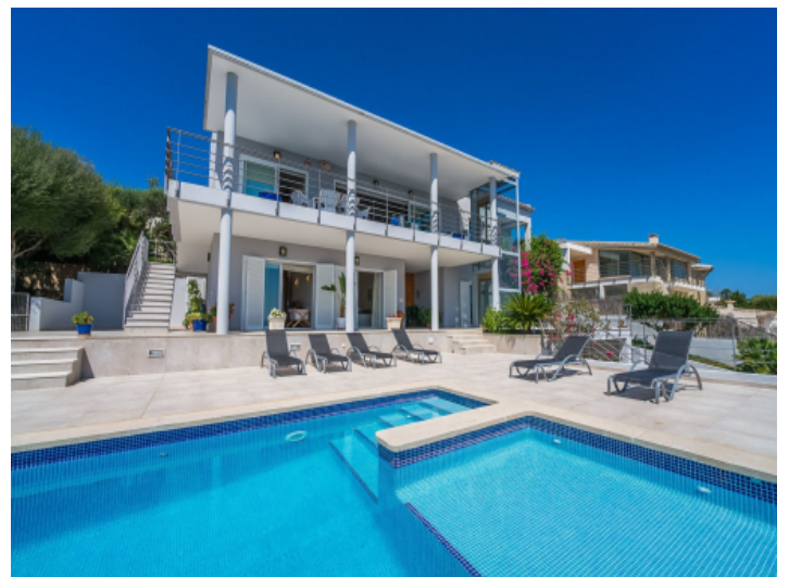
Außenansicht und Pool