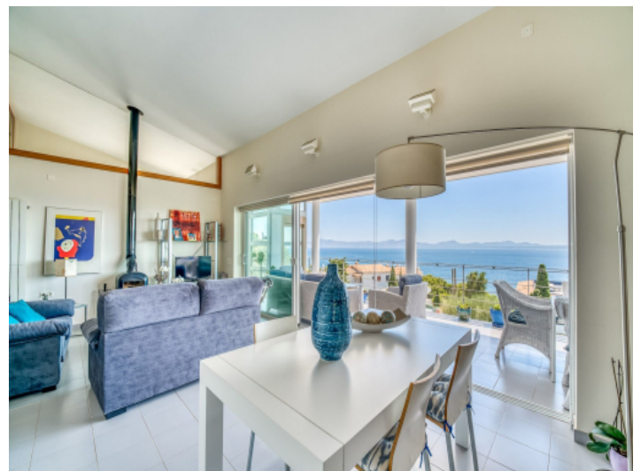
Wohn-/Essbereich mit Terrassenzugang