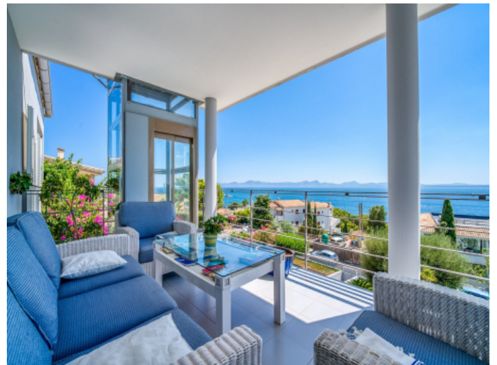
Loungeterminale mit Meerblick