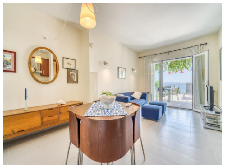
Weiterer Wohn-/Essbereich mit Terrassenzugang