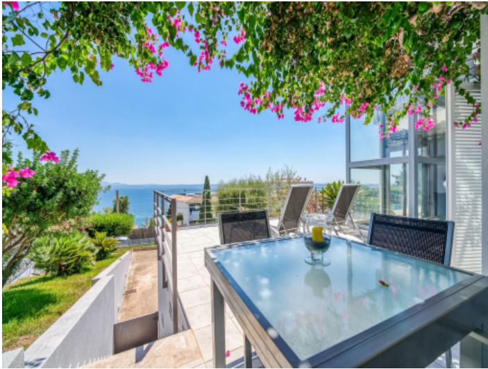
Essbereich im Freien