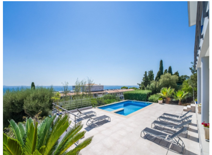
Weitläufiger Poolbereich mit Meerblick