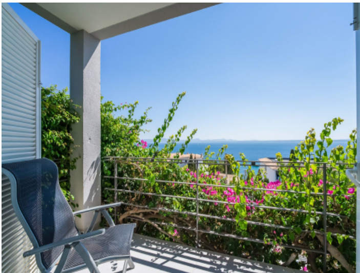
Überdachte Terrasse mit Meerblick