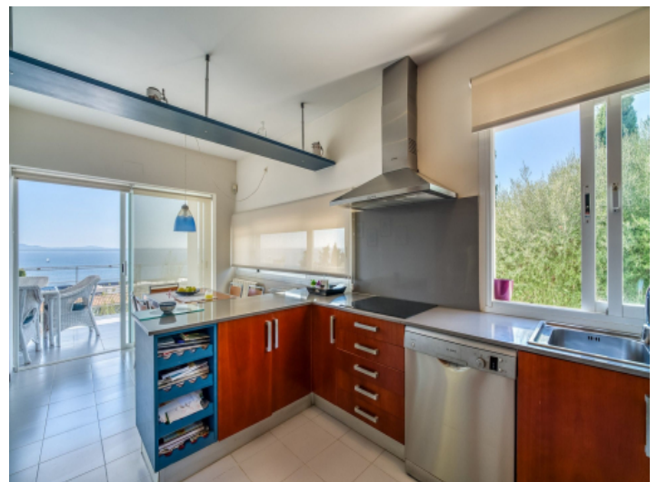
Komplett ausgestattete Küche