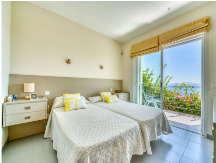
Eines von 4 Schlafzimmer