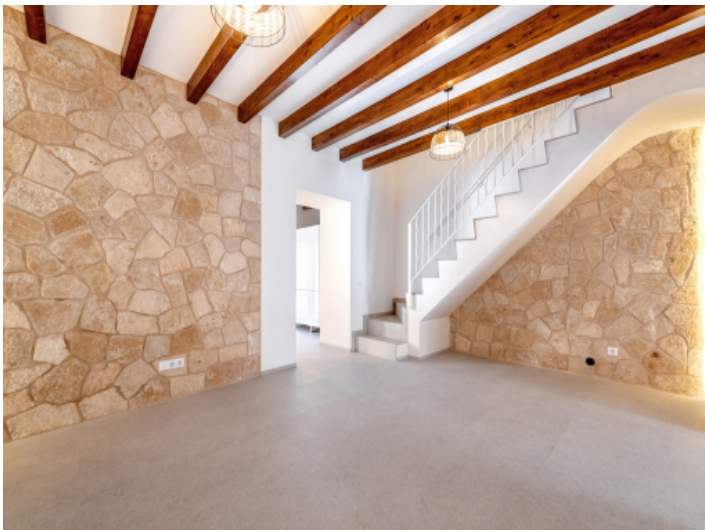
Wohnbereich mit Natursteinwand und Holzbalkendecke