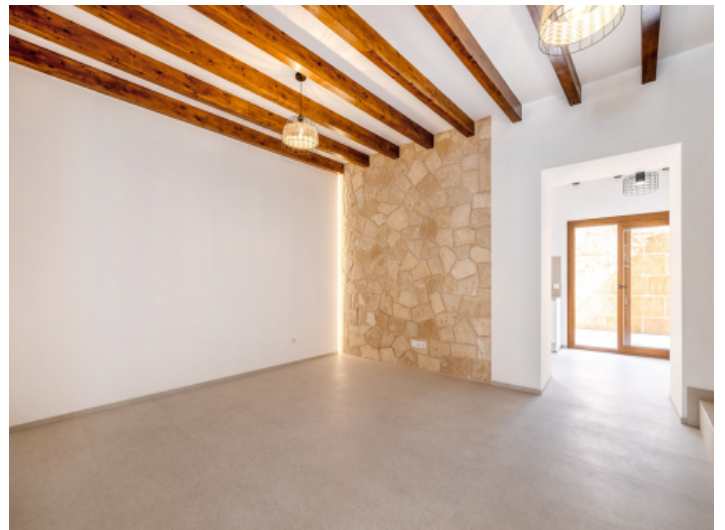
Wohnbereich mit Natursteinwand und Holzbalkendecke