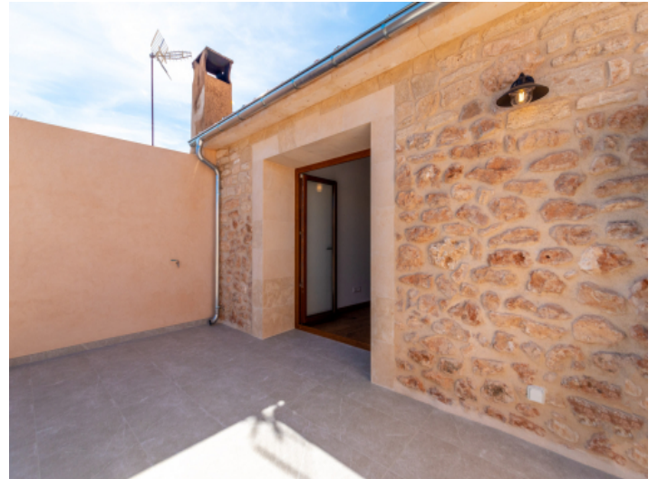
Ansicht des Balkons