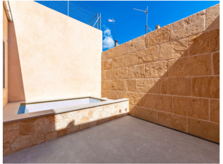
Patio mit Pool