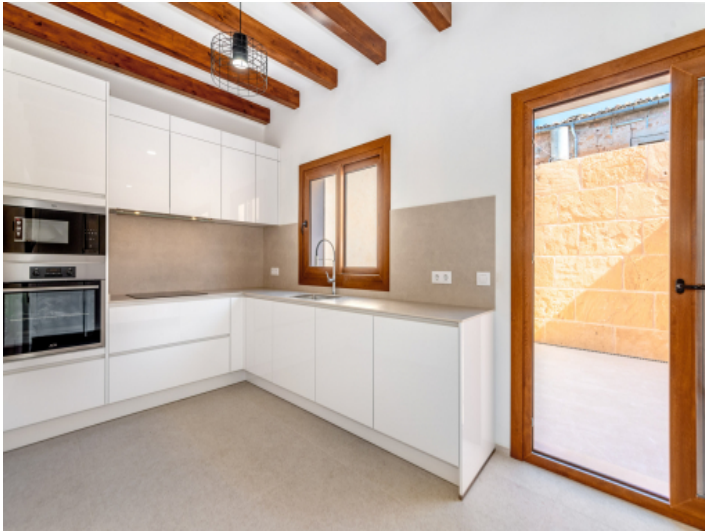
Zugang zum Patio