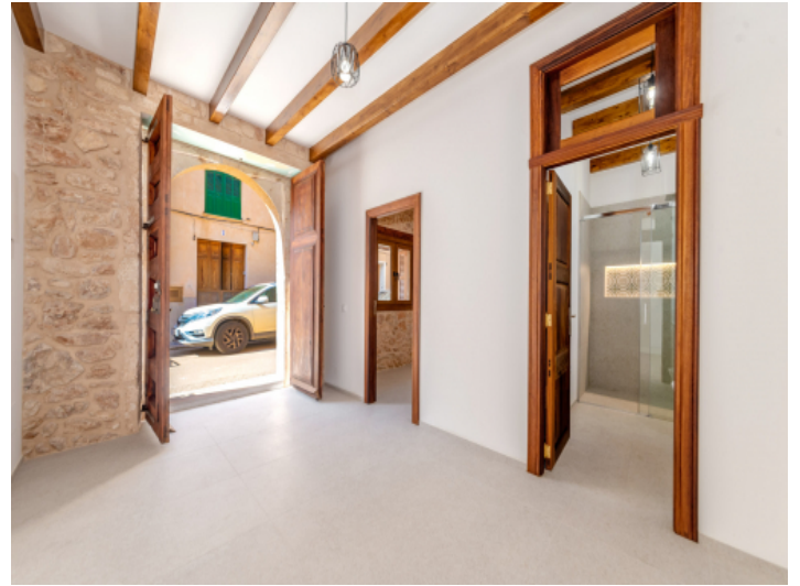
Eingangsbereich und Gäste-WC