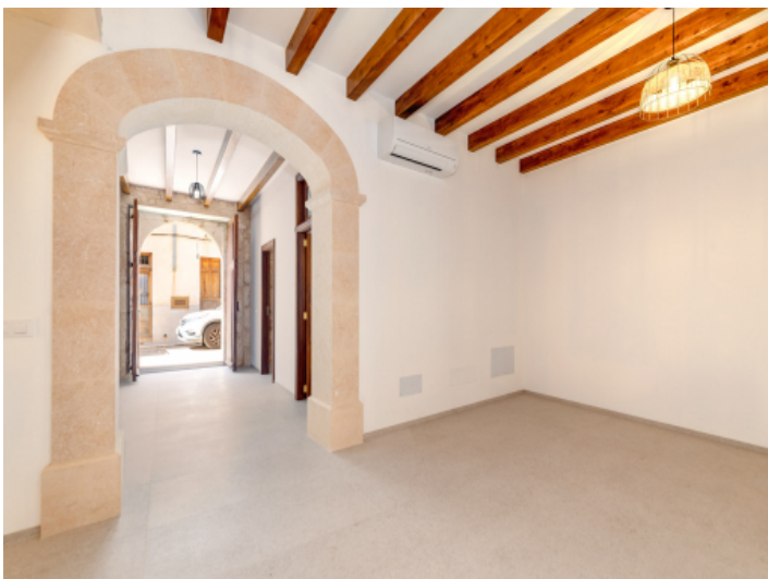
Wohnbereich mit Natursteinwand und Holzbalkendecke