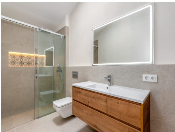
Modernes Badezimmer mit ebenerdiger Dusche