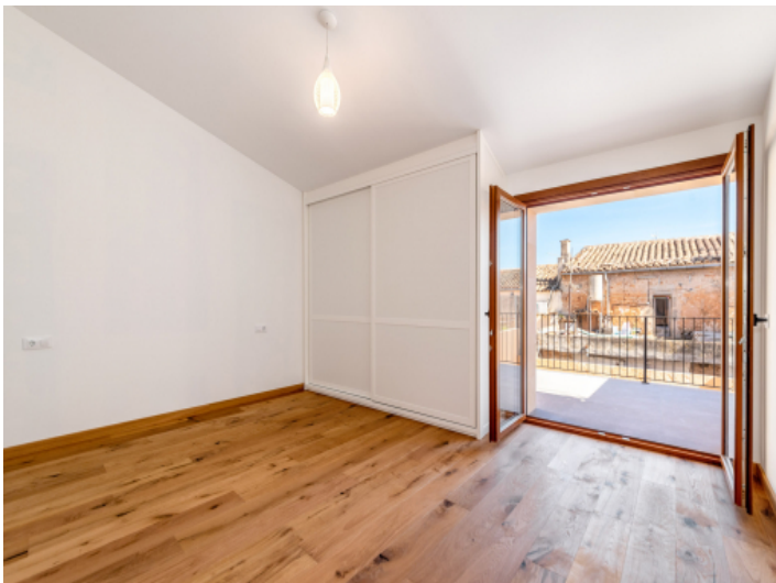
Hauptschlafzimmer mit Balkonzugang