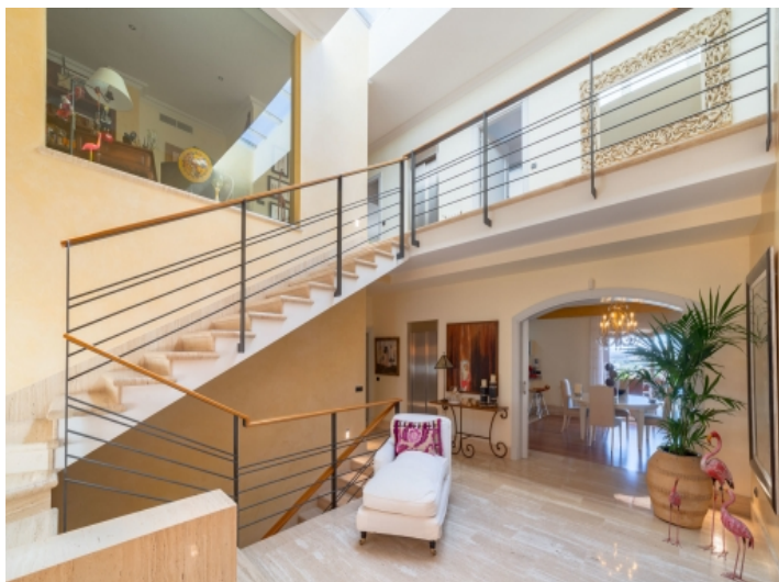
Beeindruckender Eingangsbereich mit hohen Decken