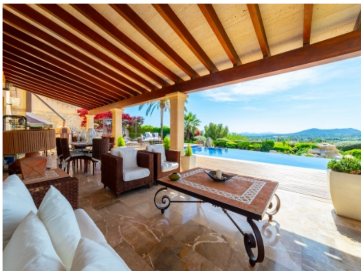
Tolle überdachte Terrasse mit Weitblick