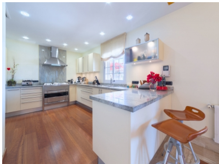
Voll ausgestattete, moderne Küche