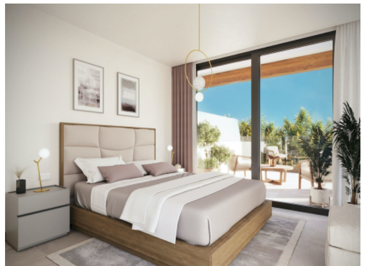
Helles Schlafzimmer mit Terrasse