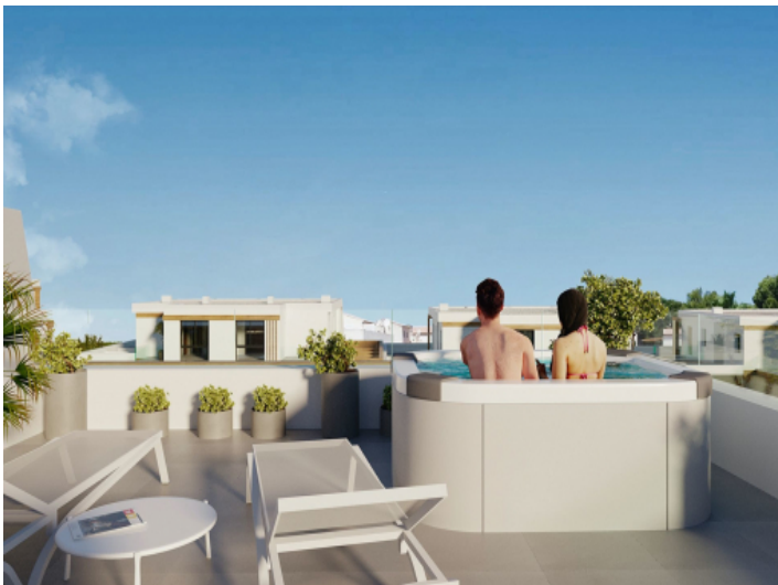
Jacuzzi auf der Dachterrasse