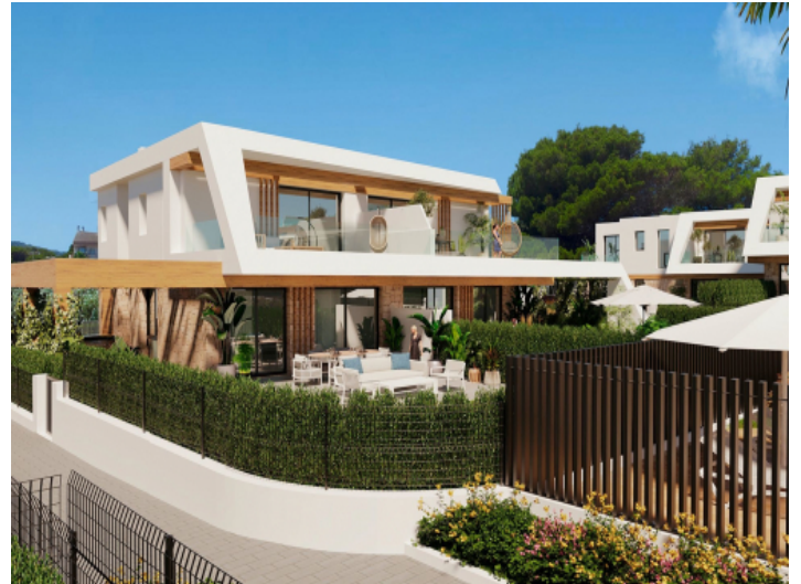
Außenansicht des Reihenhauses