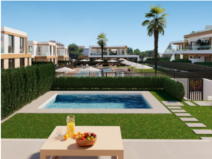
Neubau Doppelhaushälfte mit privatem Pool in Cala Ratjada