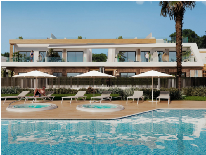
Gemeinschaftspool mit Sonnenliegen