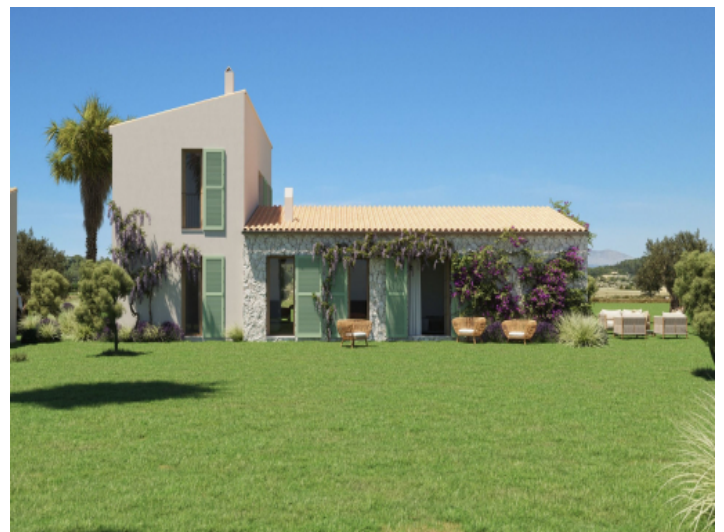
Außenansicht und Garten