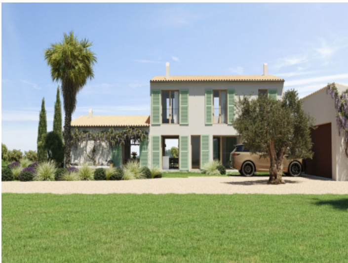
Seitenansicht der Finca und Garage