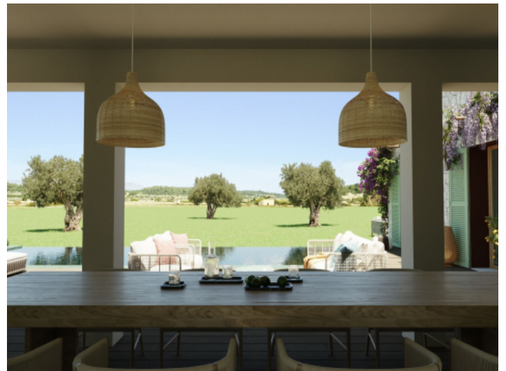
Überdachte Veranda mit Gartenblick