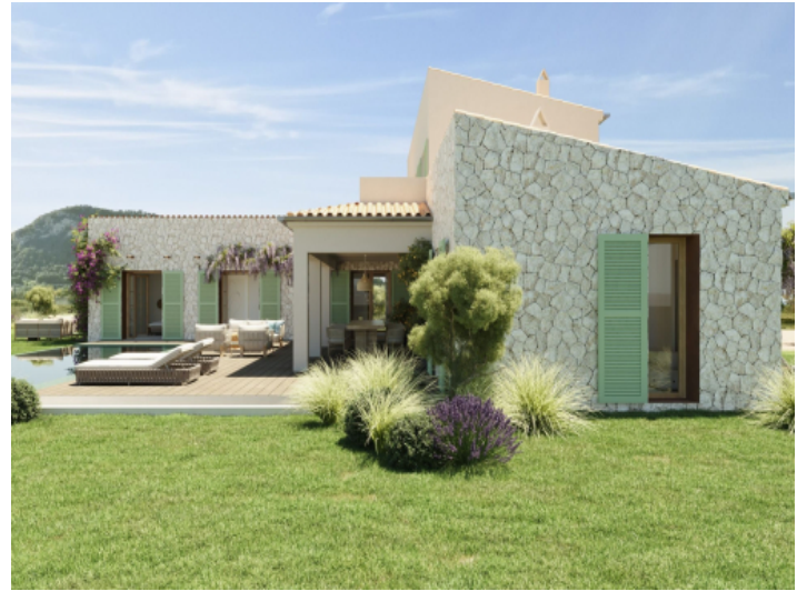
Mediterrane Terrasse und Garten