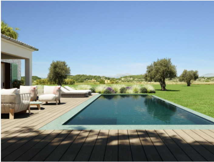
Poolbereich mit Weitblick