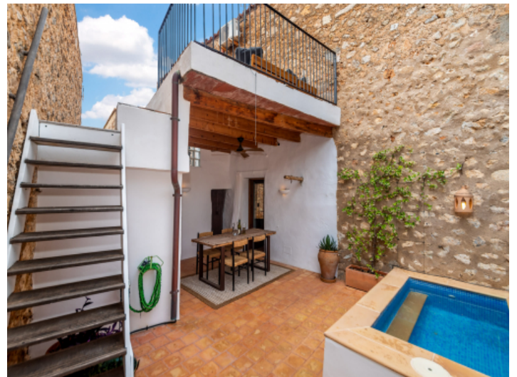
Patio mit Pool