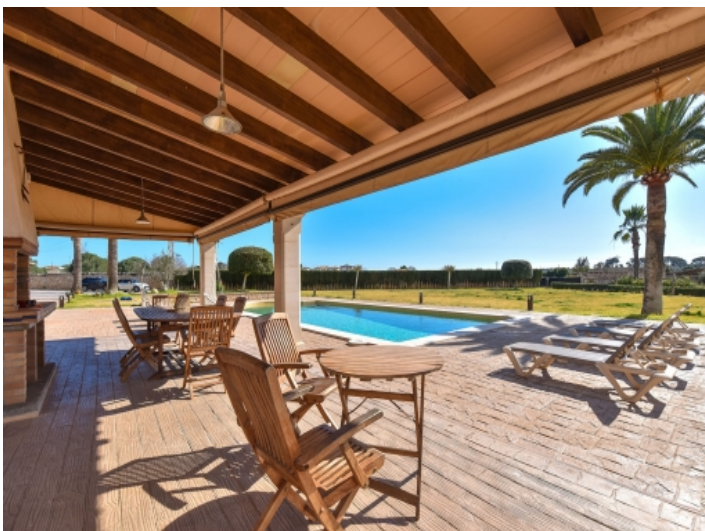
Große Terrasse mit Grillbereich