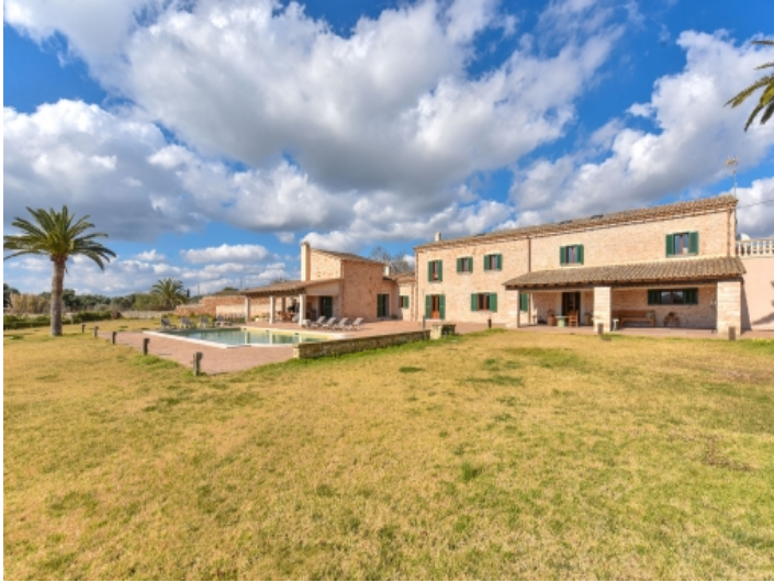
Außenansicht und Garten