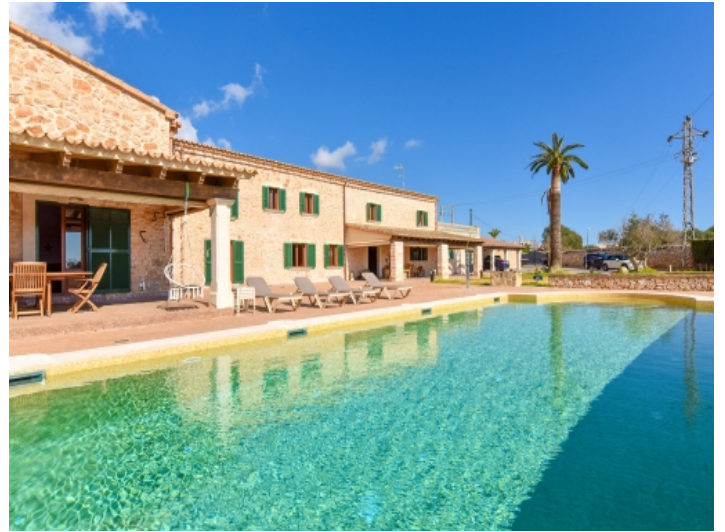
15 x 6 Meter Salzwasserpool