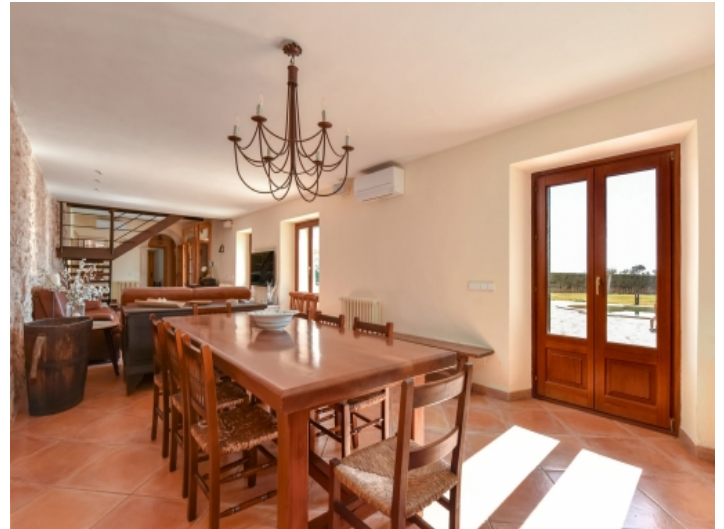
Essbereich mit Zugang nach Außen