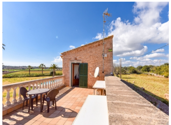
Dachterrasse mit fantastischen Ausblick