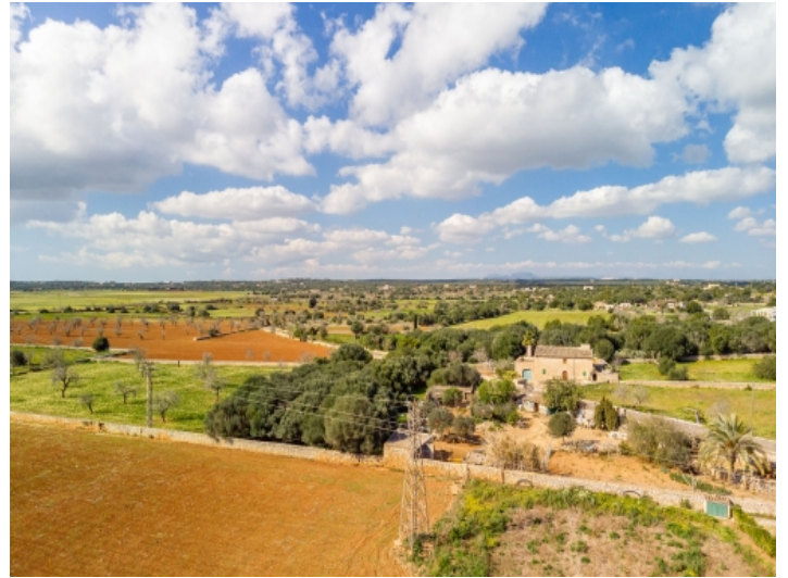
Blick über die Landschaft