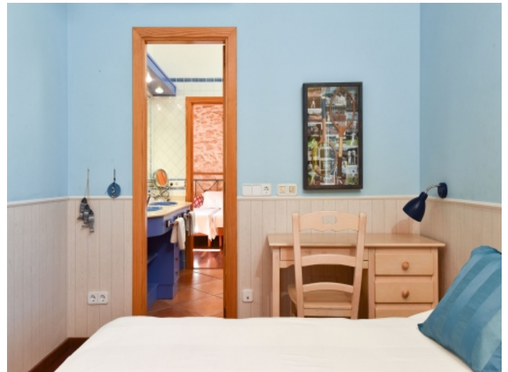
Eines von 4 Schlafzimmern