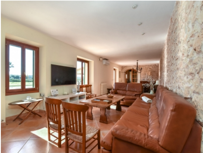
Offener Wohn-und Essbereich