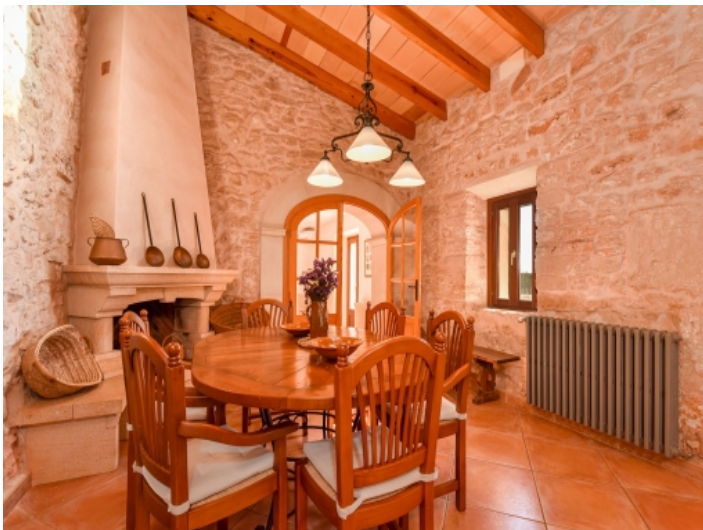
Essbereich mit offenem Kamin