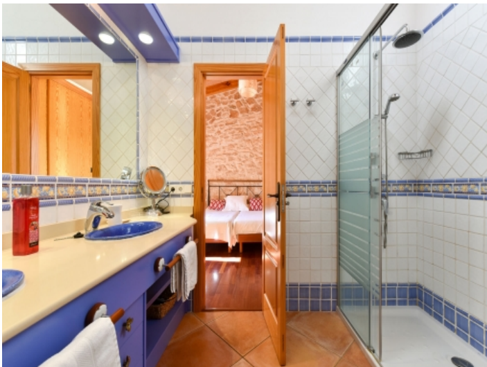
Eines von 4 Badezimmern