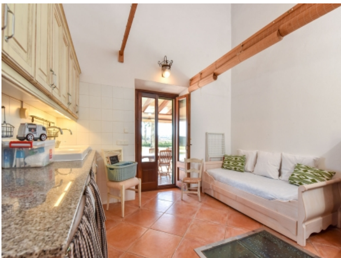
Gästezimmer mit Terrassenzugang