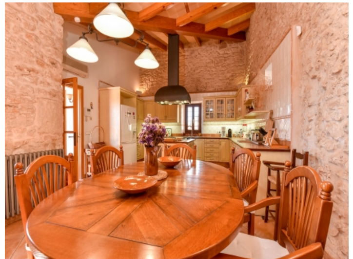
Gemütlicher Essbereich mit Landhausküche