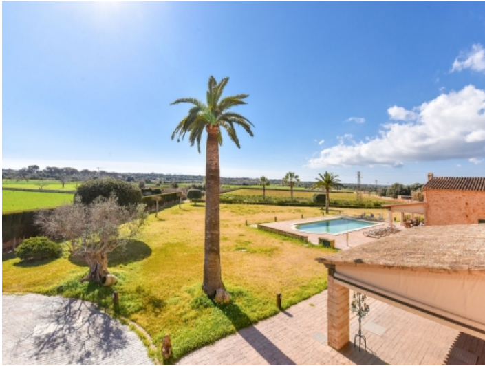
Blick von der Terrasse