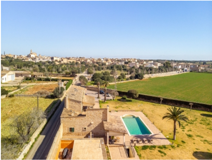
Finca aus der Vogelperspektive