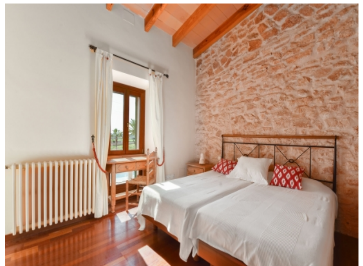
Schlafzimmer mit Natursteinwand