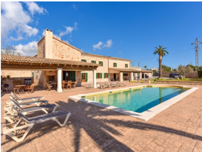
Poolbereich mit großen Terrassen