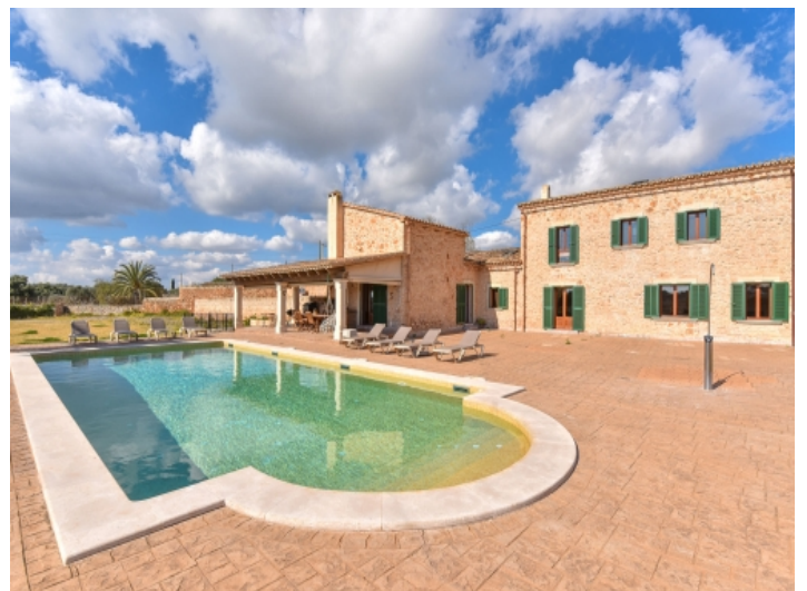
Poolbereich und Finca