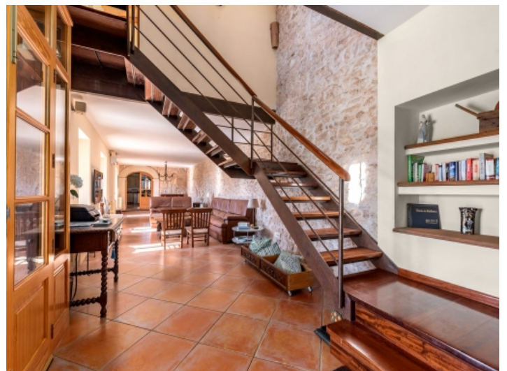
Eingangs - und Wohnbereich