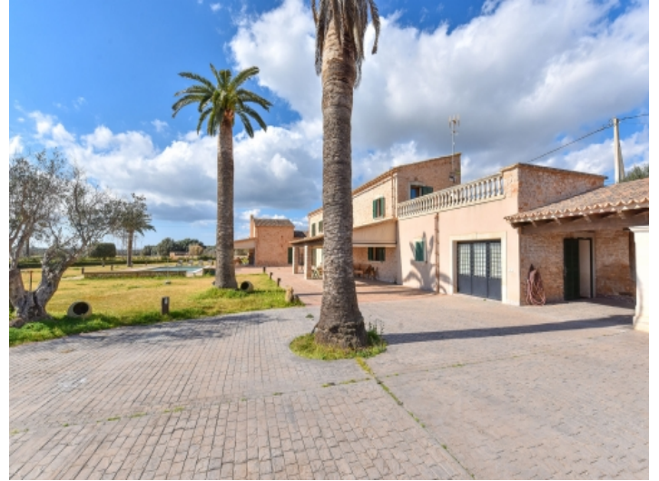
Außenansicht und Zufahrt