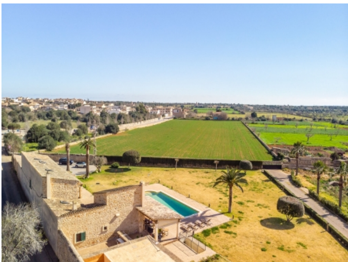
Finca von oben