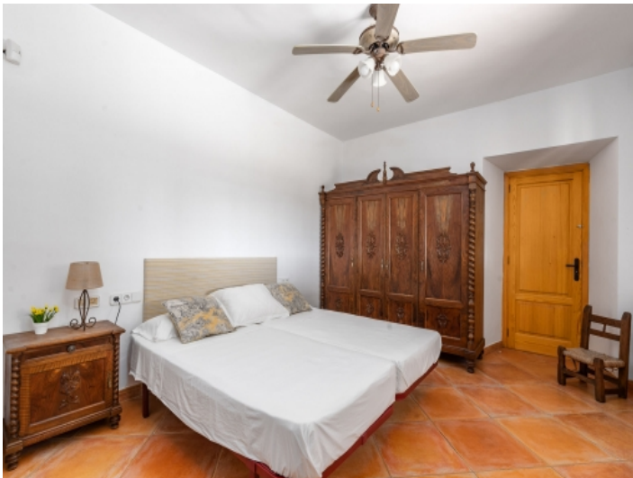
Eines von 4 Schlafzimmern