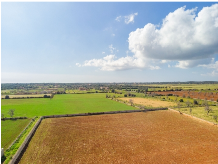
Blick über die Landschaft