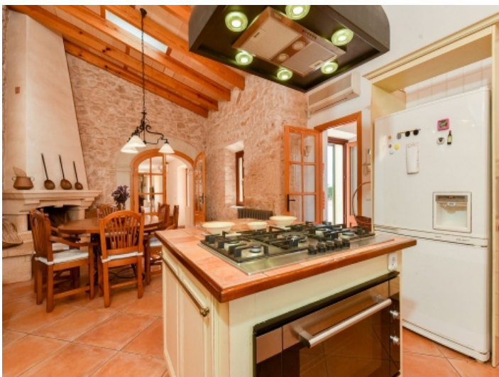
Küche mit Kochinsel