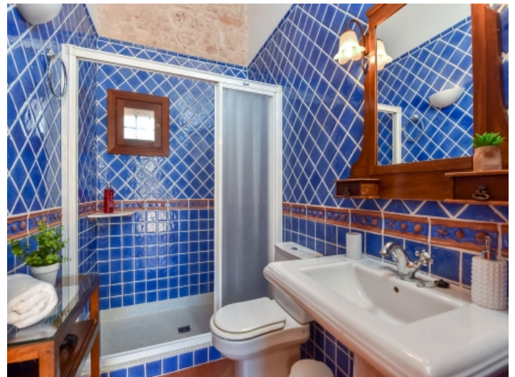
Eines von 4 Badezimmern