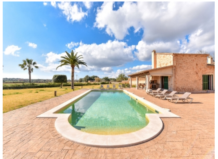
Pool, Terrasse und Garten