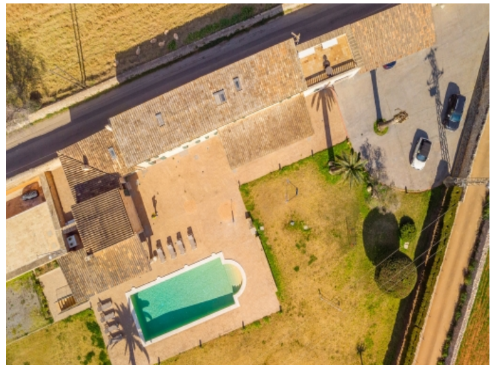
Finca von oben