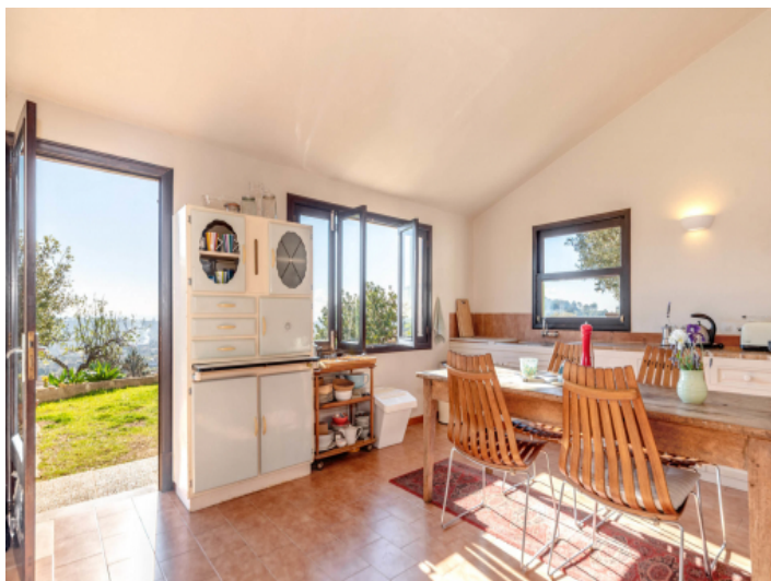
Separate Küche / Essbereich mit Kamin