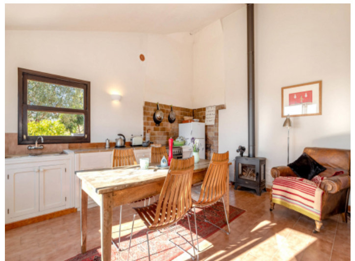
Separate Küche / Essbereich mit Kamin