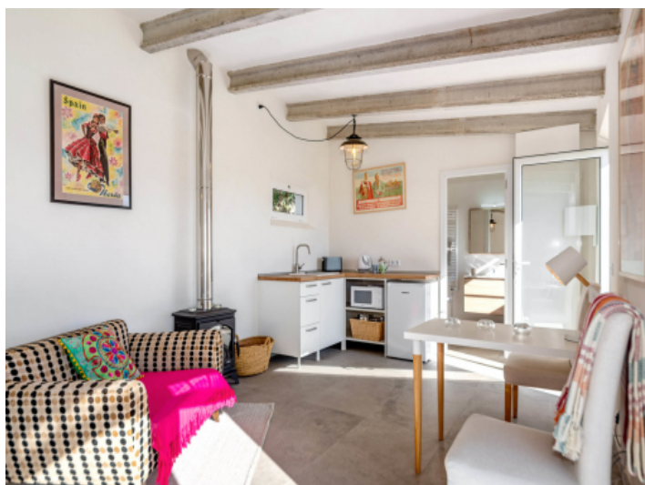
Offener Wohn- und Schlafbereich mit Kamin