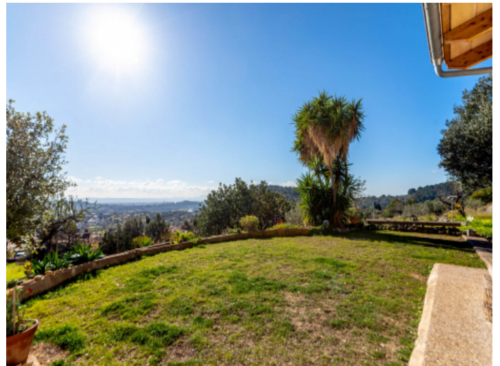
Blick in die Ferne