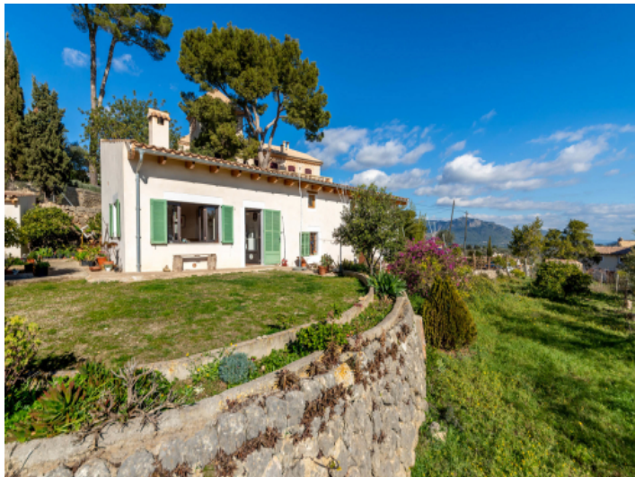
Traumhafte Finca mit Gästehaus und Weitblick in Selva