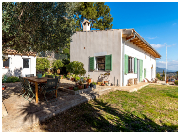
Terrasse und Außenbereich der Finca