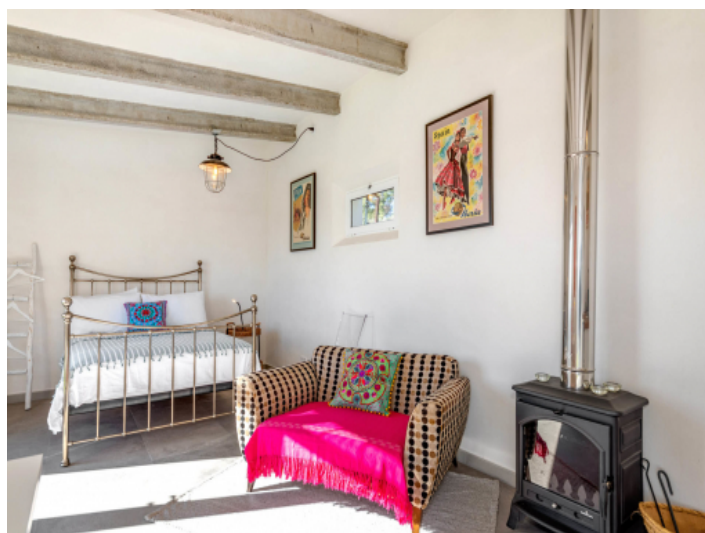
Offener Wohn- und Schlafbereich mit Kamin