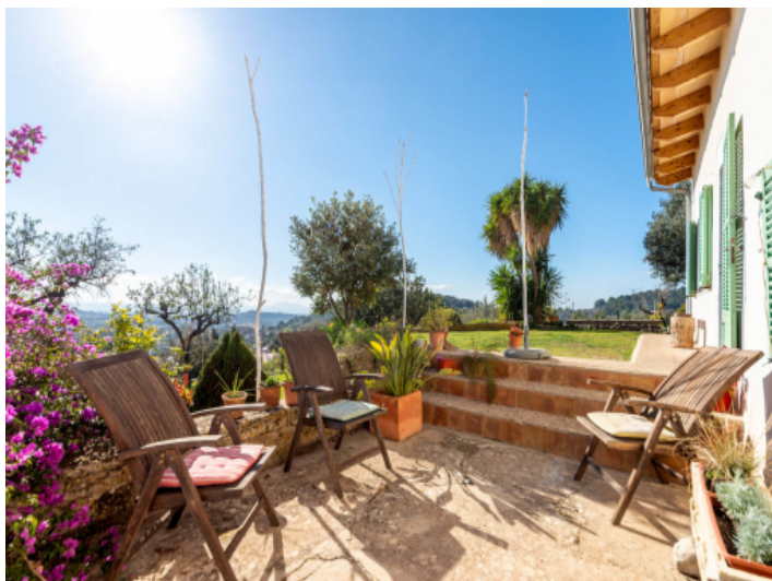
Gemütliche Terrasse vor dem Haus