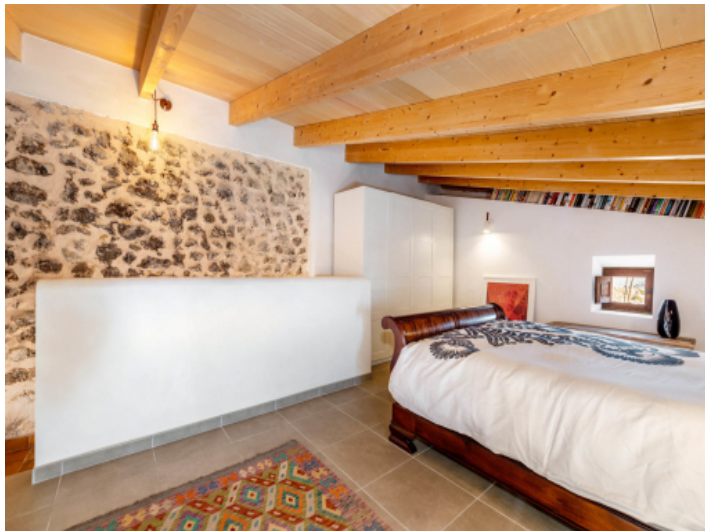
Schlafzimmer mit Natursteinwand