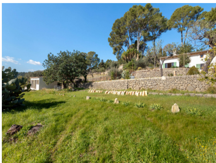
Ansicht des Grundstücks und des Gästehauses