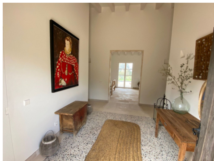
Eingangsbereich im Landhausstil