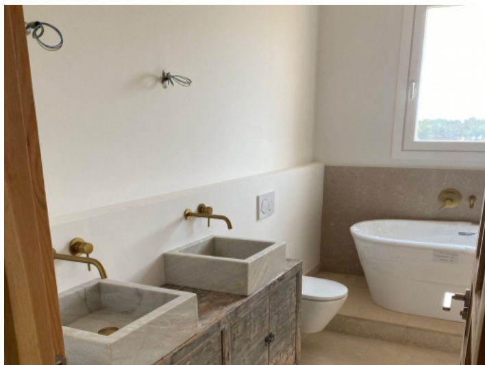
Landhaus mit 3 Badezimmern