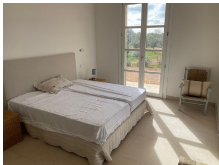
Eines von 3 Schlafzimmer