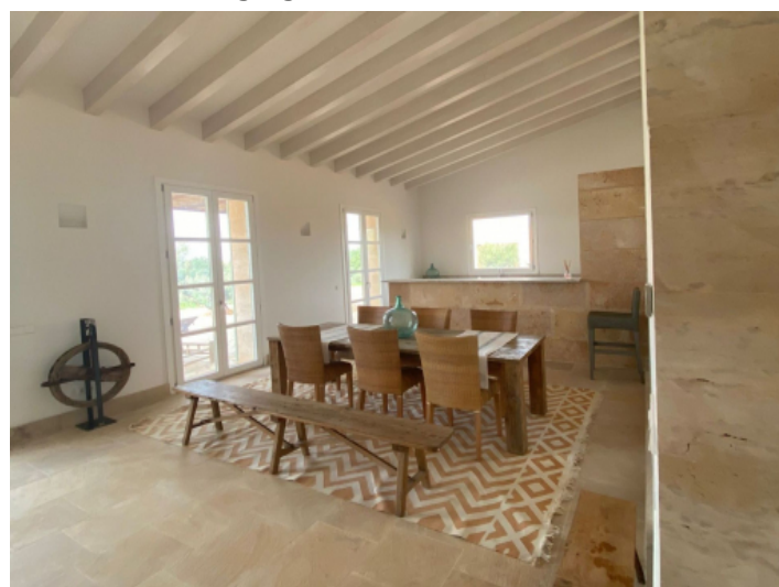
Essbereich und Küche