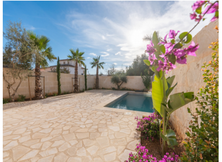
Sonnige Terrasse mit Pool