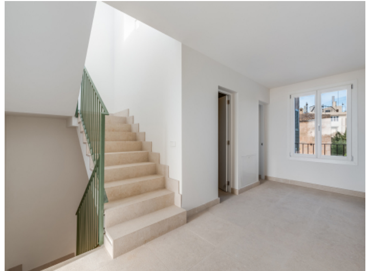
Blick in den Flur