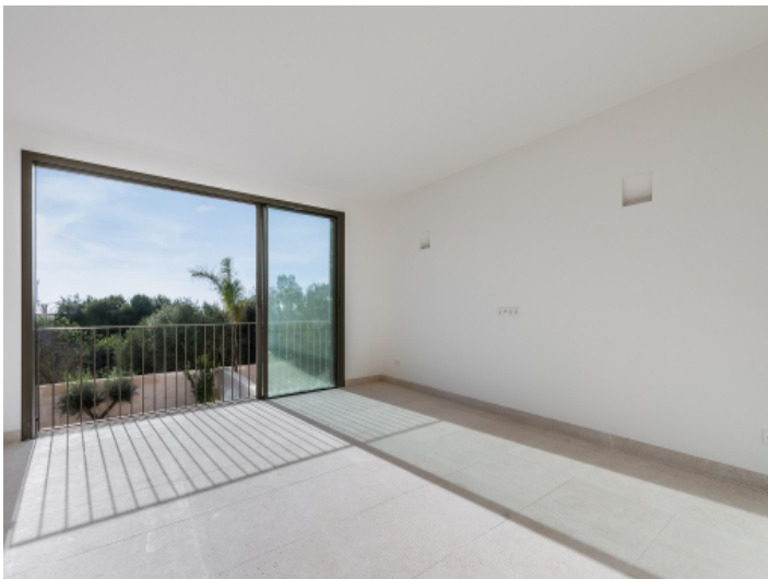
Wohnbereich mit Balkon