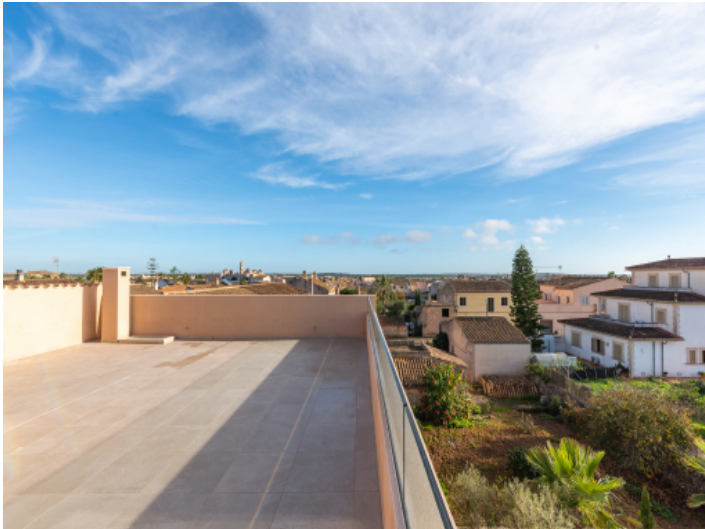
Dachterrasse mit Weitblick