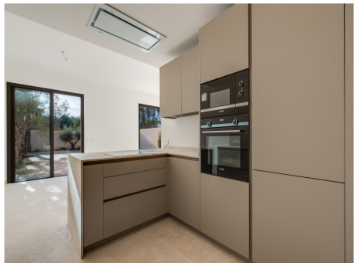
Offene Küche mit Kücheninsel