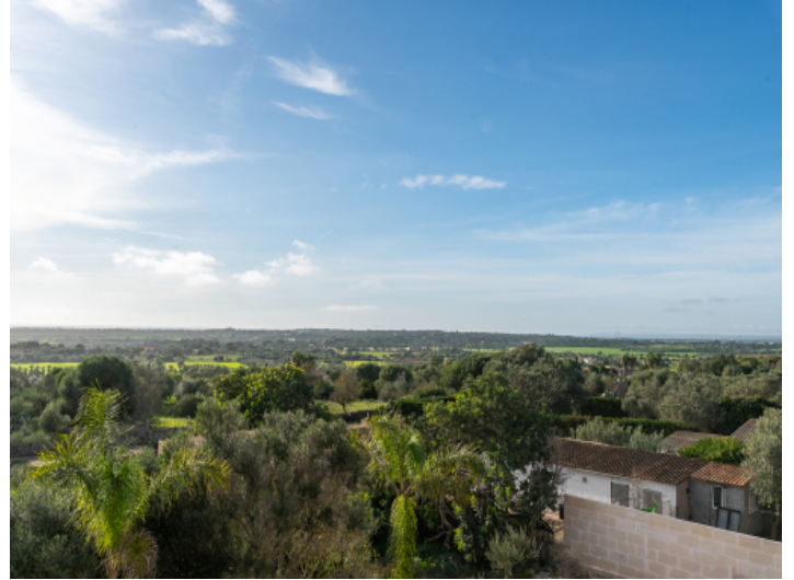
Blick von der Dachterrasse