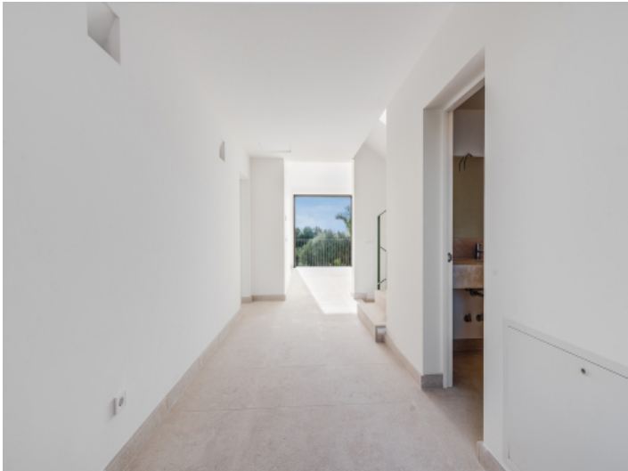
Blick in den Flur