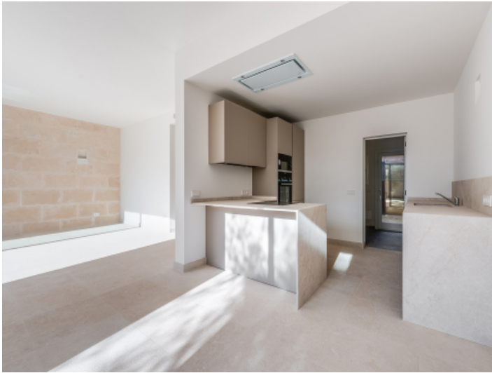
Alternative Ansicht der Küche