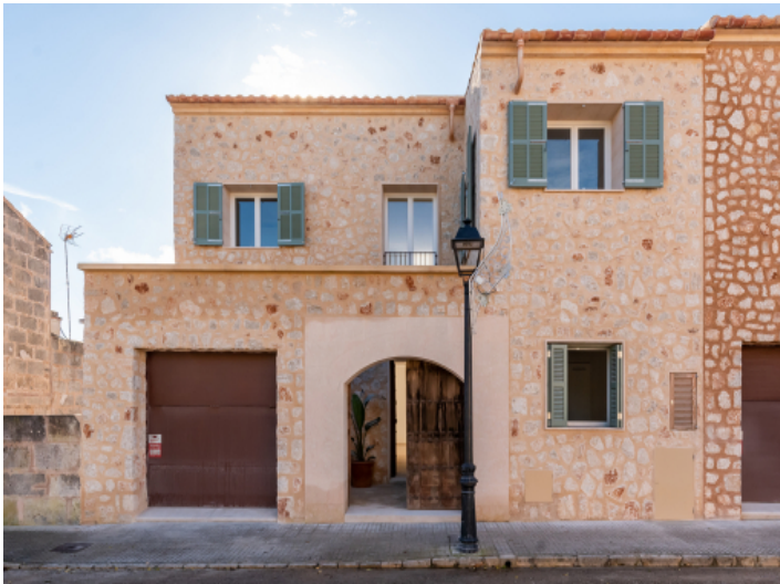
Außenansicht des Wohnhauses