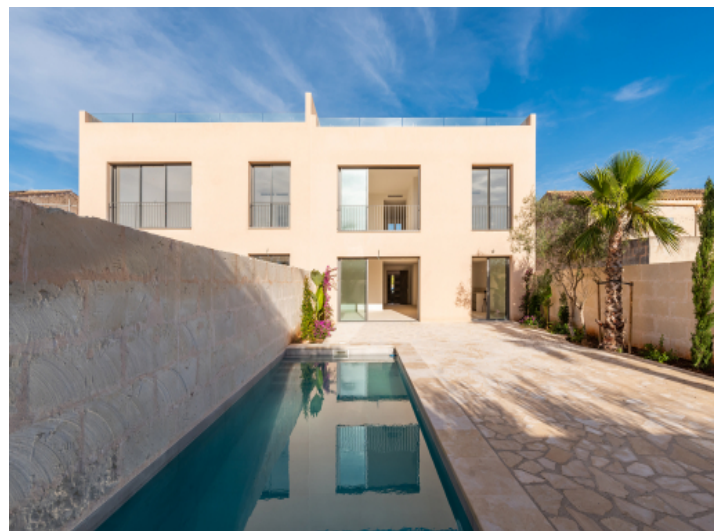
Blick auf den Pool