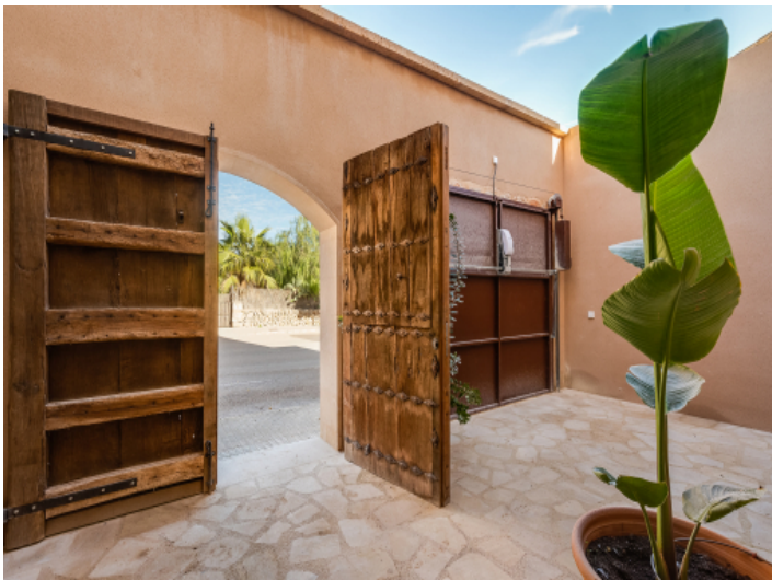
Eingangsbereich mit rustikaler Eingangstür