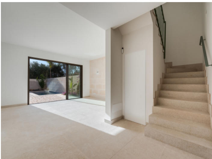
Wohnbereich und Treppenaufgang