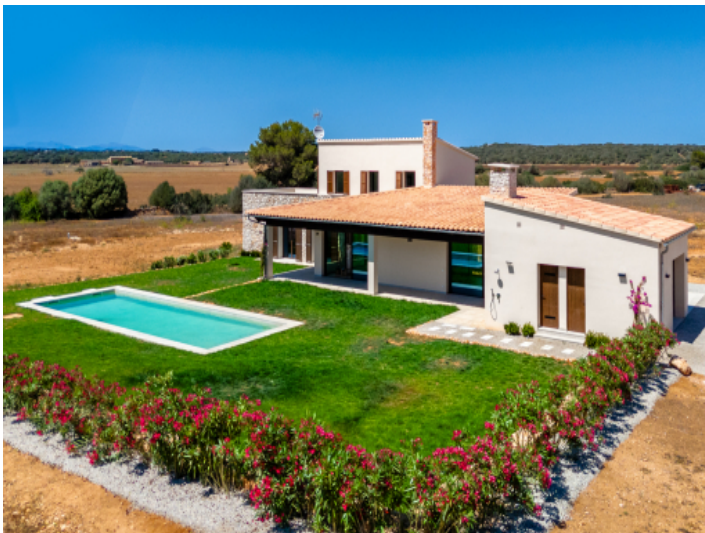
Ansicht auf die Finca