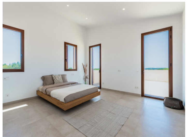
Schlafzimmer im Obergeschoss