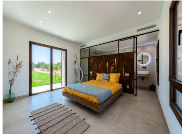
Schlafzimmer im Erdgeschoss