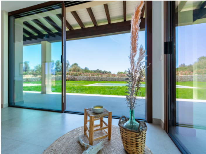
Aussicht in den Garten