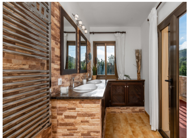
Badezimmer mit Terrassenzugang