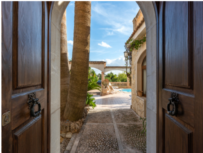
Eingang zum Haus