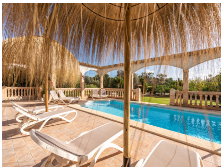
Pooloase mit Blick in den Garten