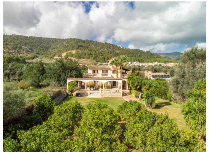
Die Finca aus der Vogelperspektive