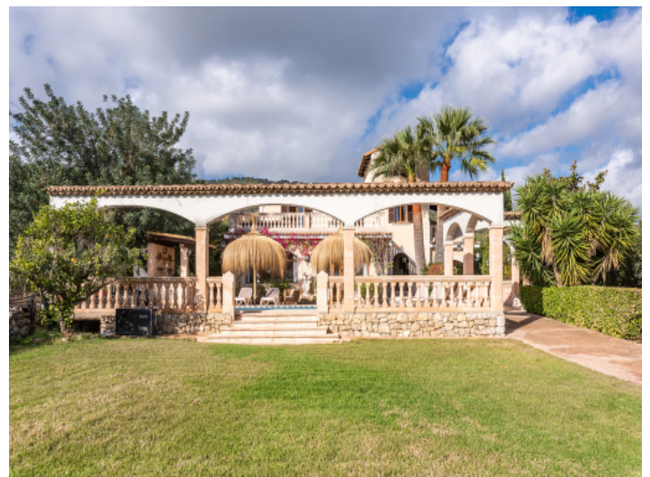
Finca und Garten