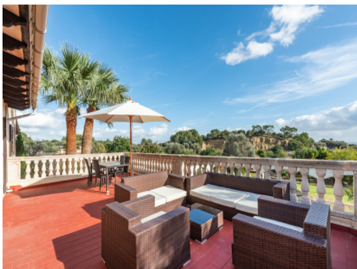
Obere Terrasse mit Ausblick