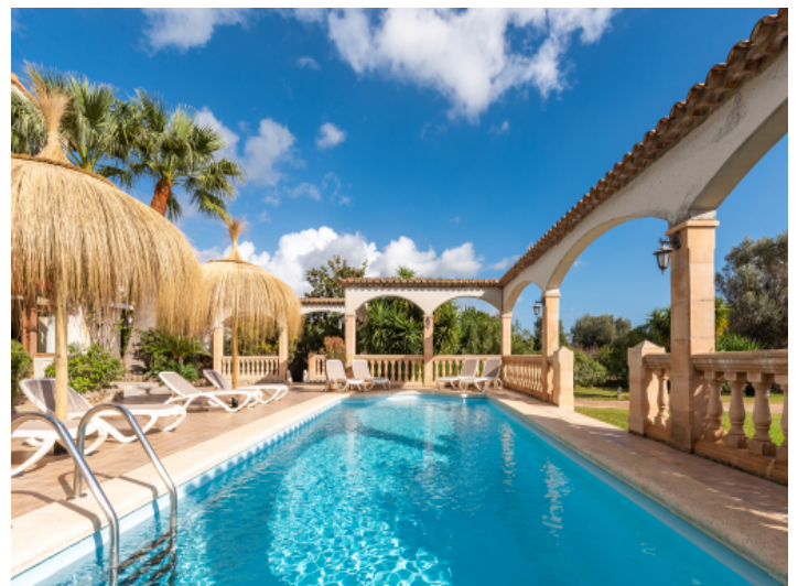
Traumhafte Villa mit Ferienvermietlizenz in exponierter Lage