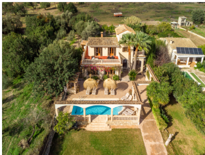
Traumhafte Villa mit Ferienvermietlizenz in exponierter Lage