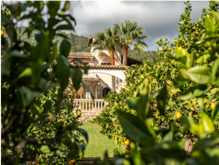
Finca und Garten