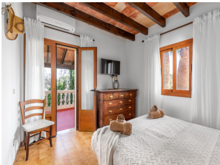
Schlafzimmer mit Terrassenzugang