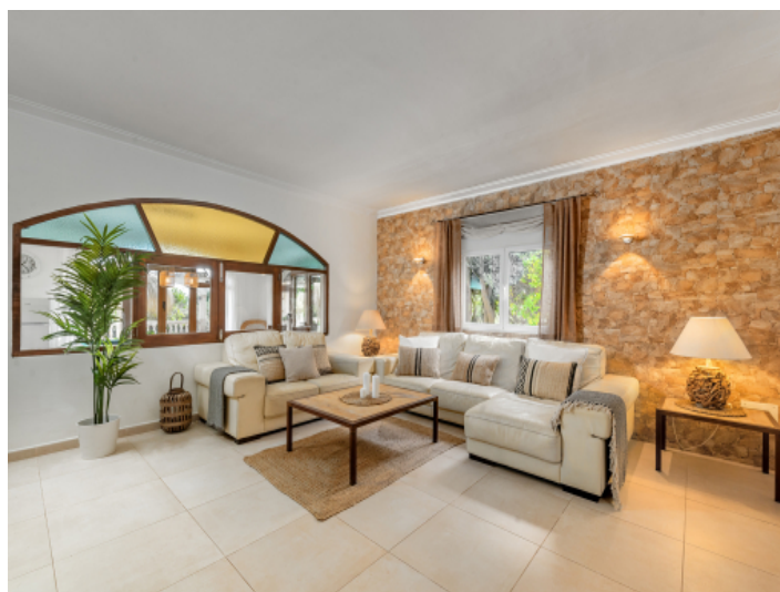
Wohnbereich mit Steinwand