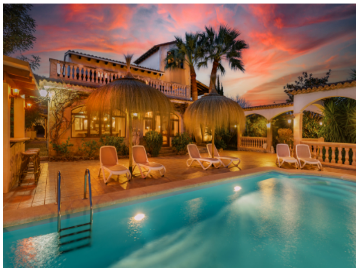
Der Poolbereich bei Nacht