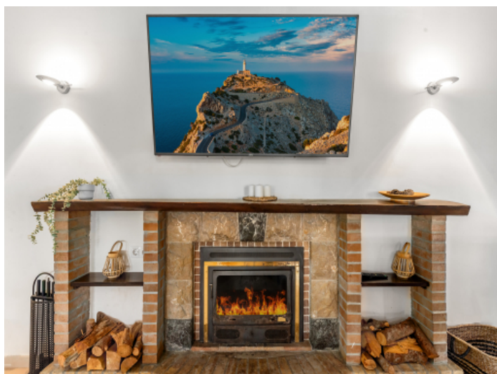
Gemütlicher Kamin für Wintertage