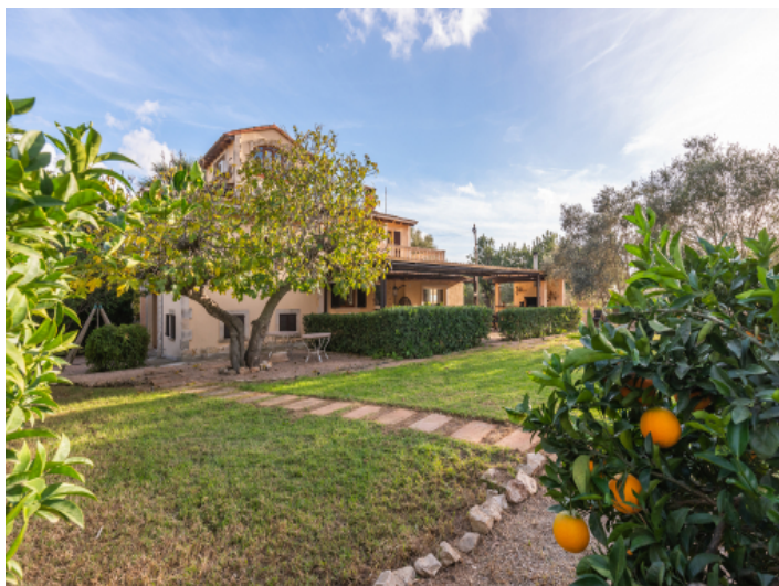
Garten mit Obstbäumen