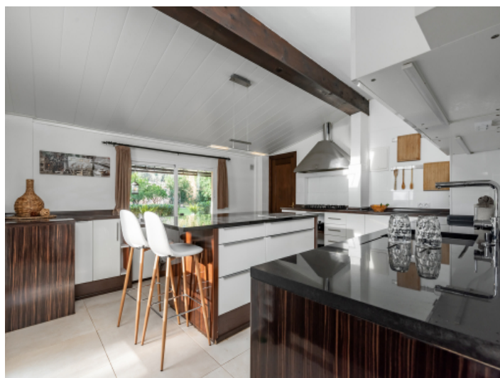
Große, moderne Küche