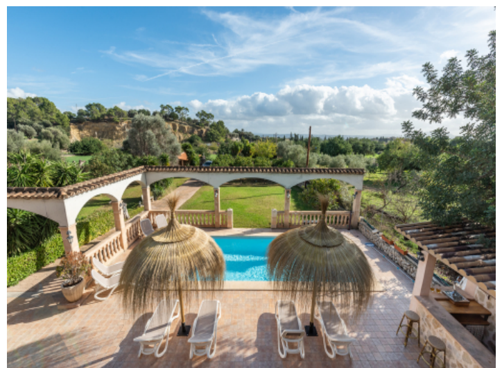
Blick über das Anwesen