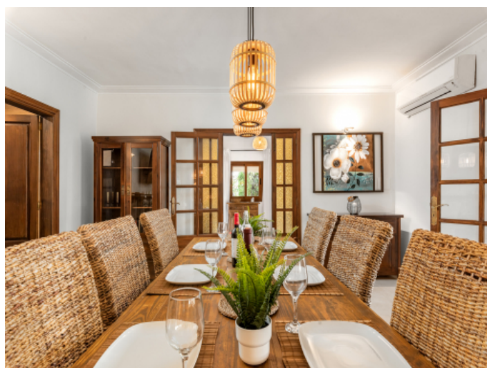
Essbereich im Zentrum des Raumes