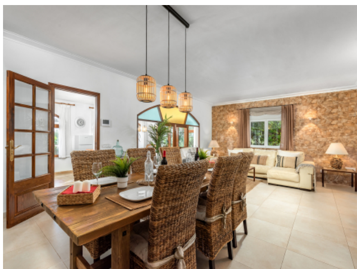
Offener Wohn-und Essbereich