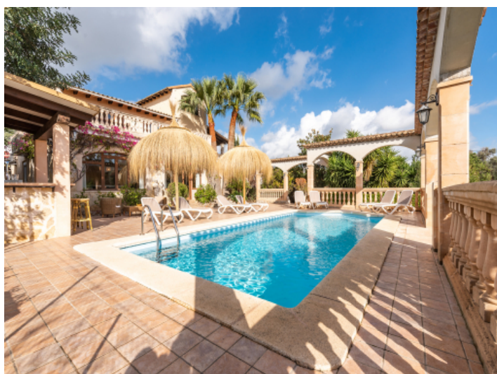
Wundervoller, sonniger Poolbereich