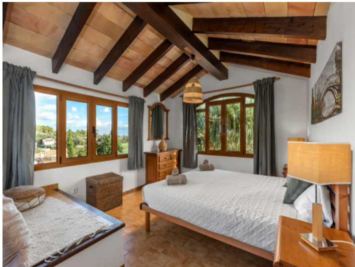
Schlafzimmer mit Holzbalkendecke