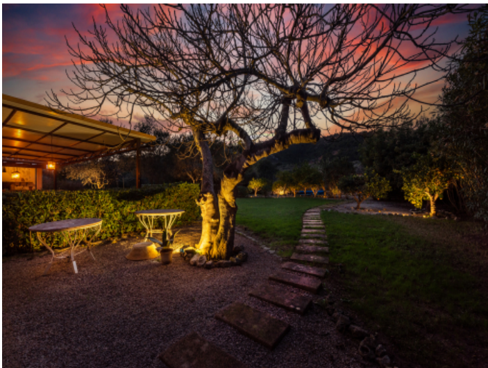
Blick in den Garten bei Nacht