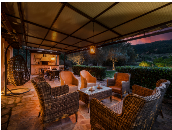
Abendstimmung auf der Terrasse