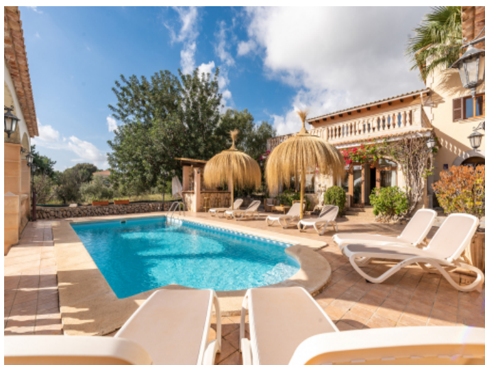
Blick vom Pool zum Haus