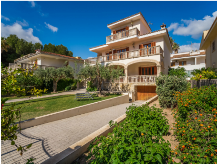
Anischt auf das Haus