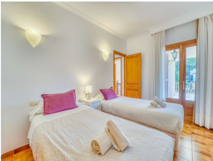
Eine von 6 Schlafzimmer