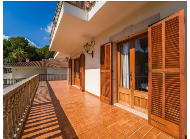
Terrasse obere Etage