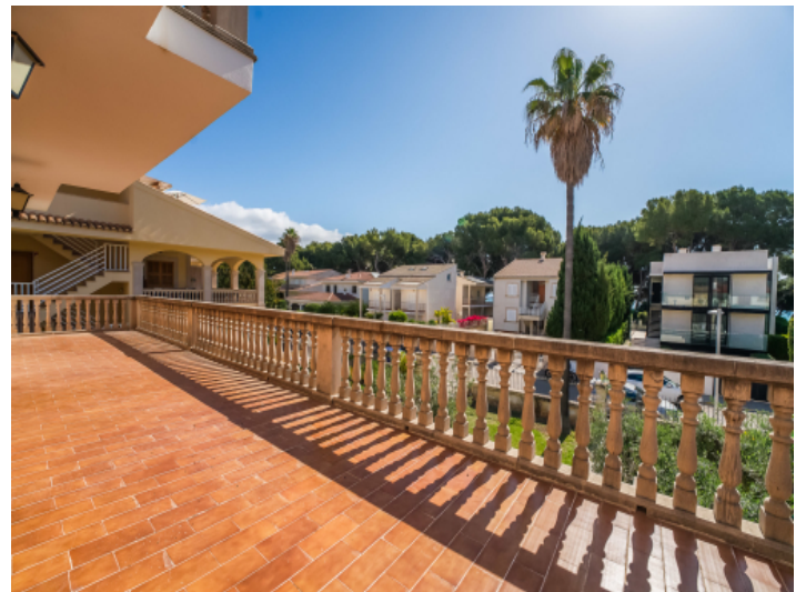
Terrasse 1. Etage