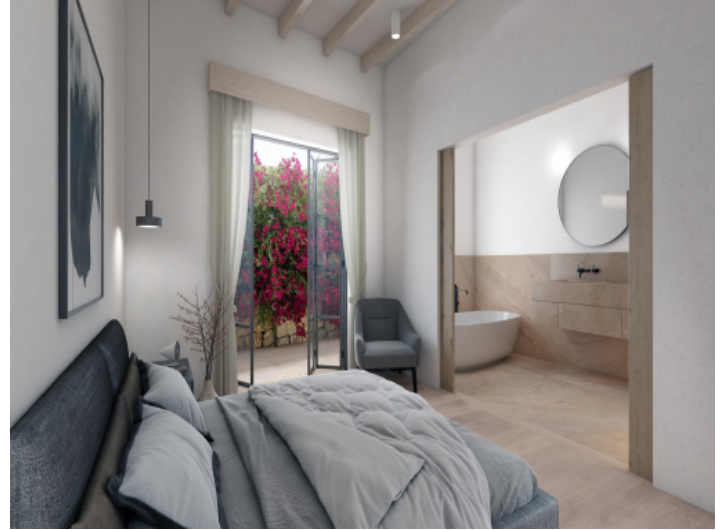
Schlafzimmer und Badezimmer