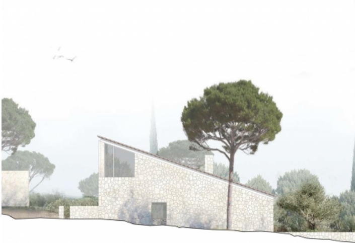
Ansicht der Studie der Architektur