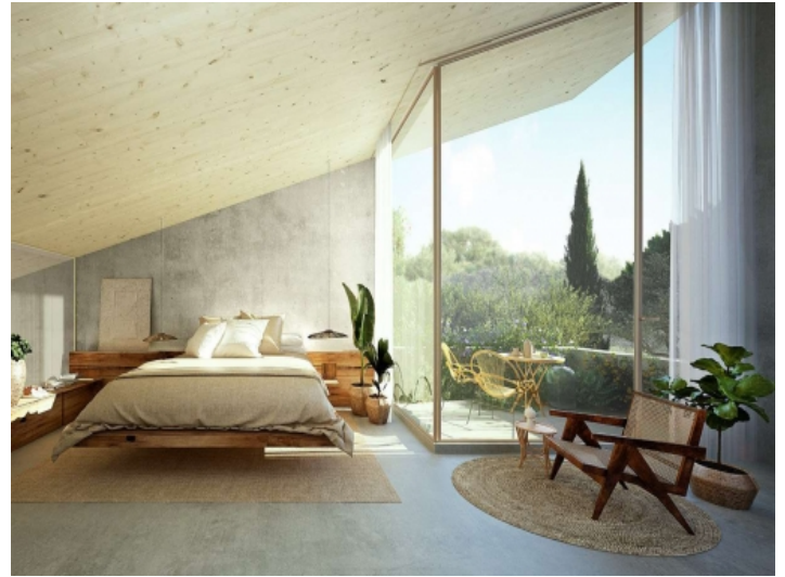
Großflächige Fensterfronten des Hauptschlafzimmers im