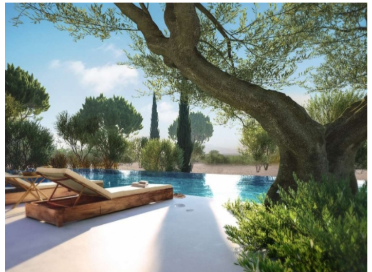
Oasenhaftes Ambiente, umgibt den Pool