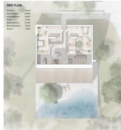
Grundriss des Obergeschosses