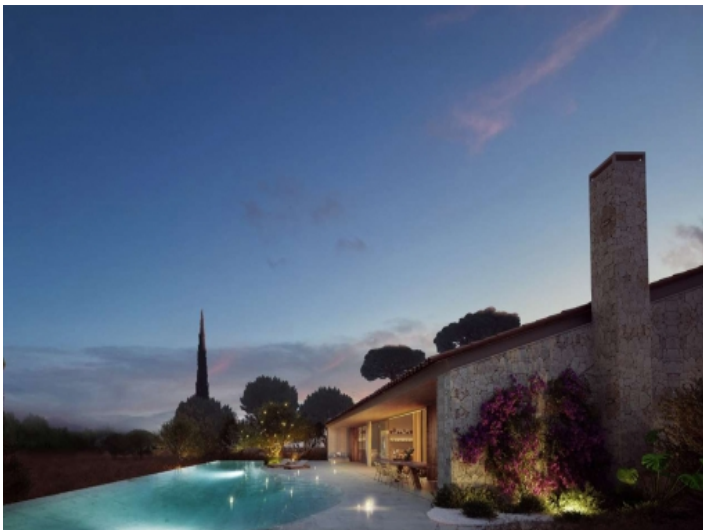
Ausgefeilte Beleuchtung bei Nacht