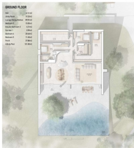
Grundriss des Erdgeschosses