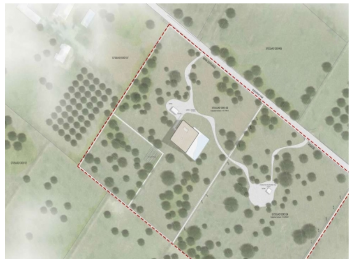
Verteilung der Gebäude auf dem Grundstück