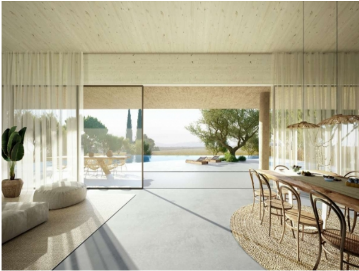
Modern minimalistische Architektur im Innenbereich