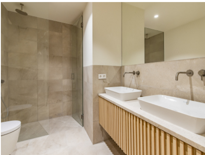
Eines von 2 modernen Badezimmern mit Dusche