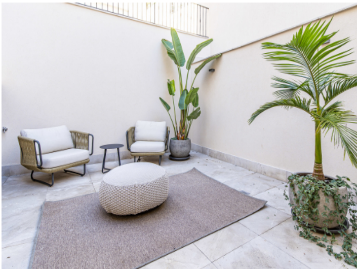
Privater Patio vom Hauptschlafzimmer