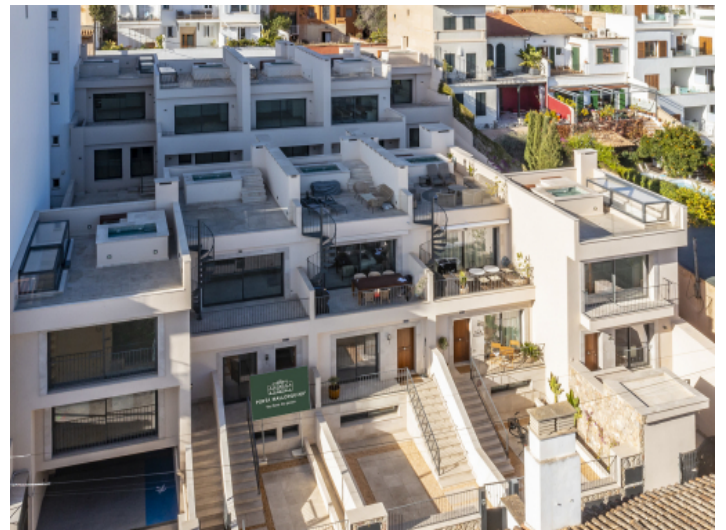
Ansicht des Reihenhauses