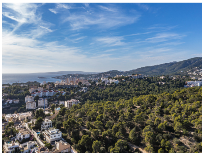
Der Wald von Schloss Bellver ist die grüne Lunge der Stadt