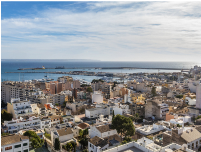
Das Terreno Viertel