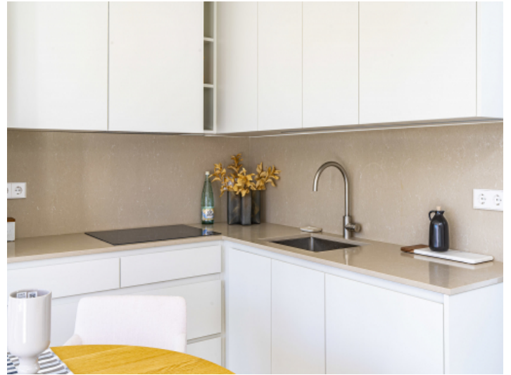
Moderne Küche mit viel Stauraum