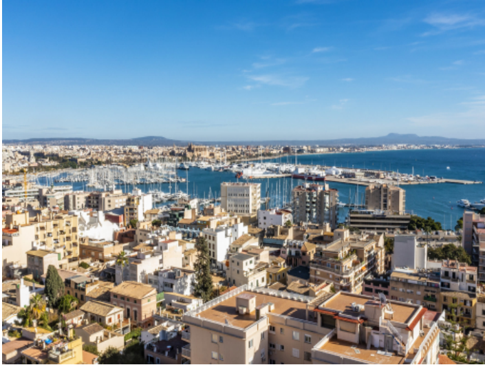
Stadt nah zu Palma und Hafen