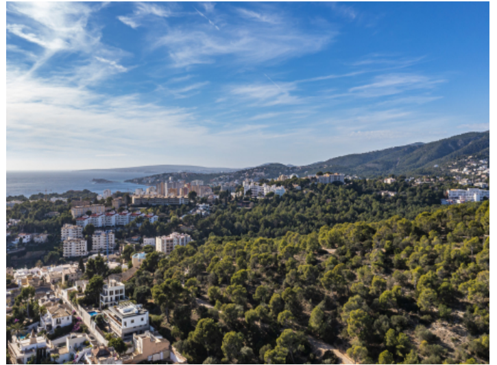
Der Wald von Schloss Bellver ist die grüne Lunge der Stadt