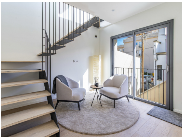
Eingangshalle und Zugang zu allen Etagen