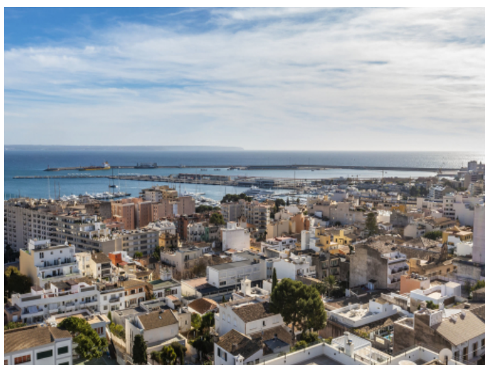
Das Terreno Viertel