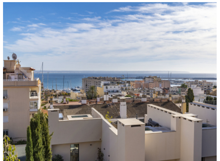
Fantastischer Blick über die Dächer bishin zum Meer