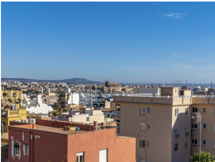
Blick über die anliegenden Häuser