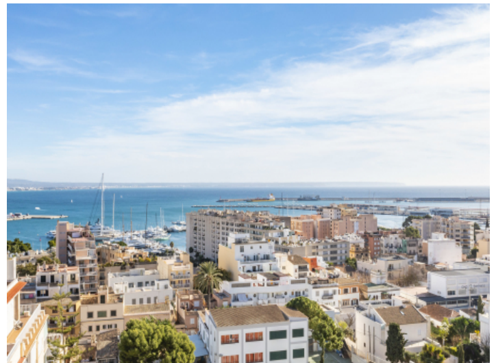
Das Terreno Viertel ist Stadt- und Hafennah