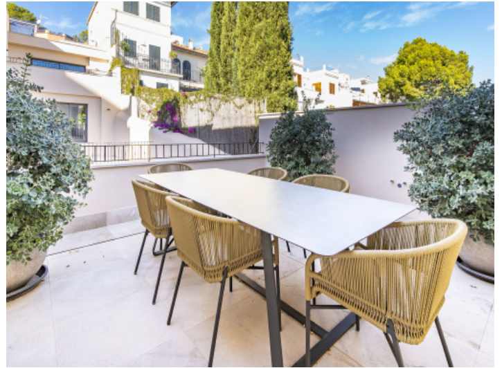
Eleganter Outdoor Essbereich