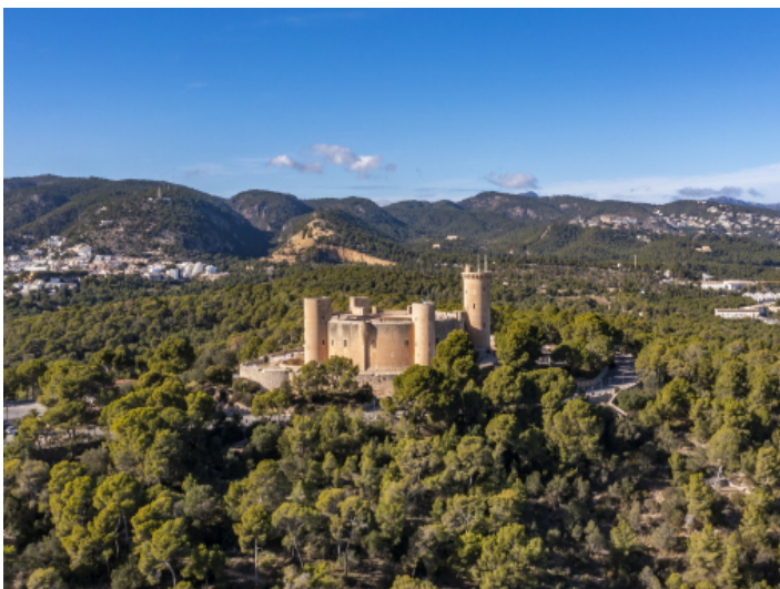
Schloss Bellver liegt in Fussnähe