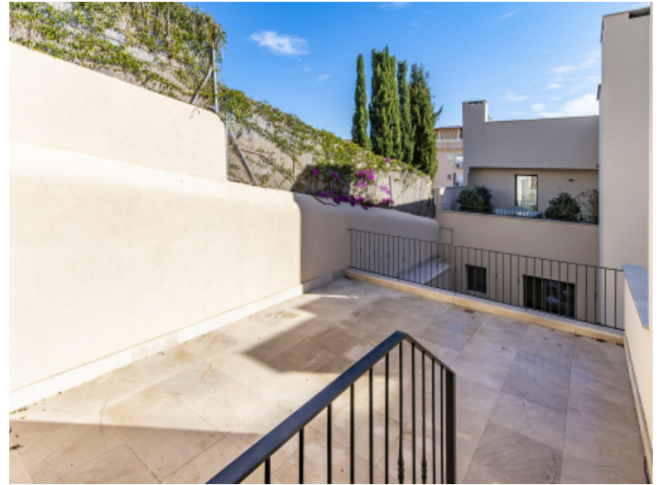
Eine weitere Terrasse