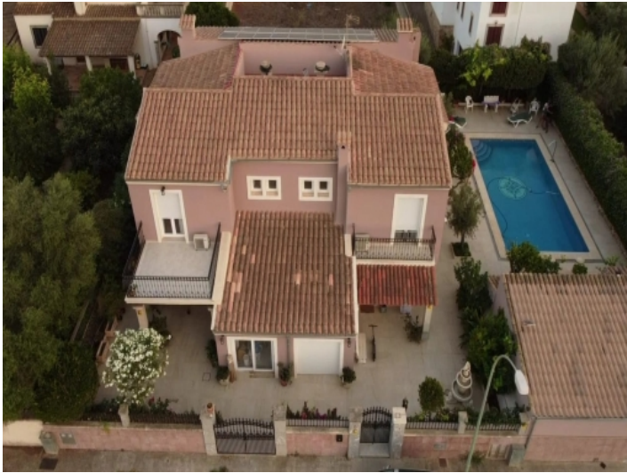
Außenansicht und Pool