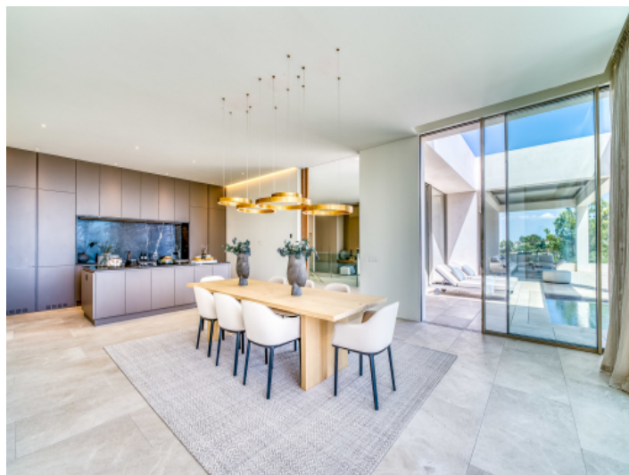
Essbereich mit offener Küche