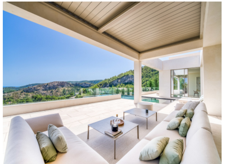
Überdachte Terrasse mit Sitzecke