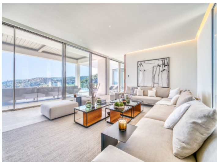
Helles Wohnzimmer mit Terrassenzugang