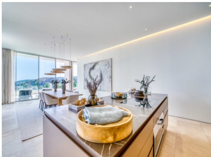
Kochinsel und Essbereich