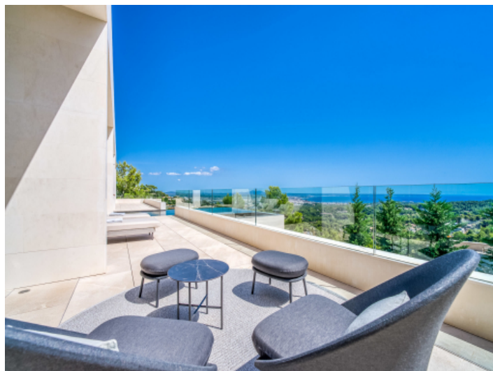
Geräumige Terrasse mit Aussicht