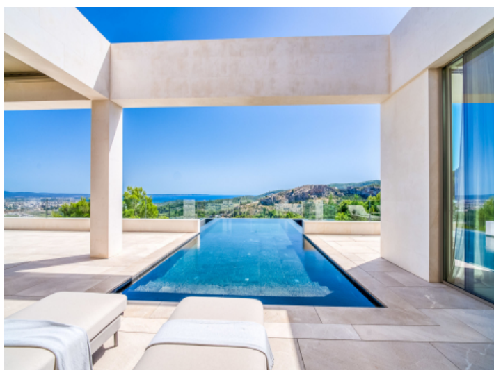
Überlaufpool mit tollem Ausblick