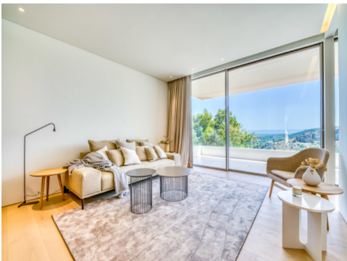
Gemütliche Sitzgelegenheit mit Terrassenzugang