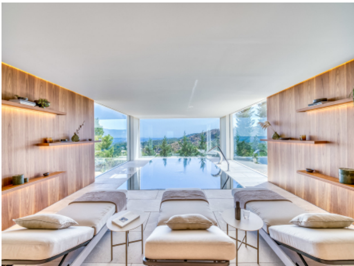
Einladender Spa-Bereich mit Innenpool