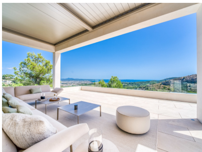
Geräumige überdachte Terrasse