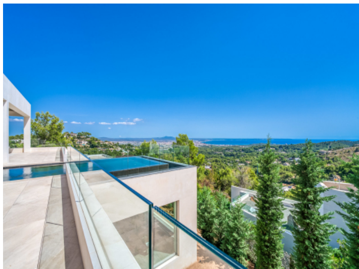
Meer- und Landschaftsblick