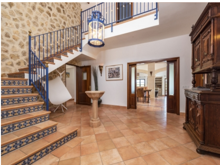
Eingangsbereich der Finca