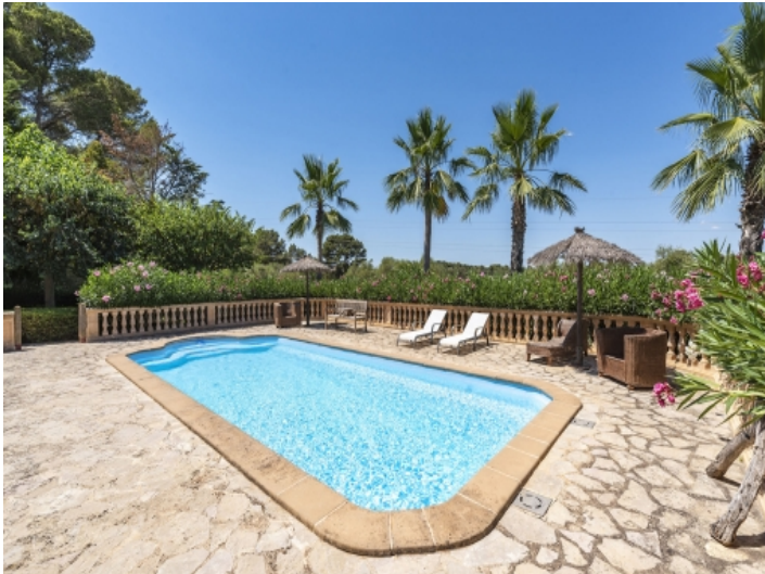
Sonniger Poolbereich der Finca