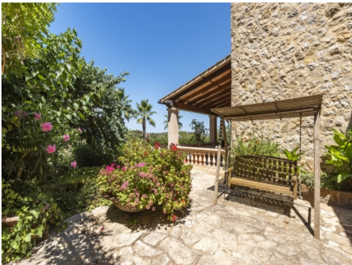
Charmante Sitzecke im Garten