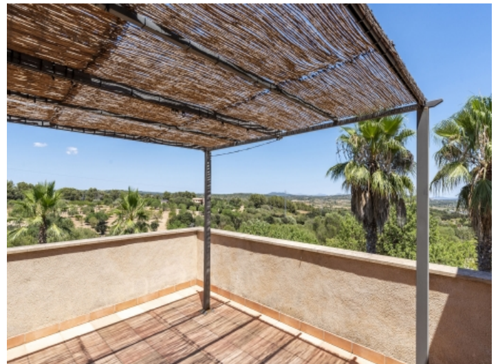
Balkon mit Weitblick