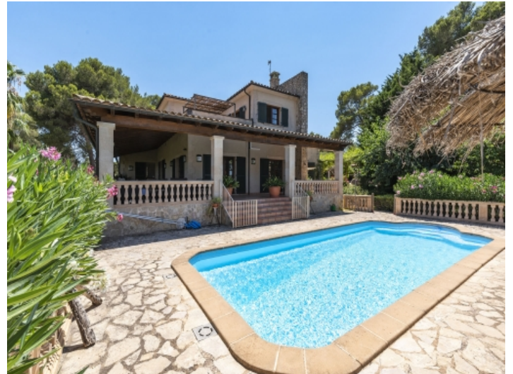
Außenansicht der Finca