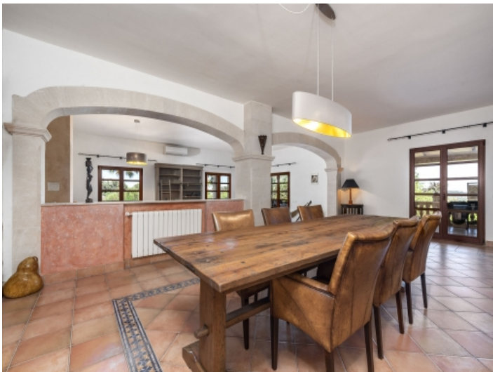
Ansicht des Essbereichs