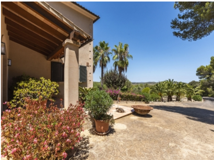
Auffahrt und Garten