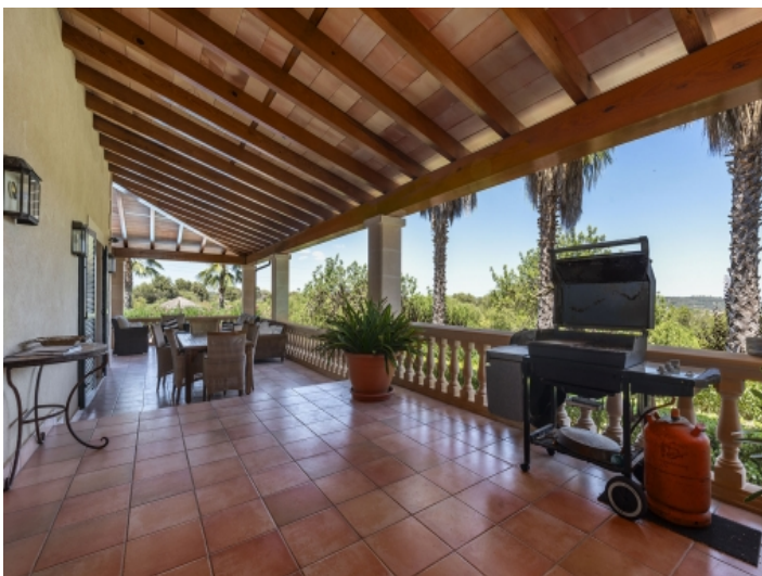
Überdachter Essbereich mit Grillecke