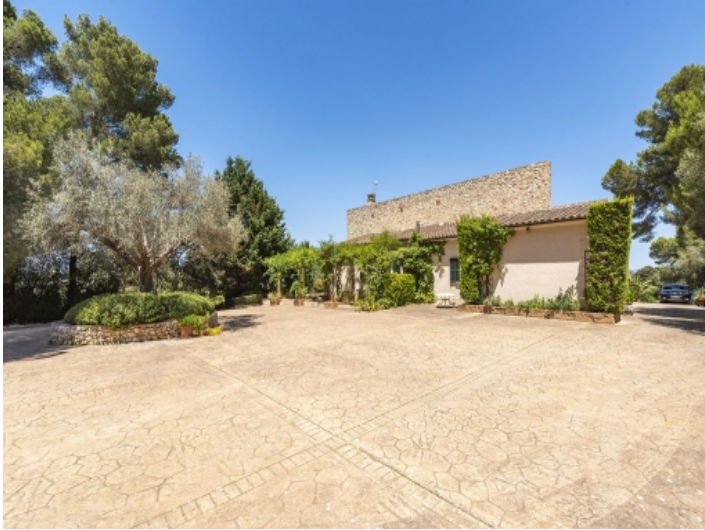
Auffahrt der Finca