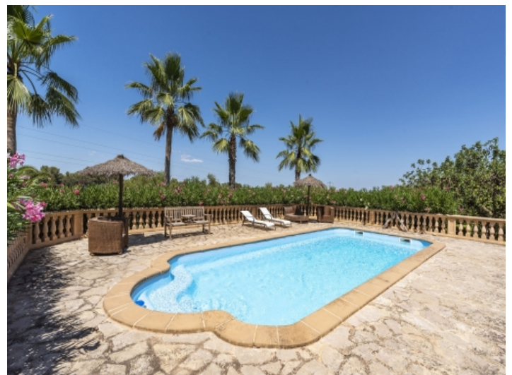
Alternative Ansicht des Pools