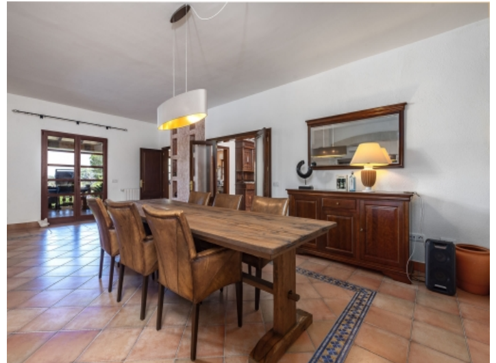
Ansicht des Essbereichs