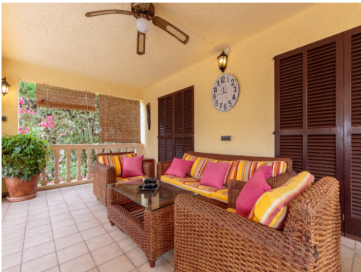
Terrasse mit komfortabler Sitzmöglichkeit