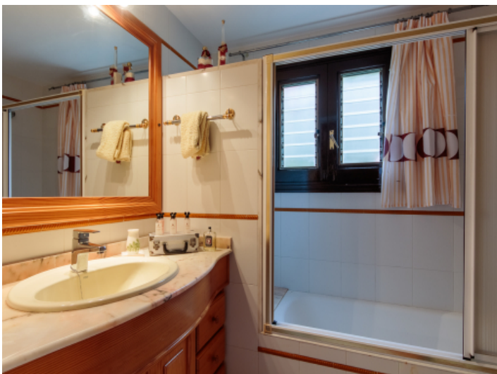
Badezimmer mit Badewann