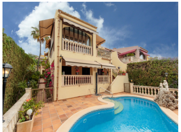
Fassade der Doppelhaushälfte