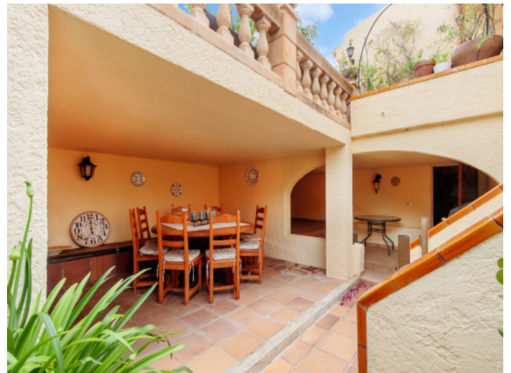
Essbereich im Freien