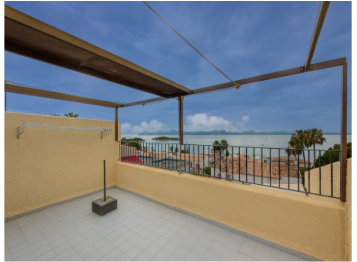
Dachterrasse mit Weitblick