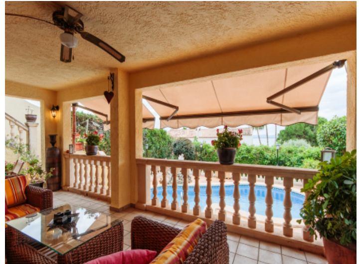
Überdachte Terrasse mit Blick über den Poolbereich