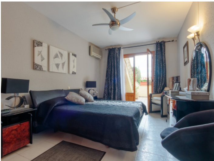
Doppelschlafzimmer mit Terrassenzugang