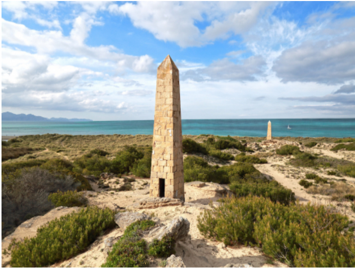
Umgebung der Immobilie