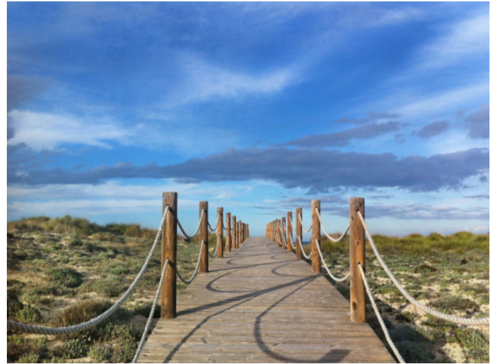
Beeindruckende Landschaft der Umgebung