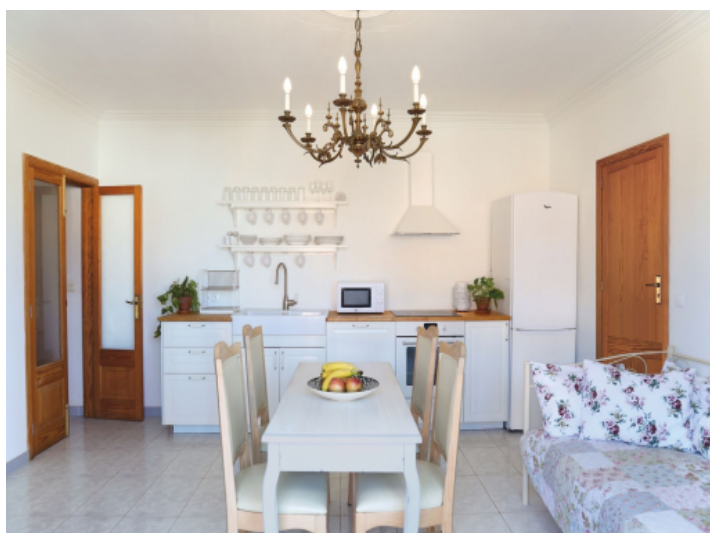
Wohn-/Essbereich mit integrierter Küche