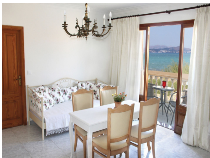
Wohn-/Essbereich mit Balkon und Meerblick