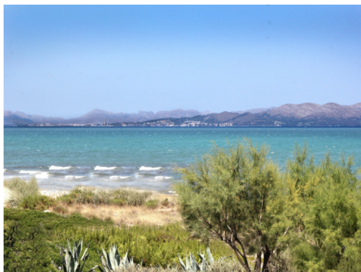
Toller Meerblick vom Balkon aus