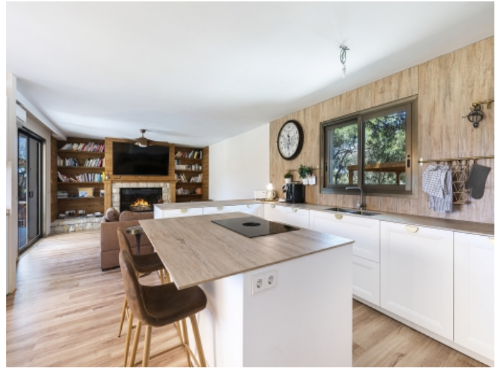
Offene, moderne Küche