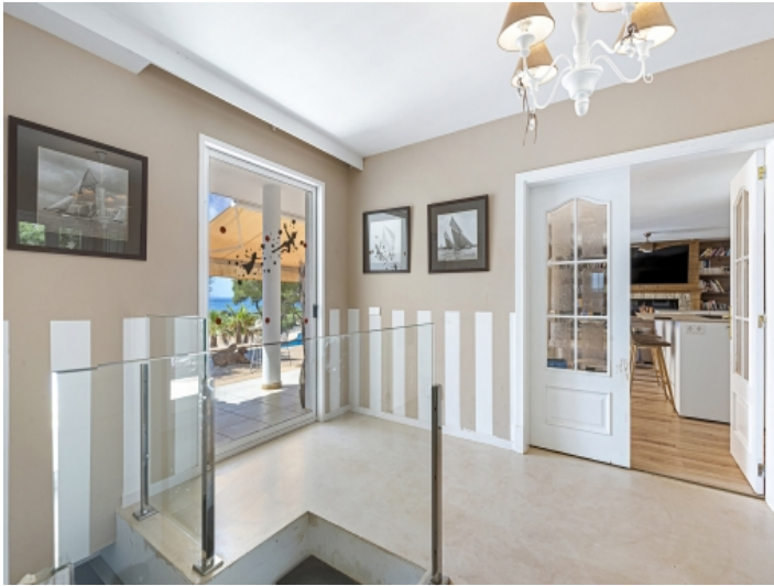
Zugang zum Außenbereich