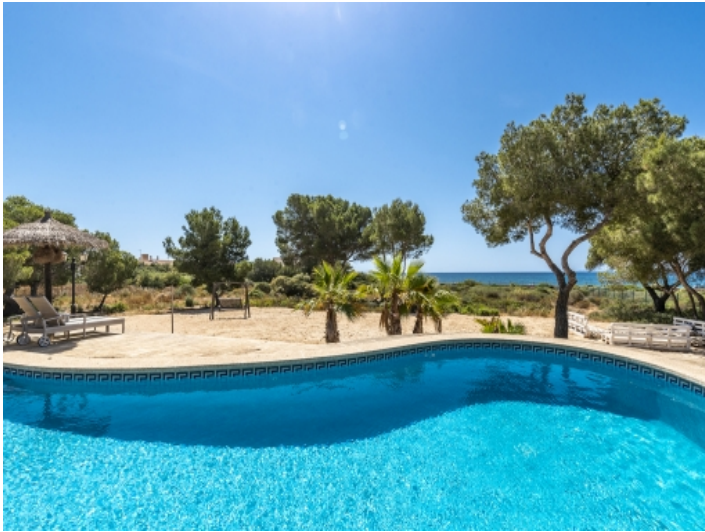
Pool in erster Linie