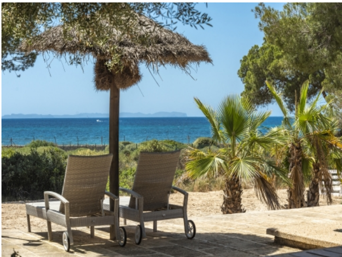
Sonnenterrasse in einzigartiger Lage