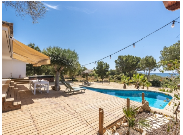
Wundervolle Poolterrasse mit Meerblick