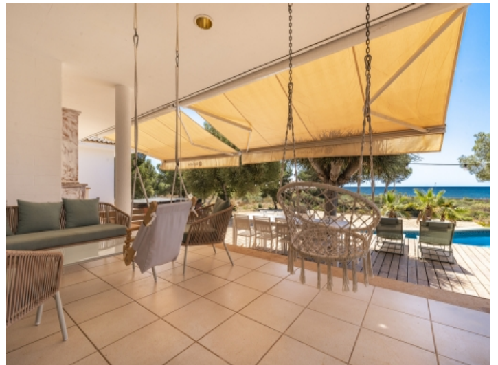
Entspannter, überdachter Loungebereich