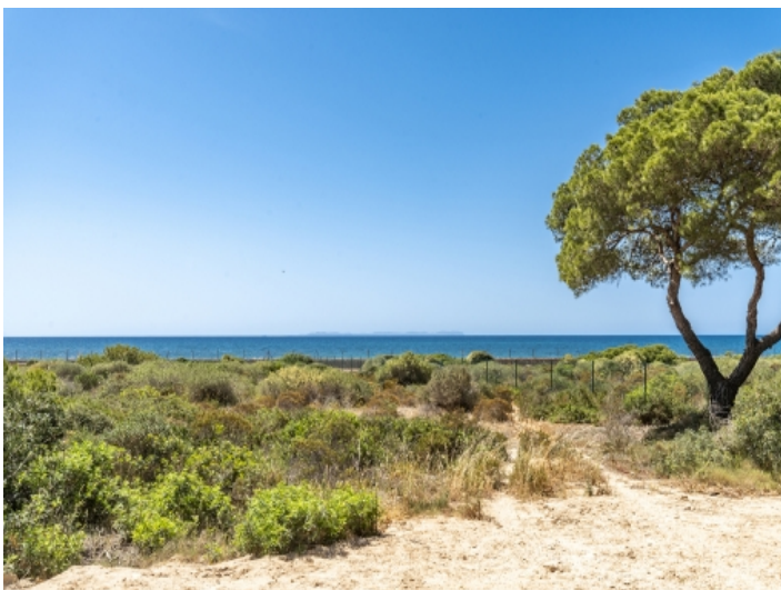
Laufdistanz zum Meer