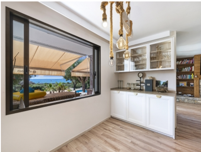
Traumhafter Meerblick aus der Küche