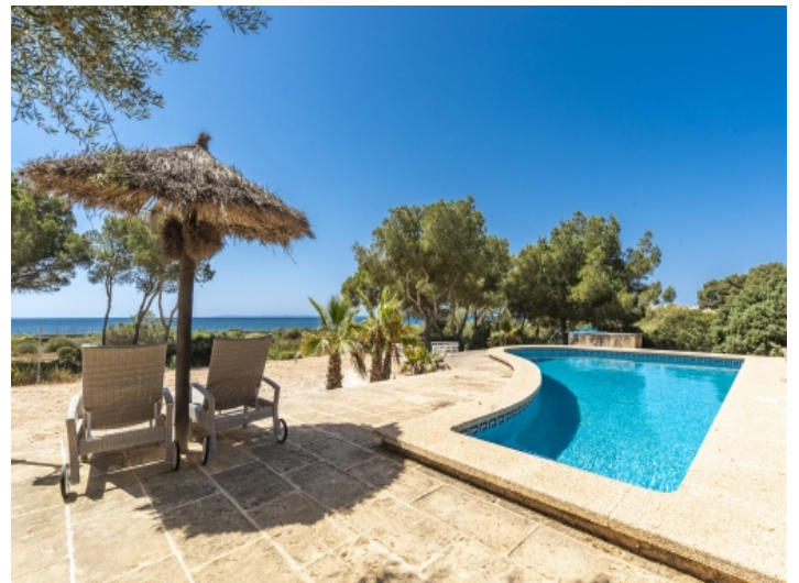
Poolbereich in absoluter Privatsphäre