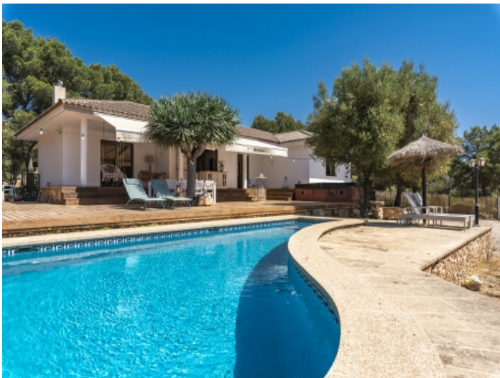
Sonniger Poolbereich und Finca