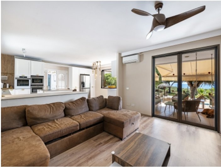
Großzügiger Wohnbereich mit Terrassenzugang