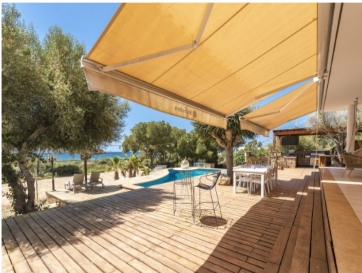
Große, offene Terrasse