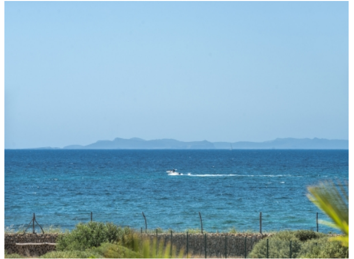
Atemberaubender Blick aufs Meer bis Cabrera