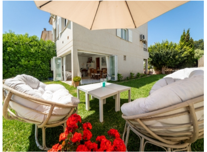
Entspannter Loungebereich im Garten