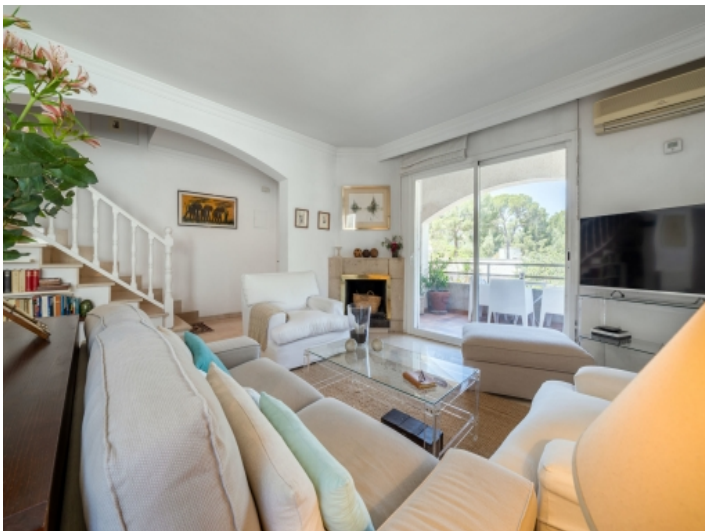
Haupt-Wohnbereich im ersten Stockwerk