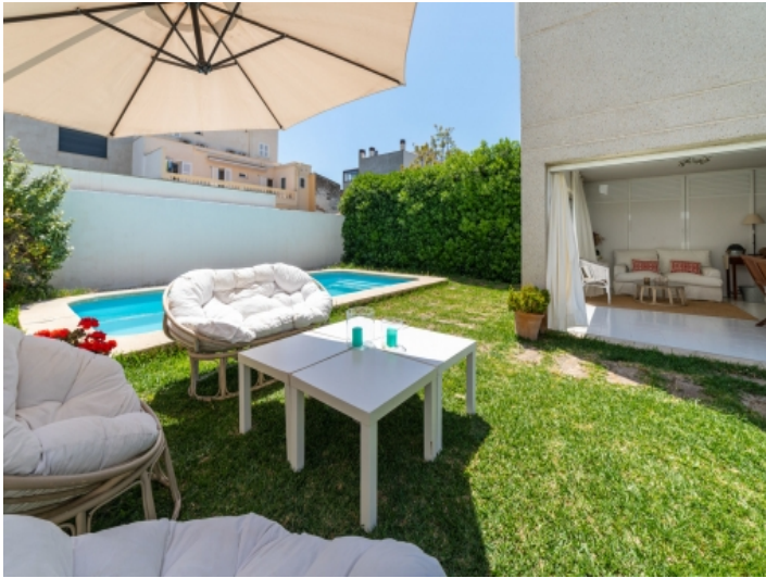
Schöner, privater Garten mit Pool