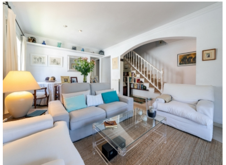
Schöner Wohn-und Essbereich