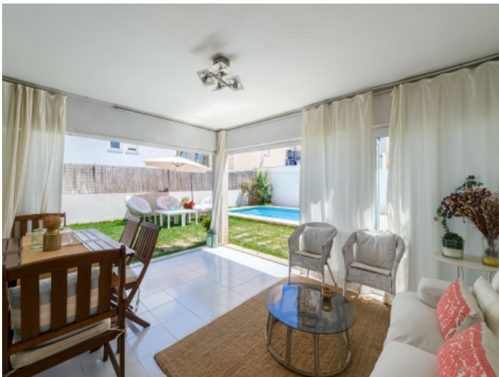
Erdgeschoss mit offenem Zugang zum Garten