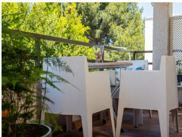
Balkon mit Sitzbereich