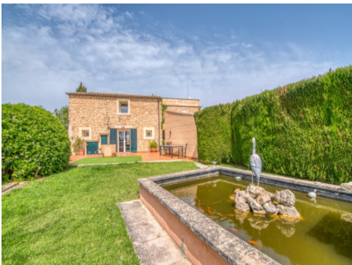
Blick auf die Eingangsseite des Hauses