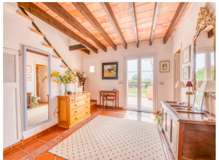
Eingangsbereich des Hauses