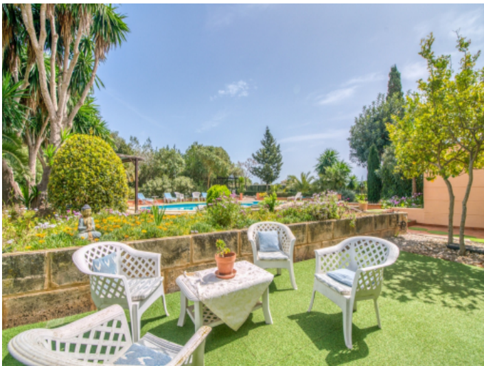
Sitzbereich auf der großzügigen Sonnenterrasse