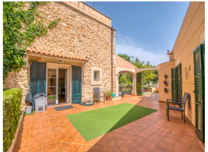
Haupthaus links und neben Gebäude rechts