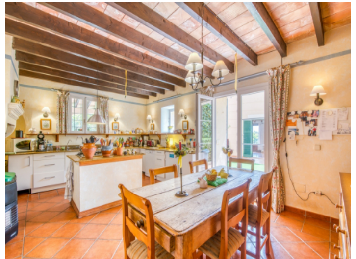
Charmante Küche mit Zugang in den Außenbereich