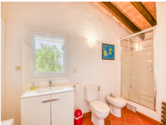
Zweites Badezimmer im Obergeschoss