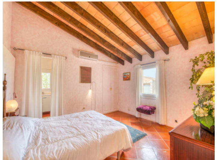
Zweites von vier Schlafzimmern im Obergeschoss