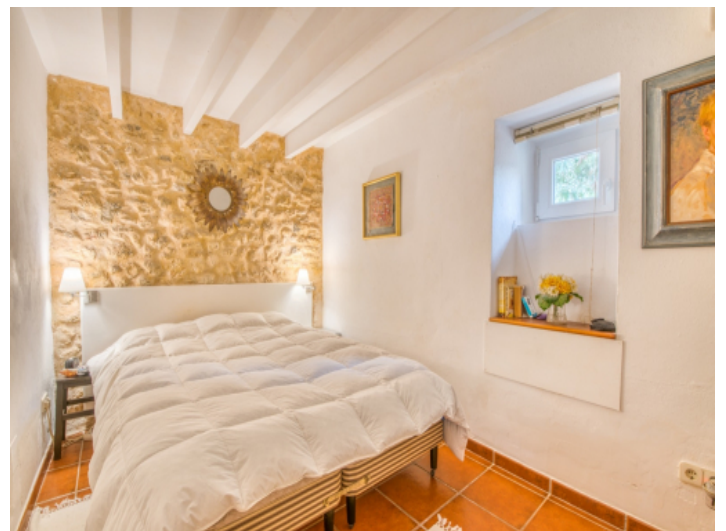
Schlafzimmer im Erdgeschoss