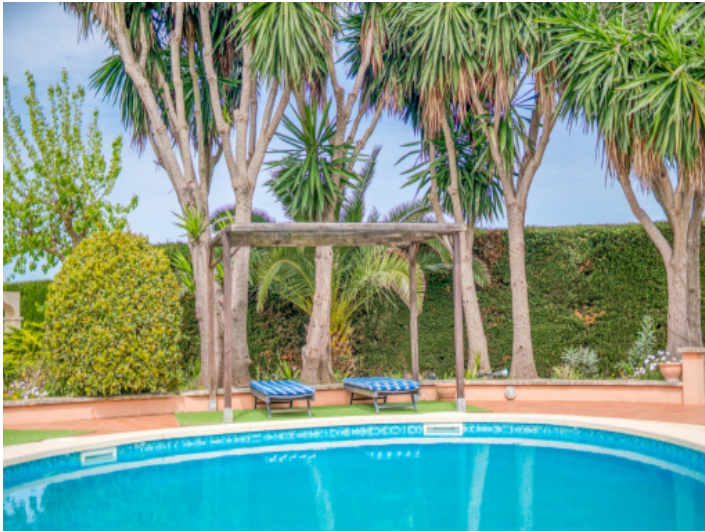
Liegeterrassen am Pool