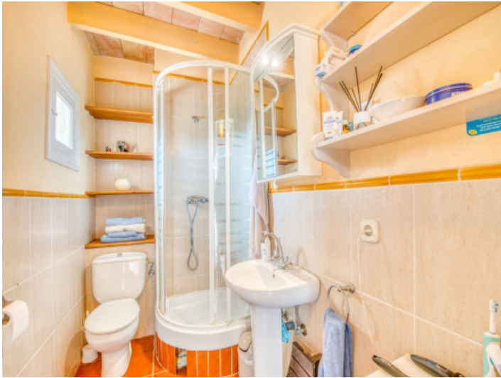
Badezimmer im Erdgeschoss