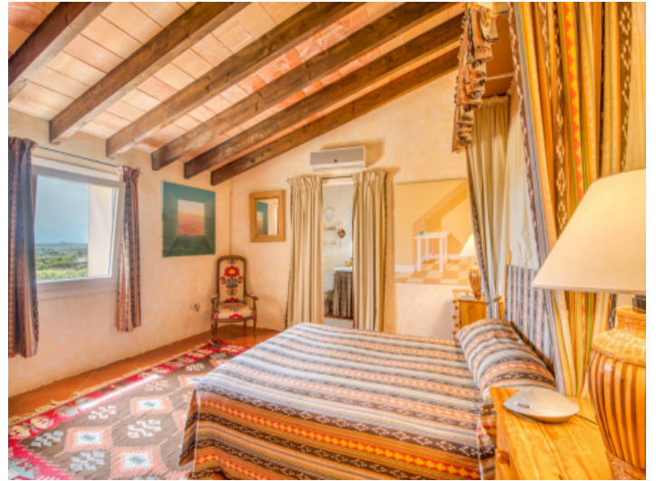
Eins von vier Schlafzimmern im Obergeschoss