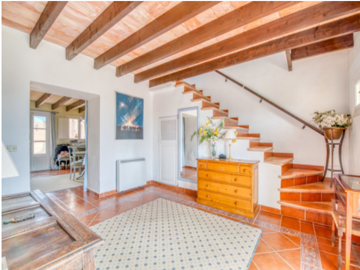
Treppenaufgang ins Obergeschoss vom Eingangsbereich