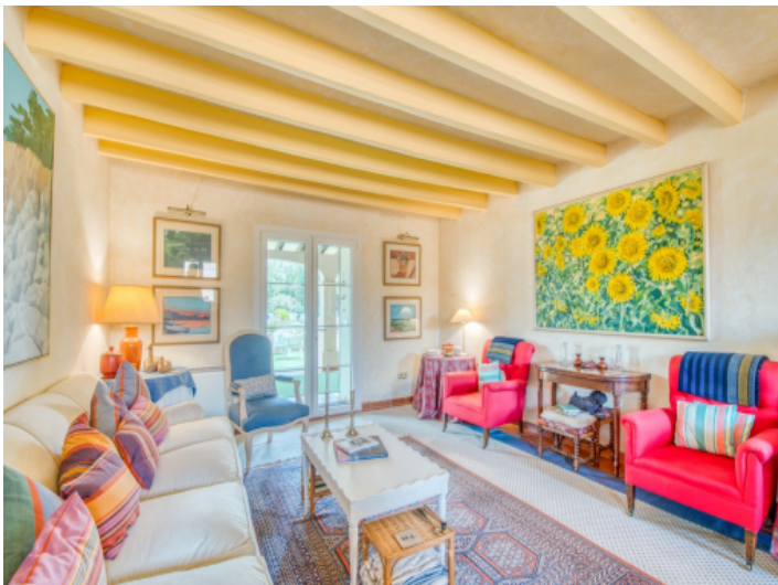
Wohnzimmer mit Zugang auf die überdachte Terrasse