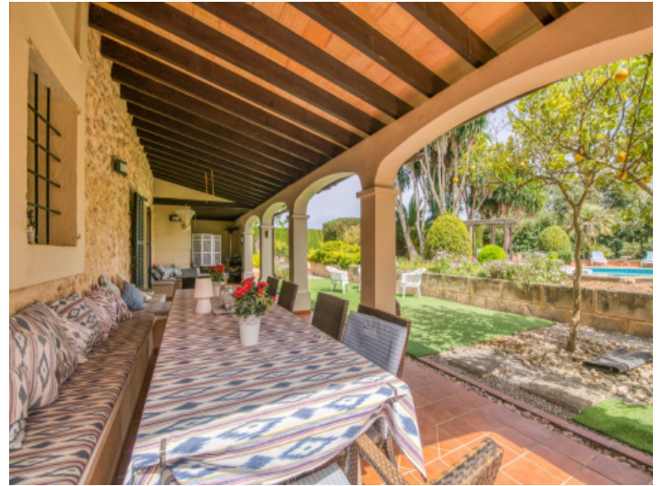
Überdachte Terrasse mit Gartenzugang