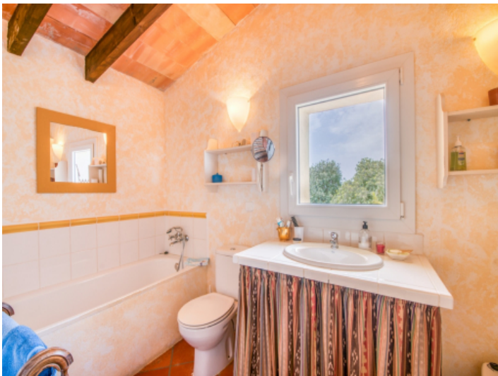
En Suite Badezimmer