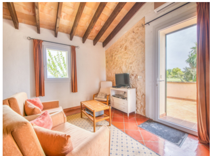
Tagesraum im Hauptschlafzimmer des Obergeschosses