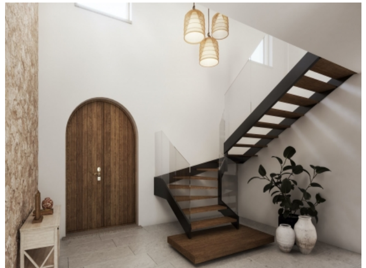
Nobler Eingangsbereich mit Natrusteinwand