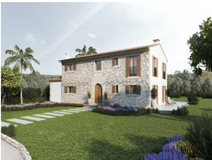
Außenansicht der Finca