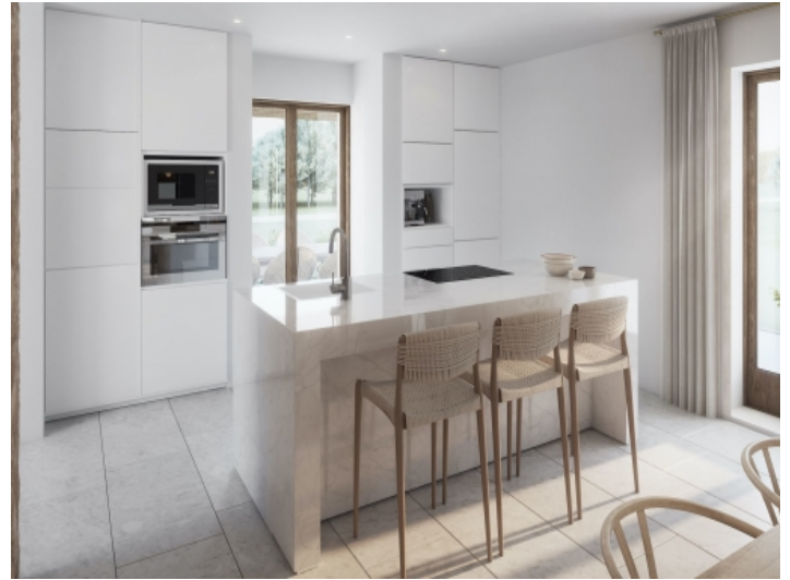
Voll ausgestattete Küche mit Kochinsel