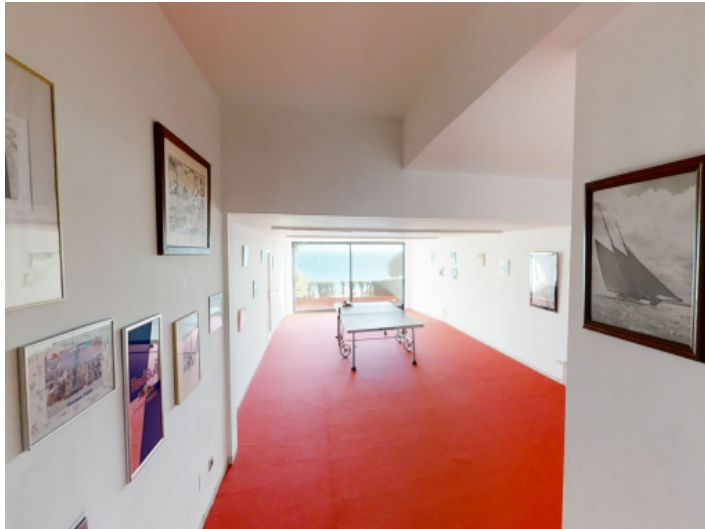
Garage, die derzeit als Hobbyraum genutzt wird