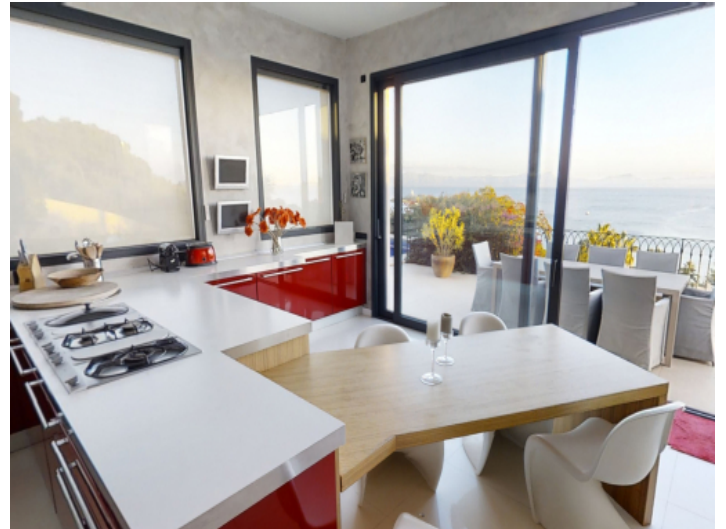
Küche mit Frühstücksbereich