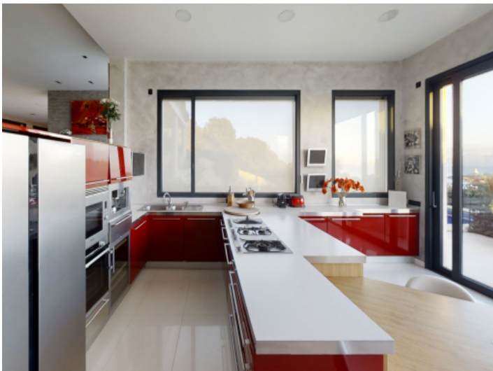
Voll ausgestattete Küche