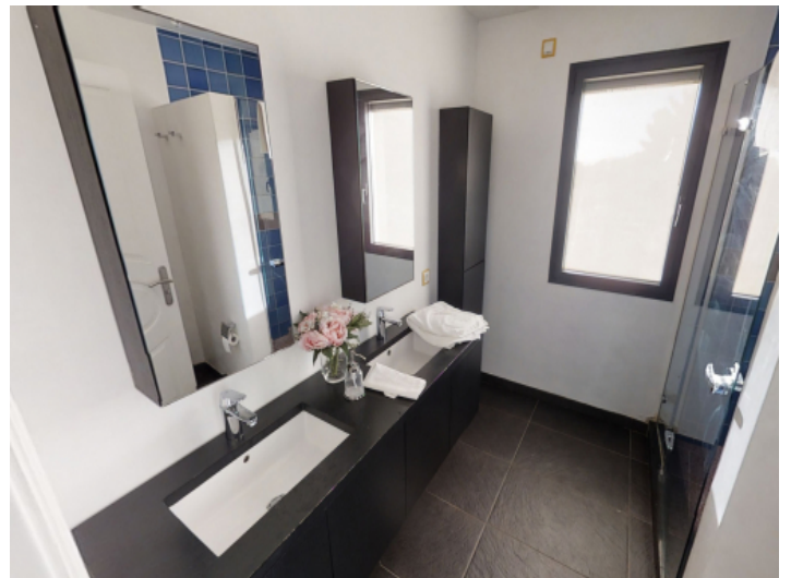
Separates Badezimmer im Obergeschoss