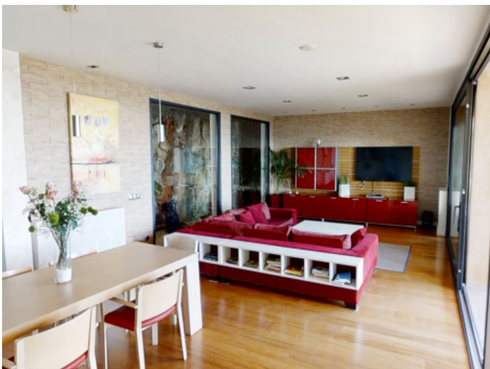
Blick in den Ess- und Wohnbereich