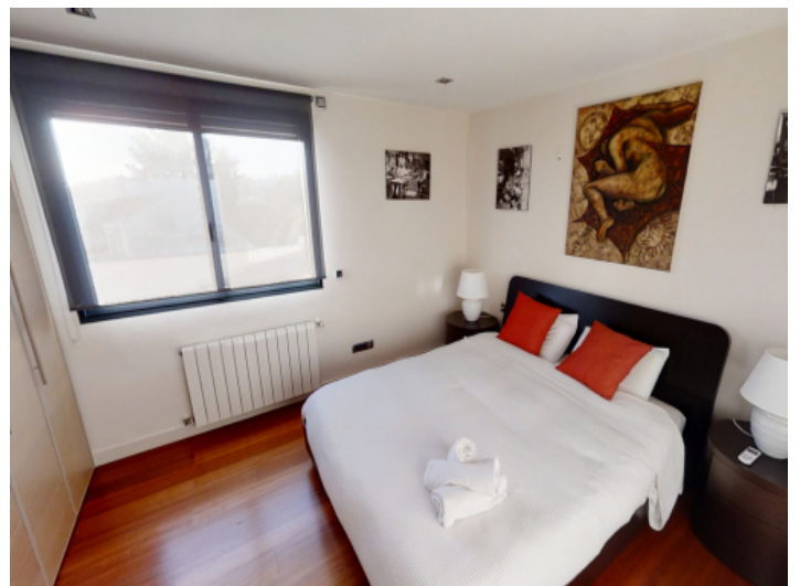
drittes Doppelschlafzimmer im Obergeschoss