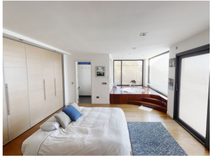
Hauptschlafzimmer mit eigenem Badezimmer