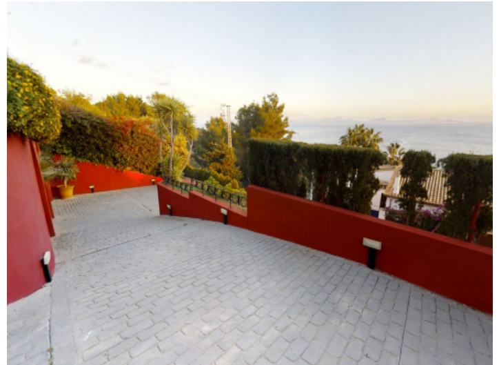
Auffahrt und Parkplatz