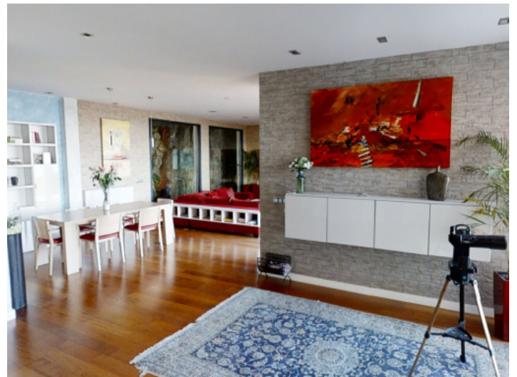
Großzügiger Flurbereich mit Platz für eine Lounge-Ecke