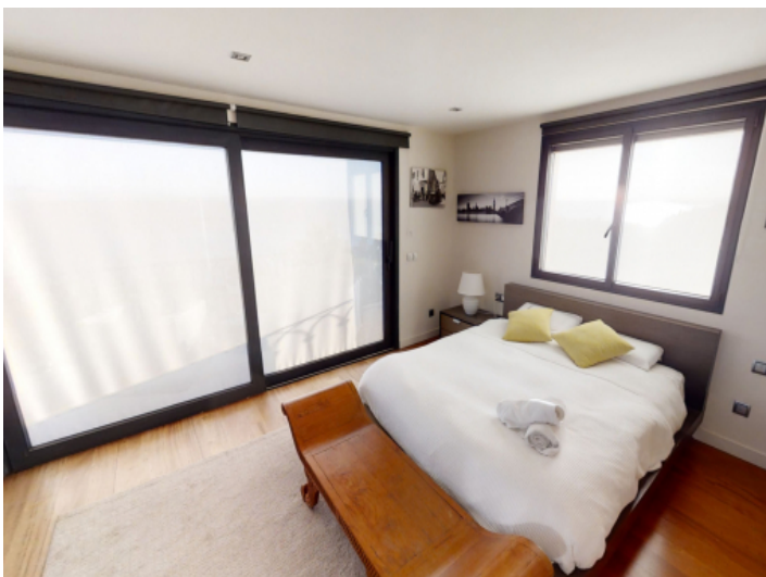
Zweites Doppelschlafzimmer im Obergeschoss