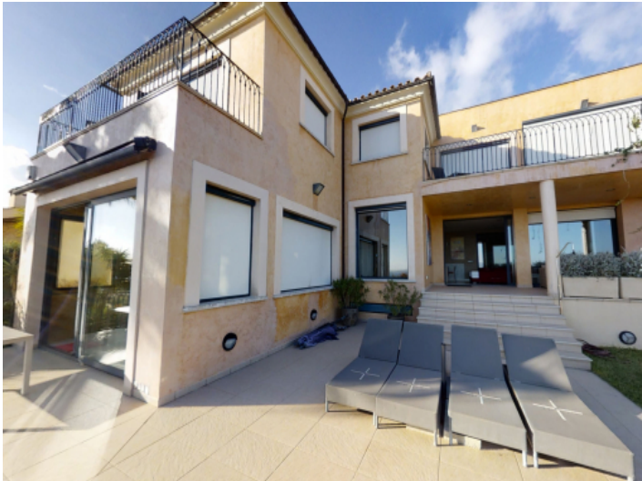
Ansicht der Fassade der Villa