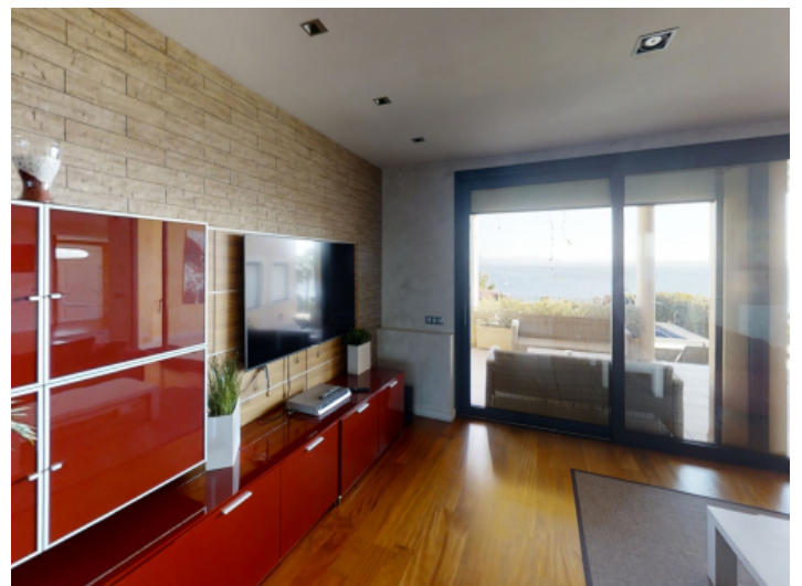
Wohnzimmer mit Zugang auf die Terrasse