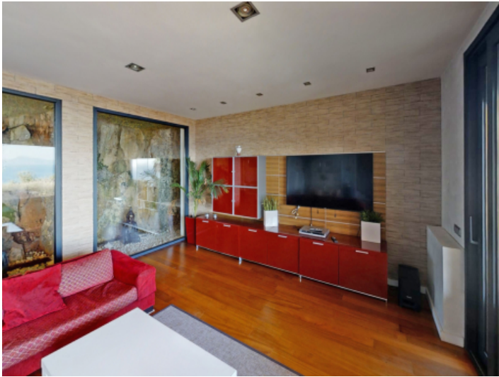
Verglaste Felswand Wohnzimmers