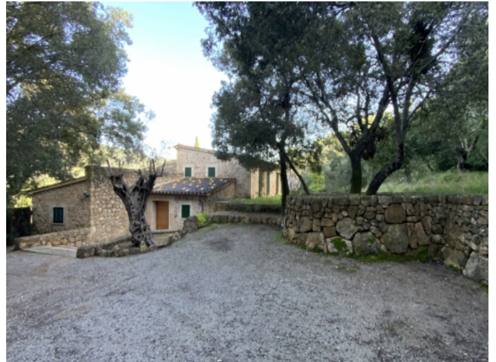
Ruhige und private Lage