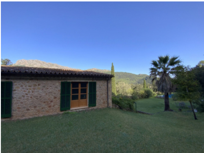
Typisch mallorquinische Finca