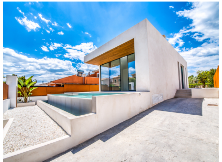
Zugang zum Anwesen