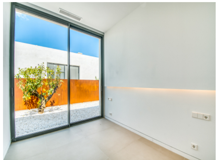
Helles Schlafzimmer mit Zugang nach Außen