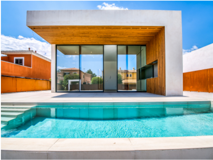
Moderner Pool mit Terrassenbereich