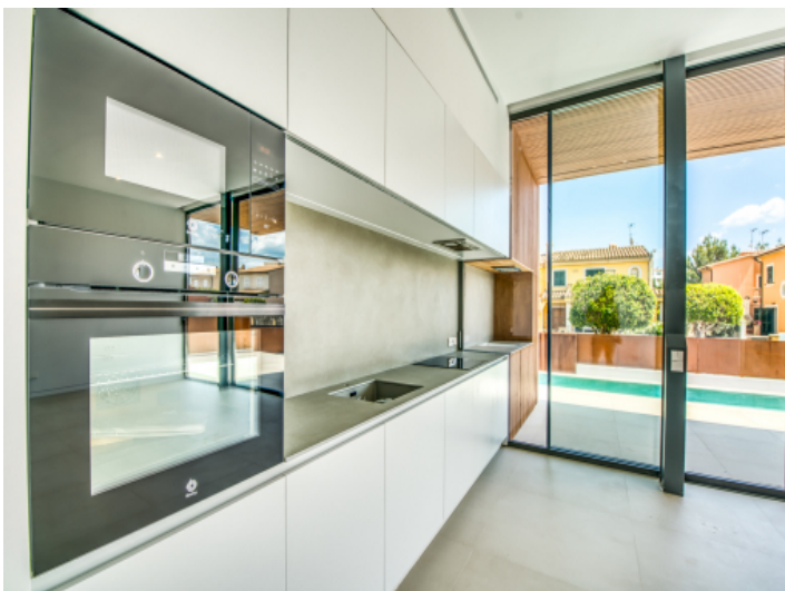
Moderne, offene Küche