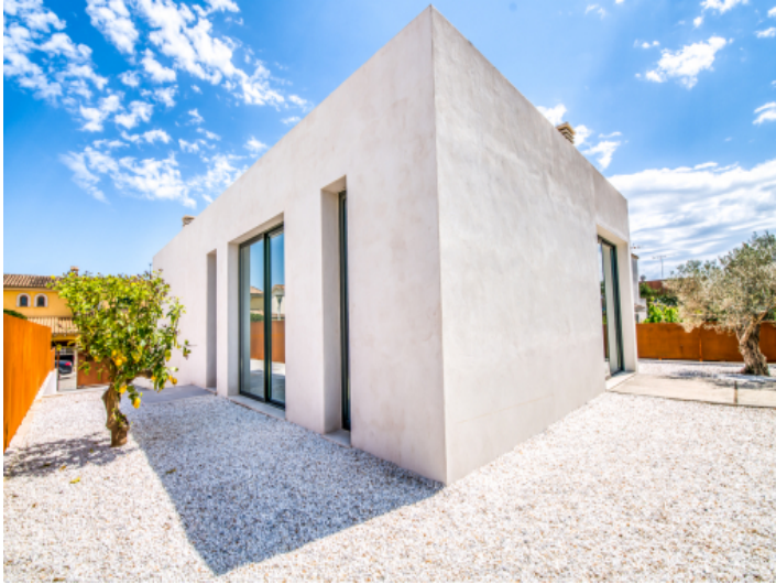
Rückansicht und Außenbereich