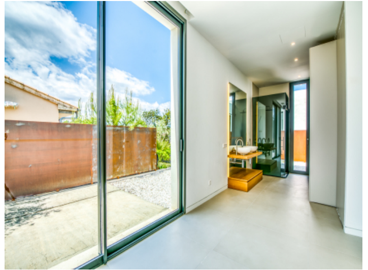
Schlafzimmer mit offenen Badezimmer