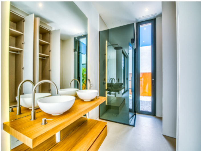
Modernes Badezimmer en Suite