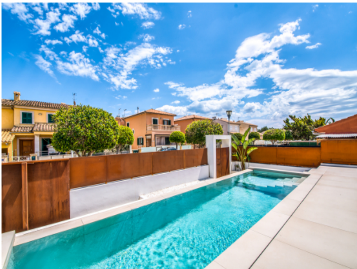
Eleganter, sonniger Poolbereich