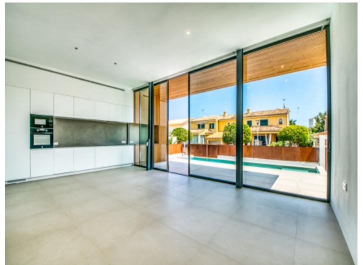
Wohnbereich mit Panoramafenstern