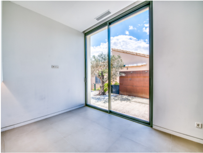
Eines von 3 Schlafzimmer