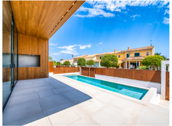
Elegante Terrasse mit Poolblick