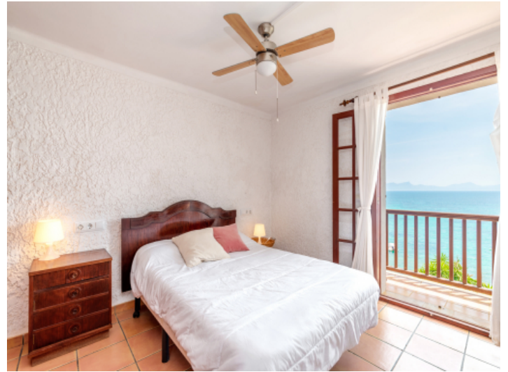
Schlafzimmer mit kleiner Terrasse