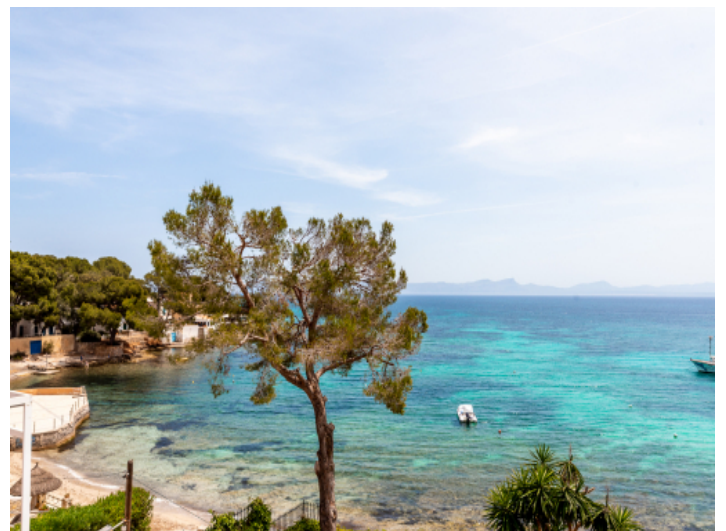
Blick auf den Strand und das Meer