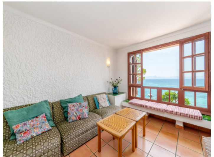
Wohnbereich mit Meerblick