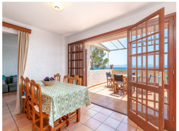
Essbereich mit Terrassenzugang