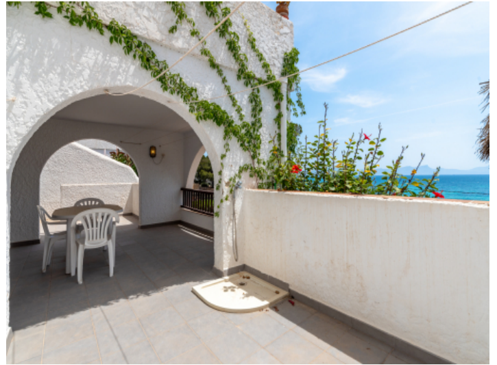
Separate Terrasse mit überdachtem Essbereich