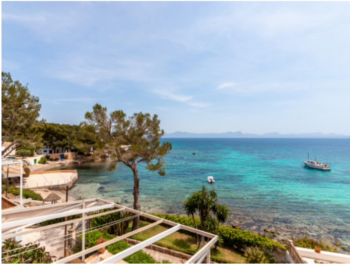
In erster Meereslinie gelegen