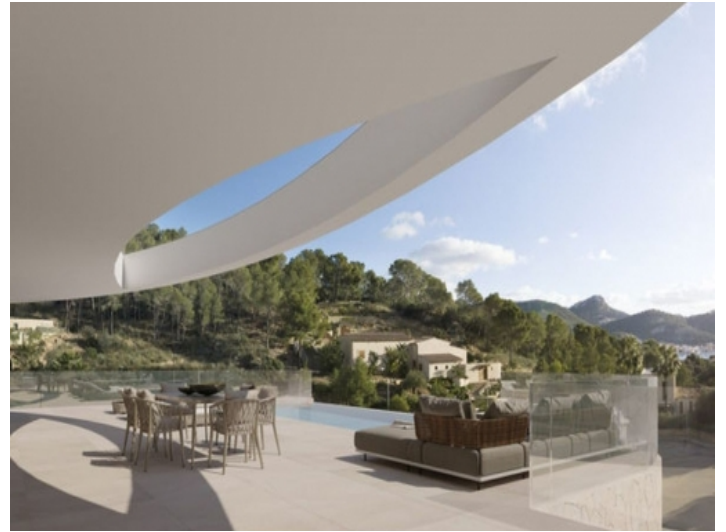
Sonnige, große Terrasse der Villa