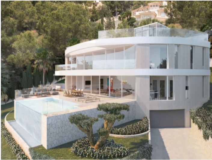
Außenansicht der Neubauvilla