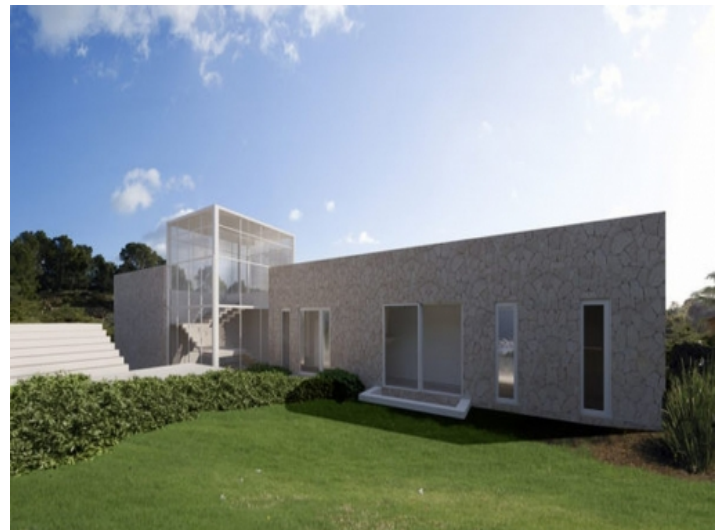
Außenansicht der luxuriösen Villa