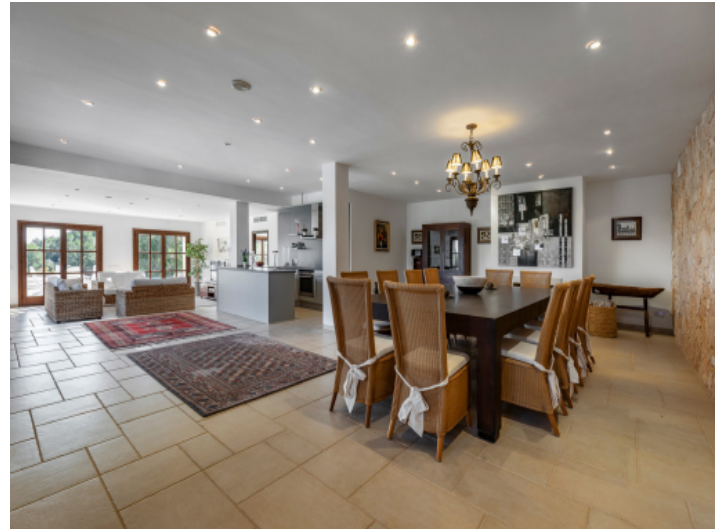
Großer Essbereich im Wohnbereich