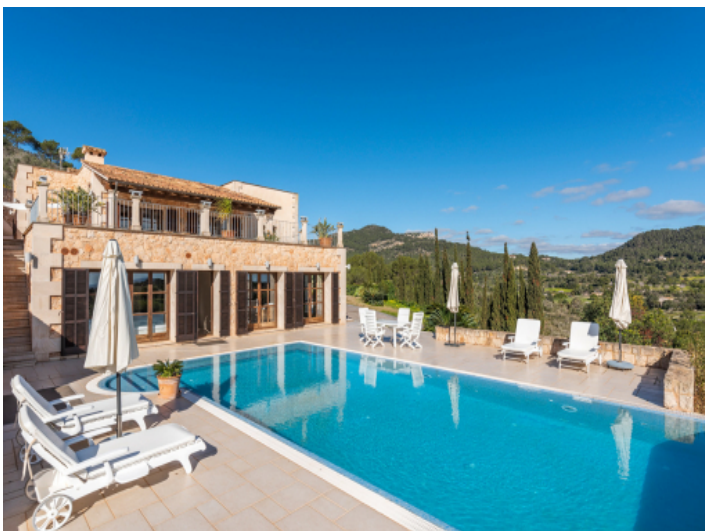
Poolbereich umgeben von einer herrlichen Landschaft