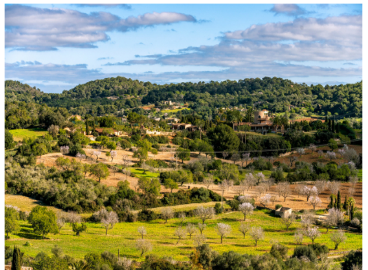
Blick auf die hügelige Landschaft