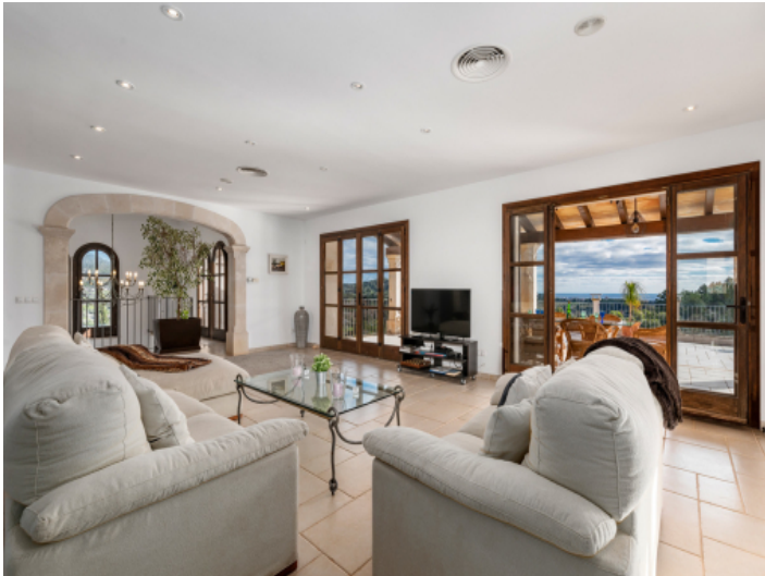
Großzügiger Wohnbereich im Obergeschoss