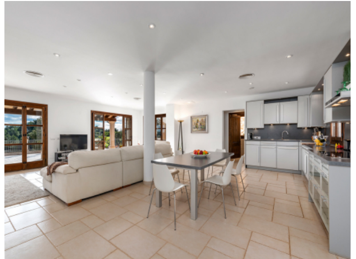
Offener Küchen- und Essbereich