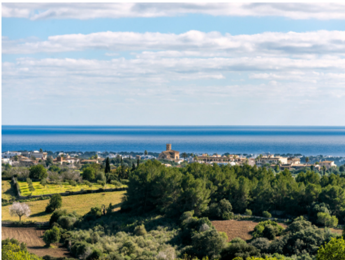
Beeindruckender Blick bis zum Meer