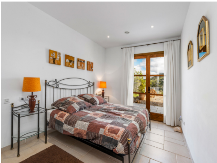
Doppelschlafzimmer im Erdgeschoss