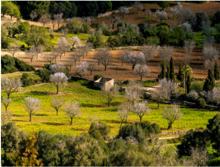
Finca umgeben von Natur