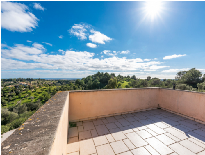
Sonnige Dachterrasse mit Ausblick