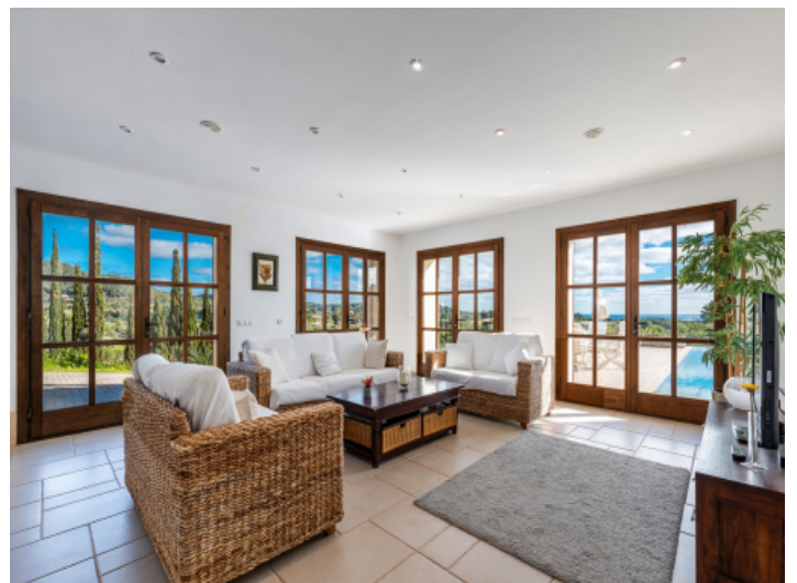
Wohnbereich mit direkten Zugang zur Poolterrasse