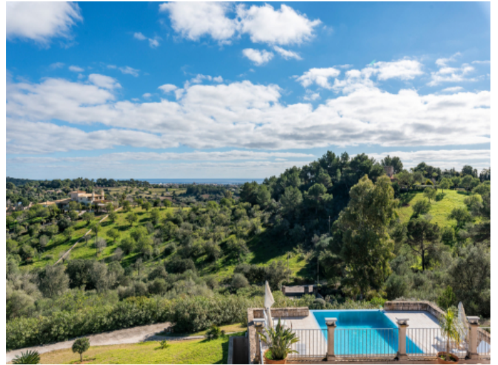
Bezaubernder Panoramablick über die Landschaft