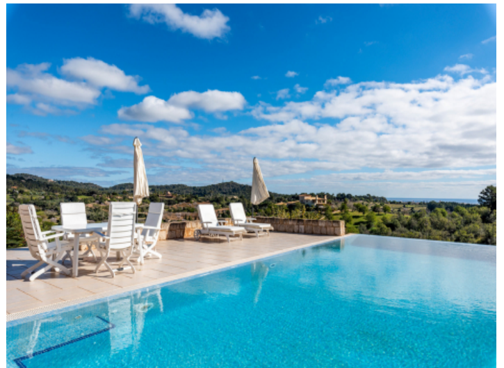
Infinitypool mit Blick bis zum Meer