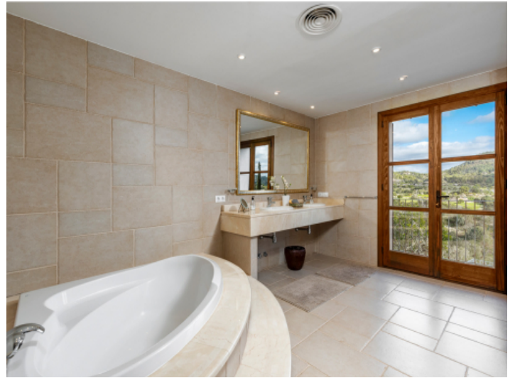
En Suite Badezimmer mit Wanne und Ausblick