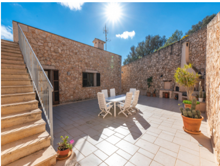
Mallorquinischer Patio mit Grillbereich