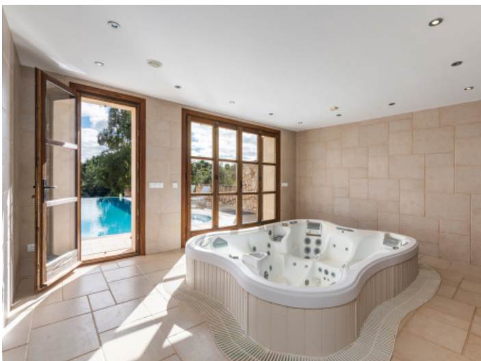
Raum mit Jacuzzi und Zugang zur Poolterrasse