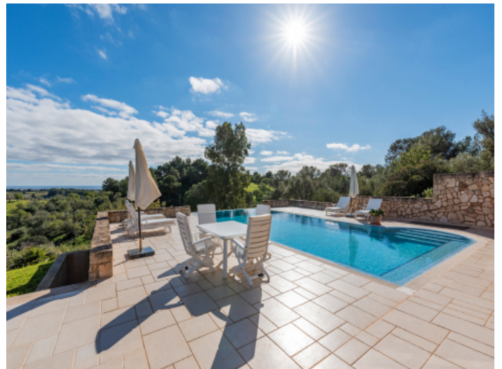
Poolbereich in absoluter Privatsphäre