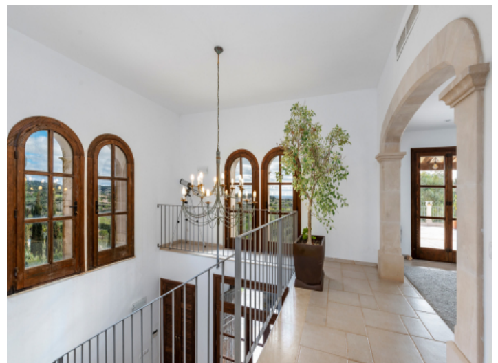
Eleganter Treppenaufgang ins Obergeschoss