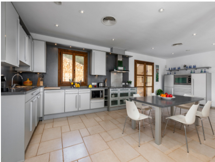
Große Küche mit Zugang zum Patio