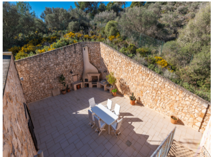
Blick in den Innenpatio