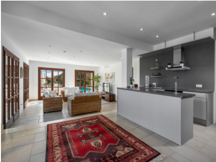
Offene, moderne Küche