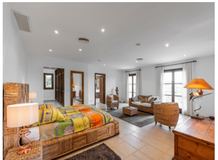
Master Schlafzimmer Suite im Obergeschoss