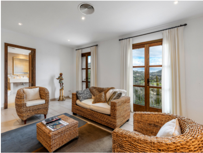
Master Suite mit Loungebereich