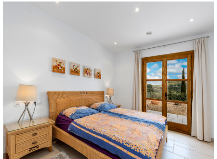
Weiteres Schlafzimmer im Erdgeschoss