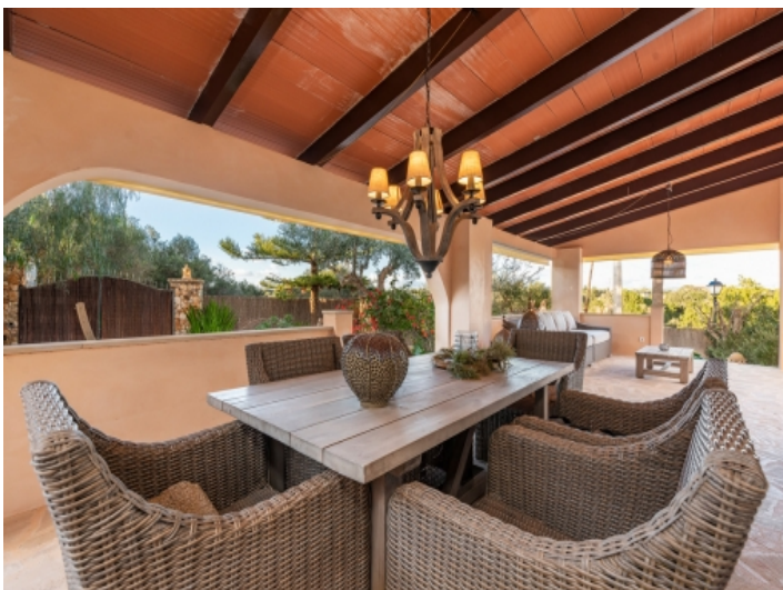
Schön gebaute Terrasse mit Essbereich