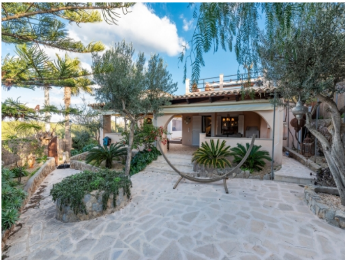
Blick auf das charmante Haupthaus