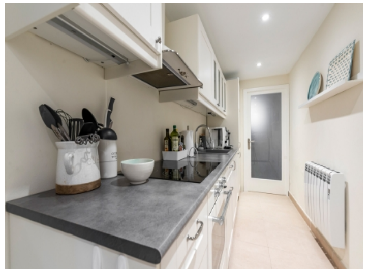
Separate, moderne Küche in weiss