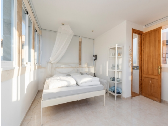
Gäste-Schlafzimmer mit Badezimmer