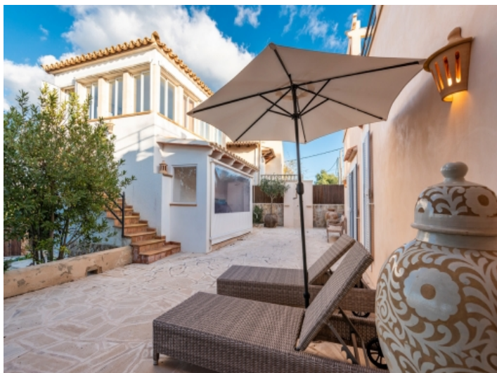
Patio und Blick zum Gästehaus