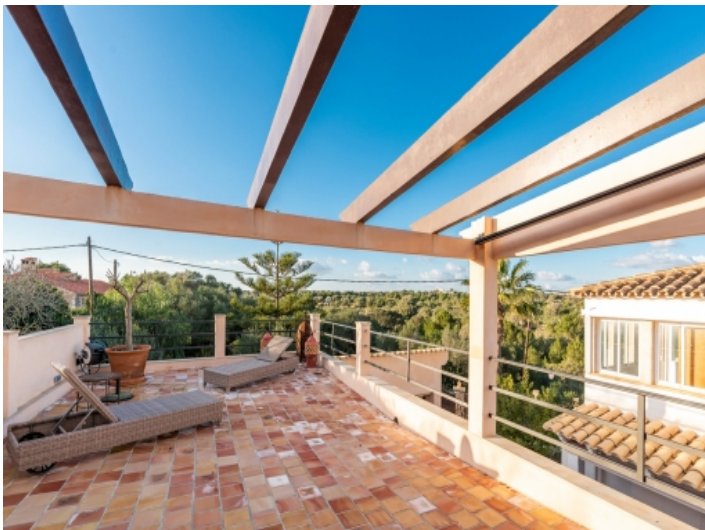
Große Dachterrasse mit herrlichen Ausblick