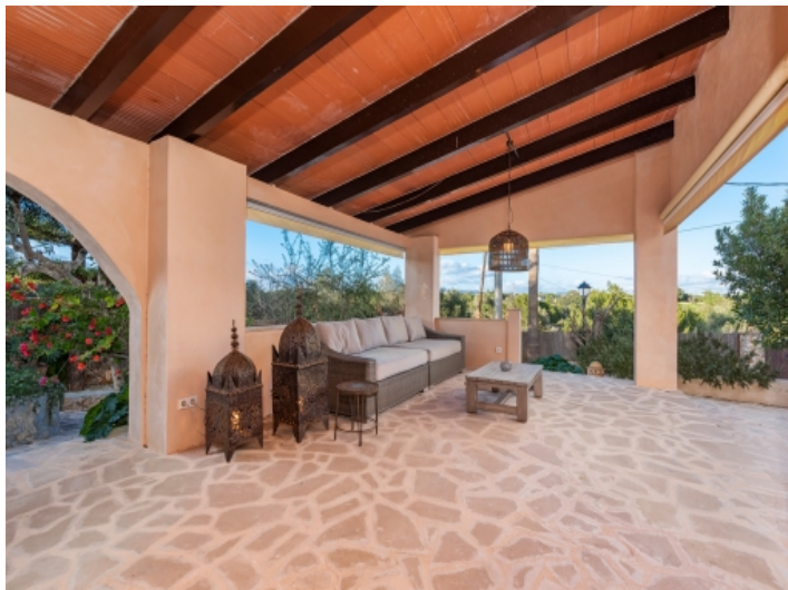
Große, überdachte Loungeterrasse