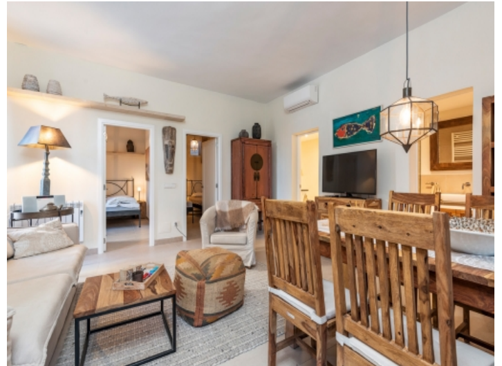
Geschmackvoll eingerichteter Wohn- und Essbereich