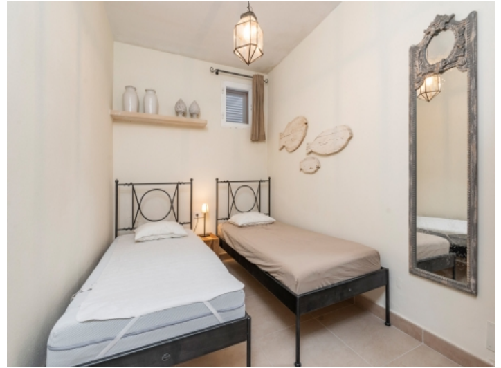
Zweites Schlafzimmer im Haupthaus