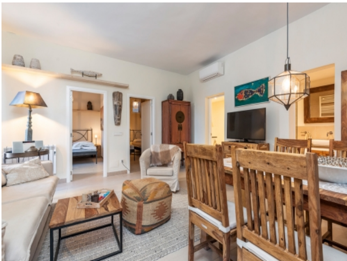
Geschmackvoll eingerichteter Wohn- und Essbereich