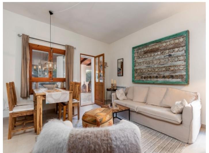
Zuang zum gemütlichen Wohn- und Essbereich