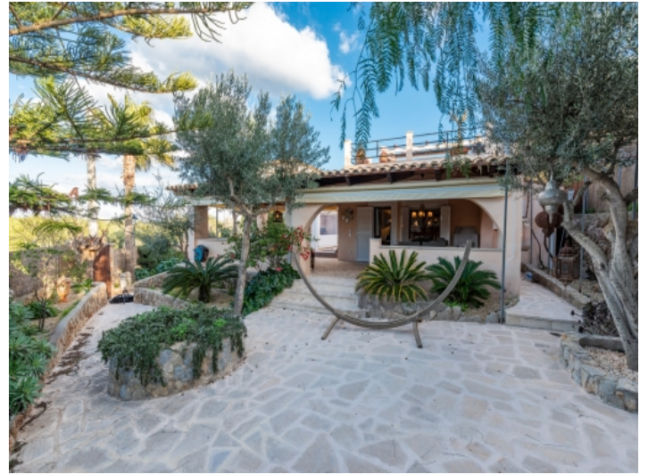
Blick auf das charmante Haupthaus