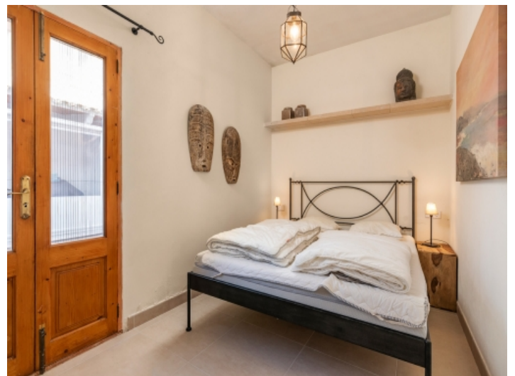
Doppelschlafzimmer mit Zugang nach Außen