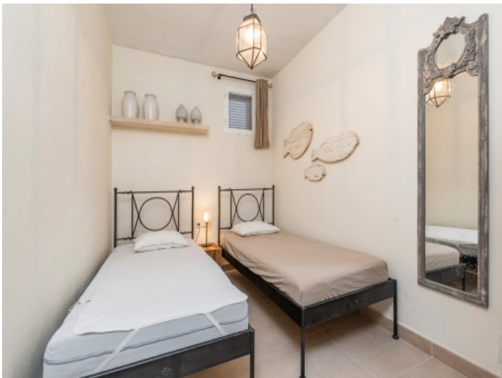
Zweites Schlafzimmer im Haupthaus