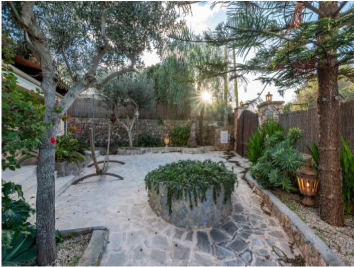
Zugang durch einen mediterranen Garten