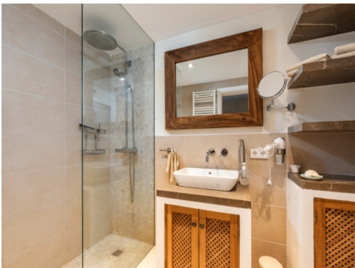
Modernes Duschbadezimmer mit Charme