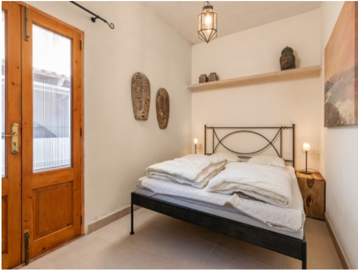
Doppelschlafzimmer mit Zugang nach Außen