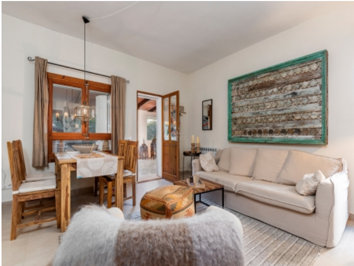
Zuang zum gemütlichen Wohn- und Essbereich