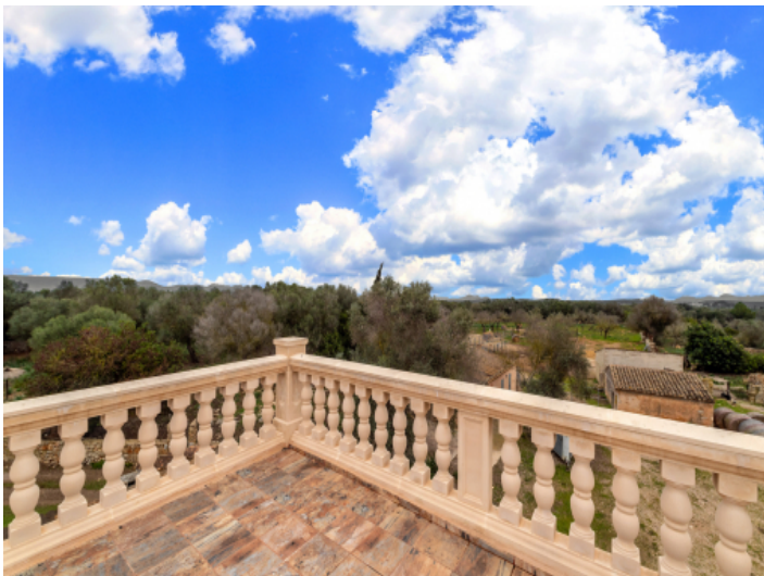
Terrasse mit malerischem Landschaftsblick