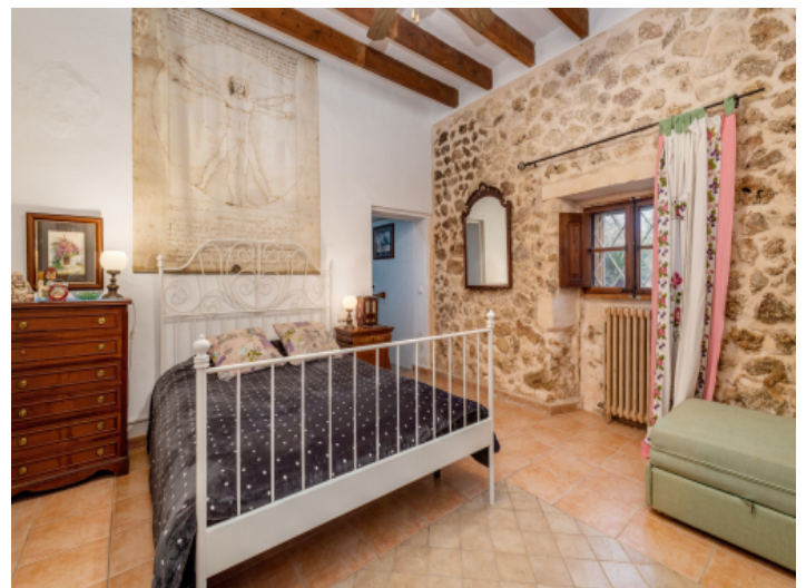
Eines von 7 Schlafzimmern