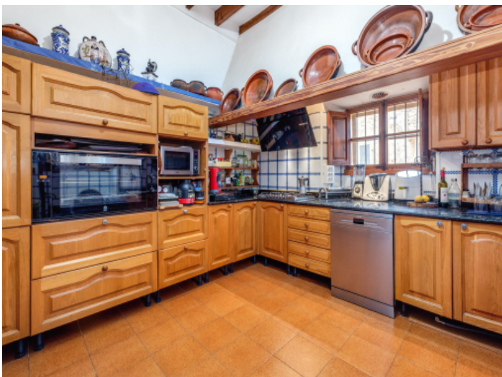
Voll ausgestattet Küche aus Holz