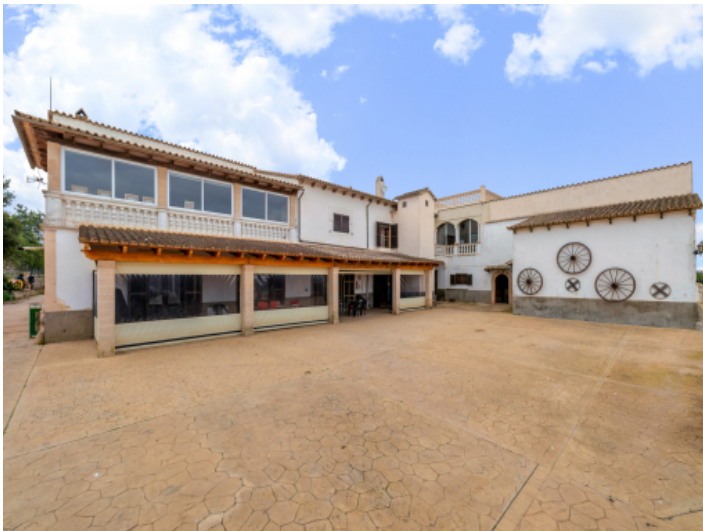
Außenansicht und großer Außenbereich