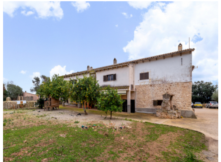
Außenansicht der Finca