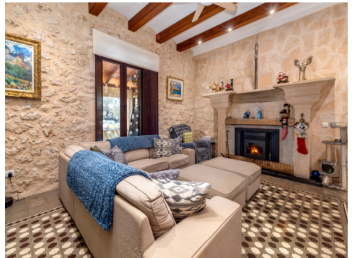
Gemütlicher Wohnbereich mit Kamin