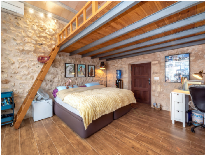
Eines von 7 Schlafzimmern