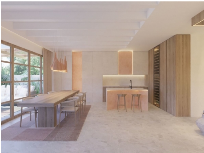
Offener Wohn- und Essbereich mit Küche