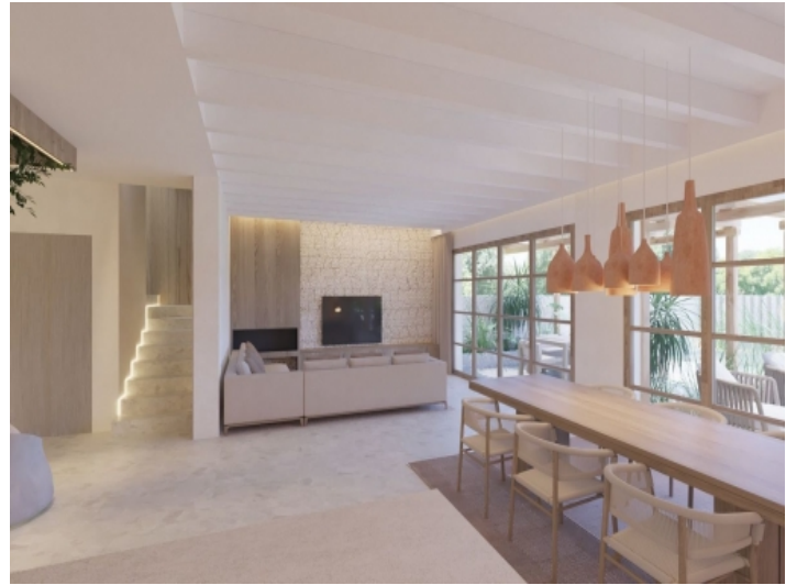
Offener Wohn- und Essbereich mit Küche