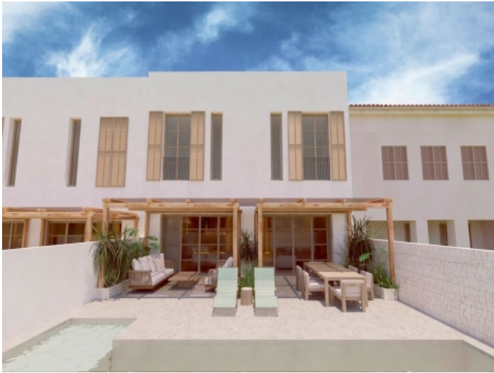
Ansicht der Terrasse