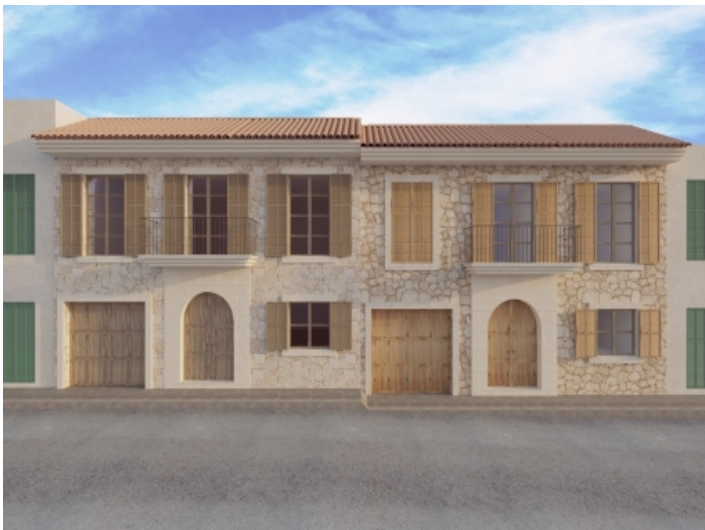
Außenansicht des Hauses