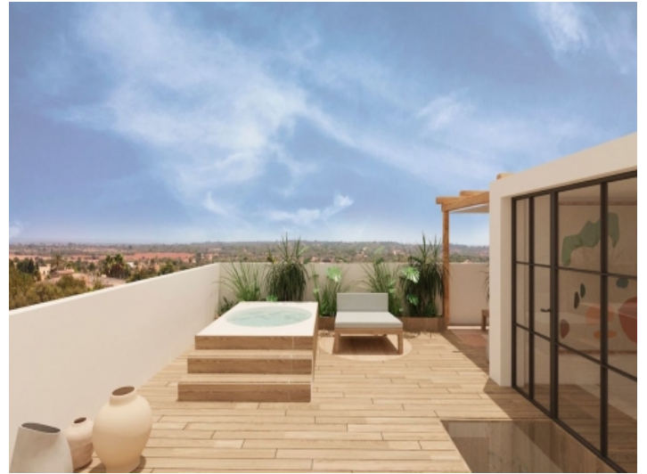
Alternative Ansicht der Dachterrasse