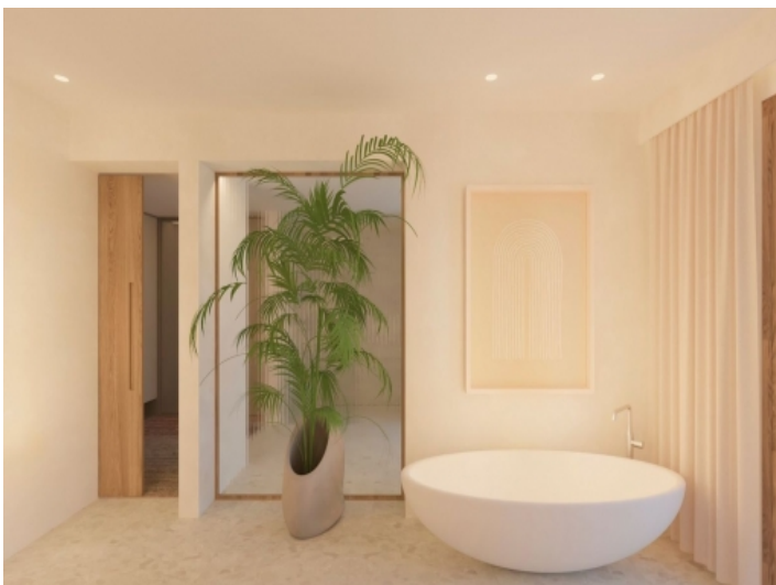
Ansicht des Badezimmers