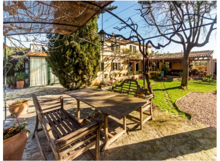
Garten und Terrasse