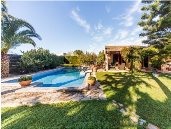
Garten und Pool