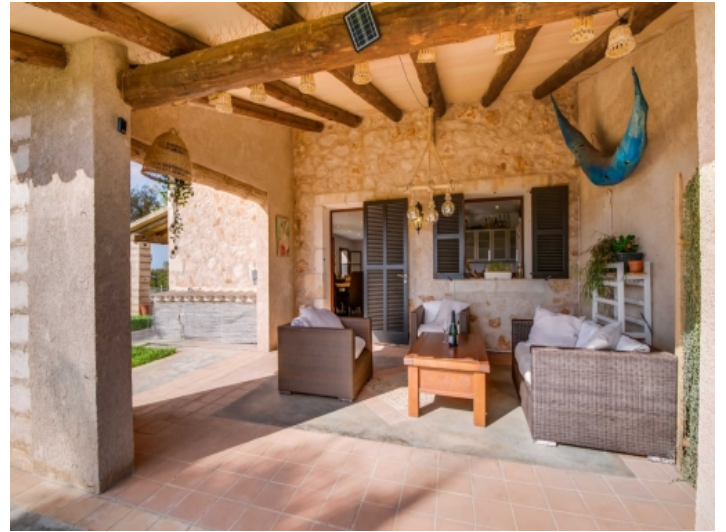
Windgeschützte Küchenterrasse auch für Winterage geeignet