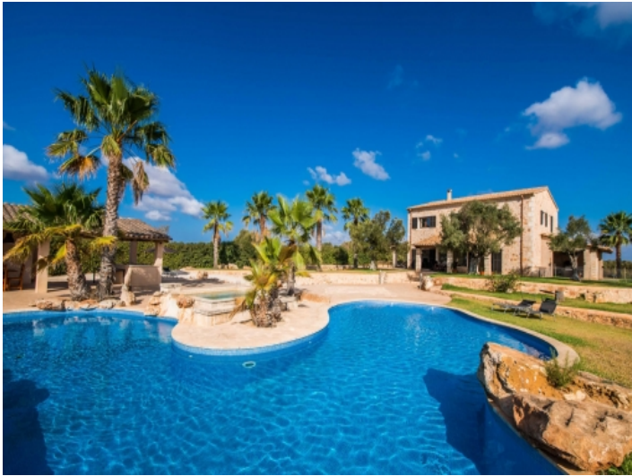
Schön angelegte Poollandschaft