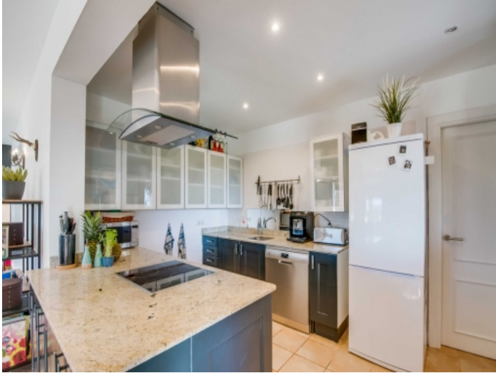
Moderne Küche mit Kochinsel