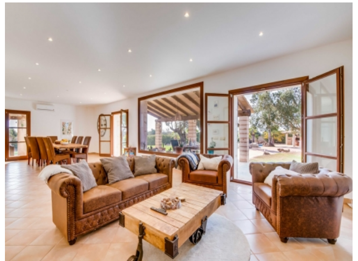
Heller Wohnbereich mit Terrassenzugang