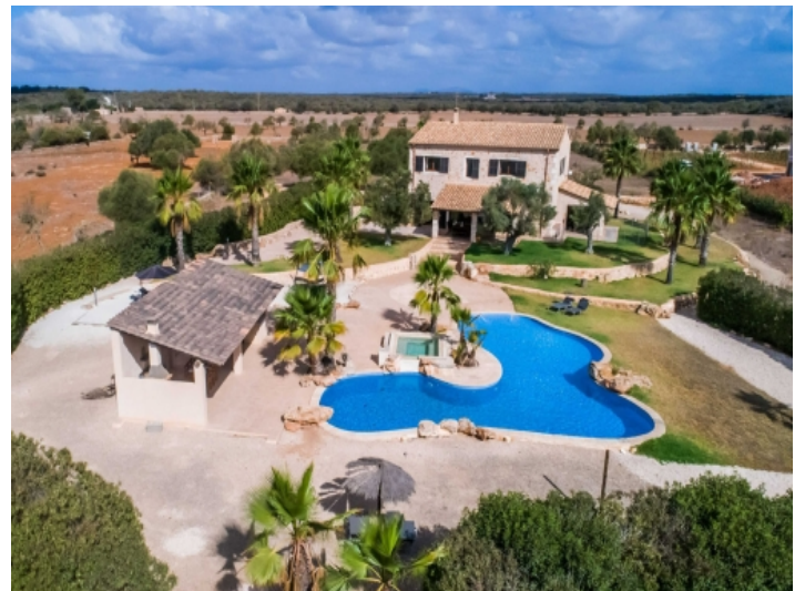
Luftansicht von der Poolseite