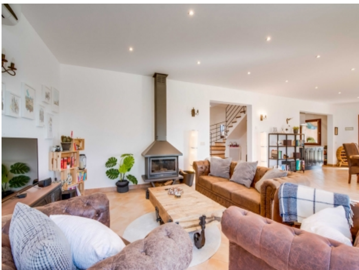
Schöner Wohnbereich mit Kamin