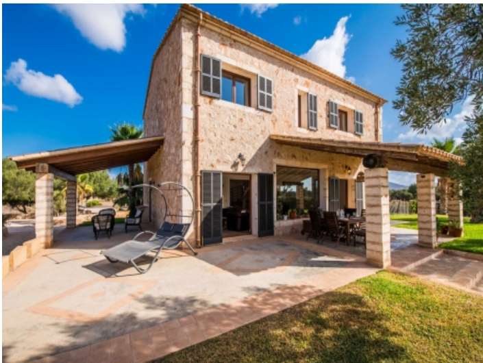
Große, überdachte Terrasse