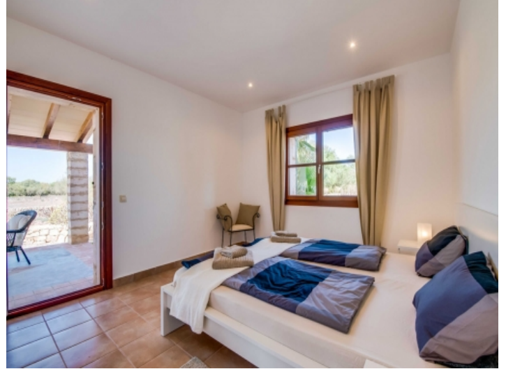
Doppelzimmer mit Terrassenzugang