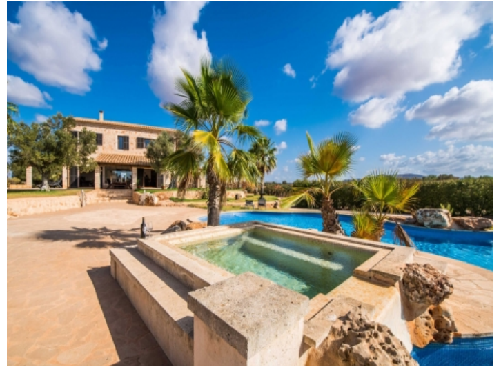
Whirlpool neben dem Pool