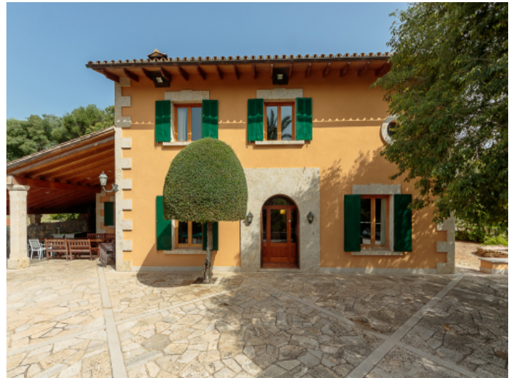
Fassade der Finca