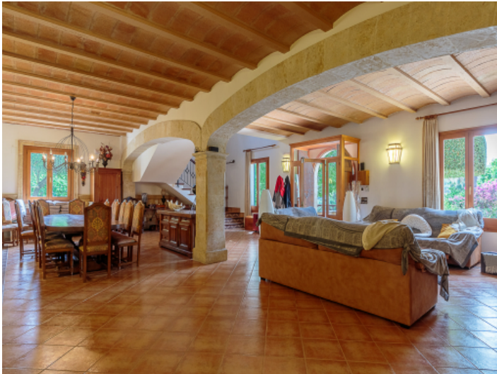
Sehr heller Wohn-/Essbereich