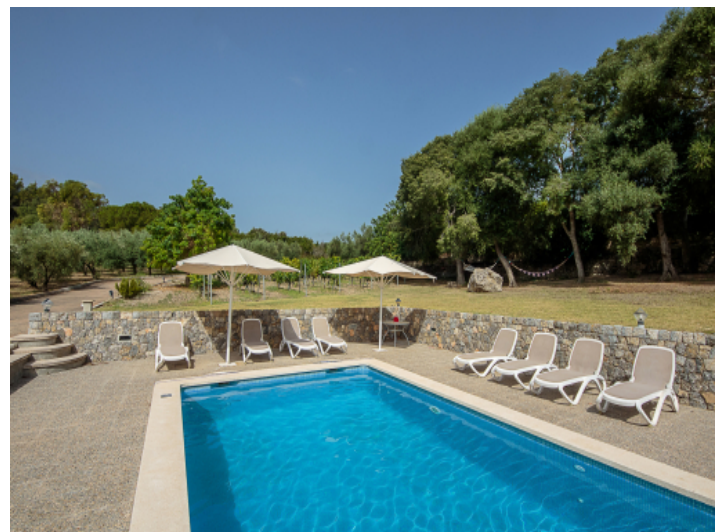
Pool umgeben von gepflegtem Garten