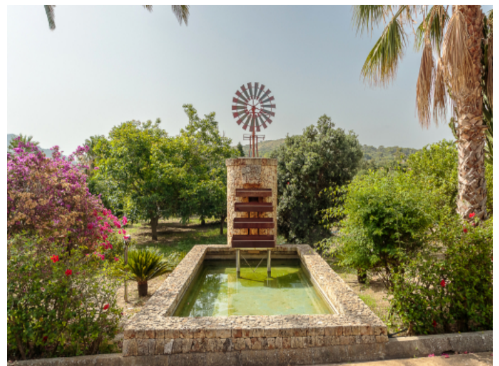
Eingewachsener Garten und Windmühle