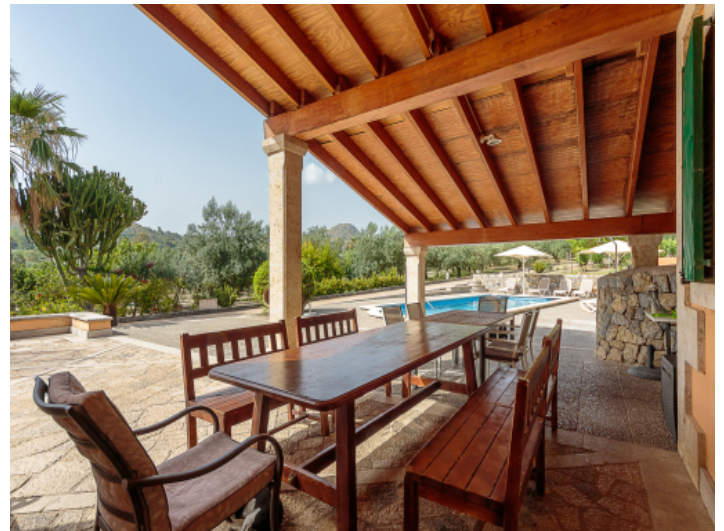
Essbereich im Freien