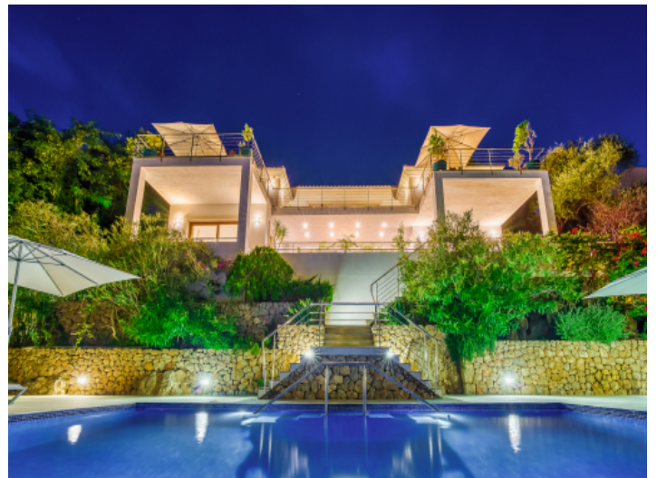
Spektakuläre Ansicht bei Nacht