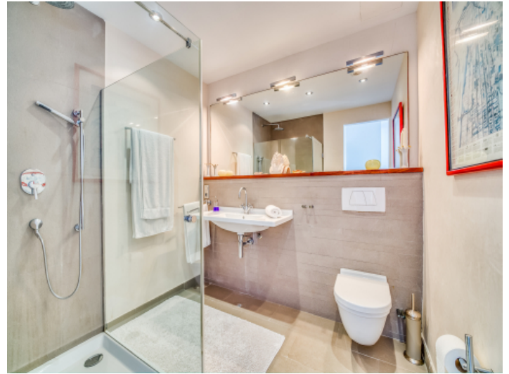
Weiteres Badezimmer en-Suite