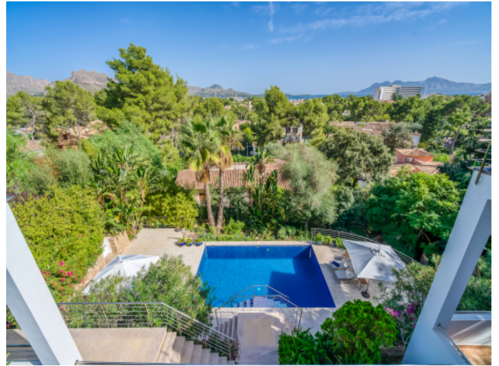
Blick auf Pool