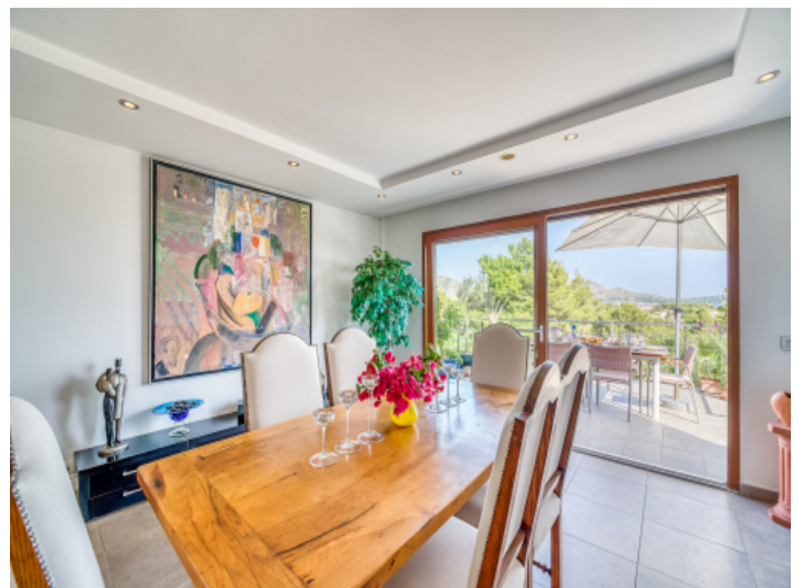
Essbereich mit Terrassenzugang