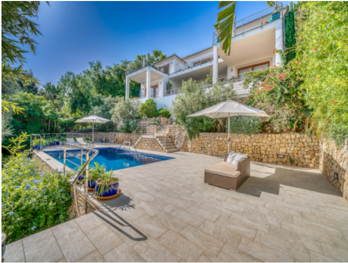
Exclusive Villa in Pollens