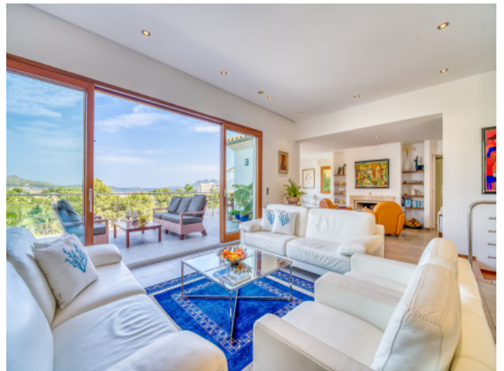
Obere Etage mit Panoramablick