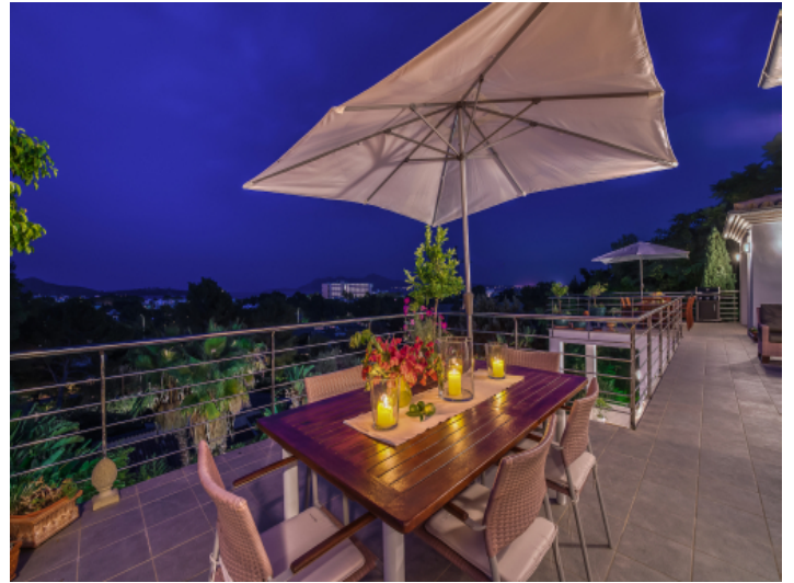
Äußerer Essbereich bei Nacht