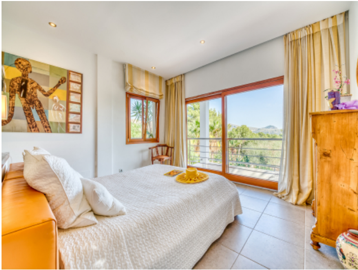
Schlafzimmer mit Blick