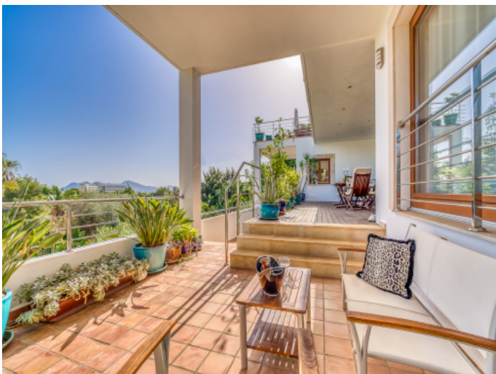
Blick auf der Ebene