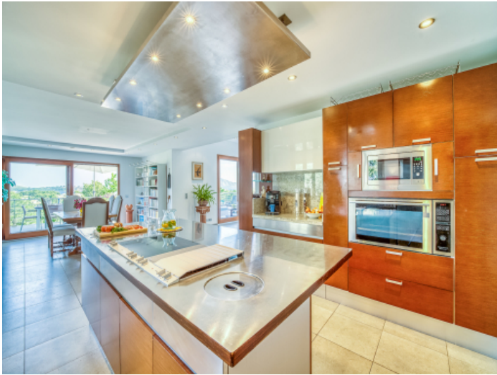
Küche mit Essbereich anbei