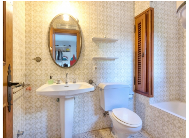
Eines von 6 Badezimmern