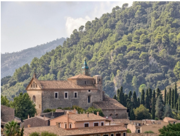
Schöner Berg- und Dorfblick