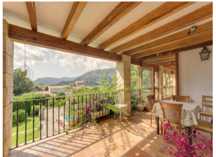
Überdachte Terrasse mit Ausblick