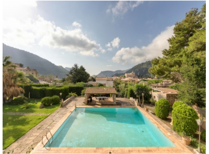
Wundervoller Blick auf den Pool und das Dorf