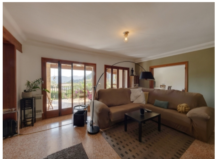
Wohnbereich mit Terrassenzugang