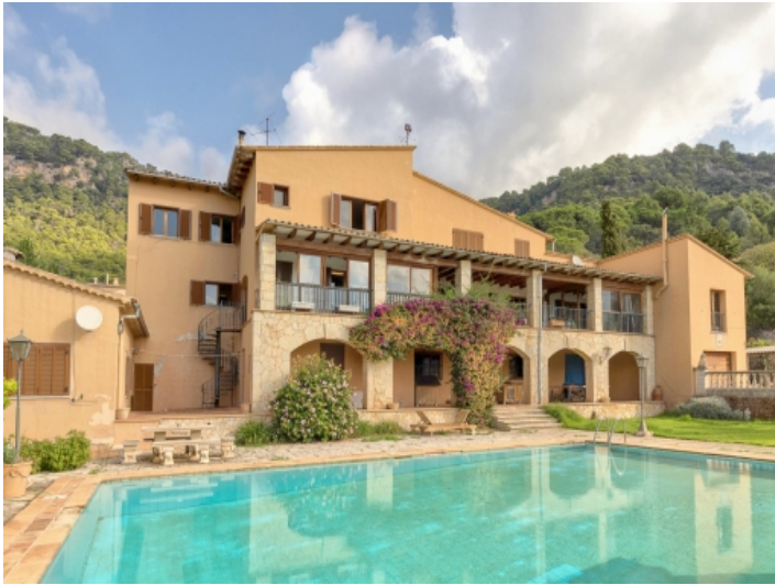
Außenansicht und großer Pool