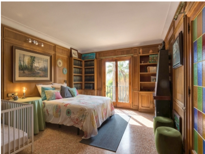
Eines von 8 Schlafzimmern