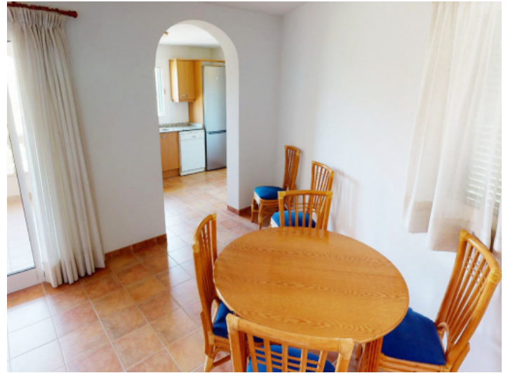
Essbereich und Küche