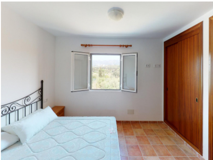
Die Mastersuite des Obergeschosses