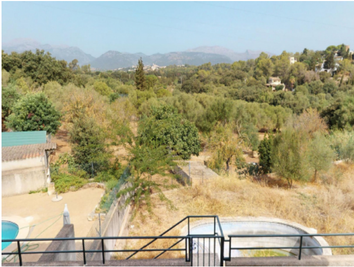
Blick über den eigenen Pool hinweg auf die Berge