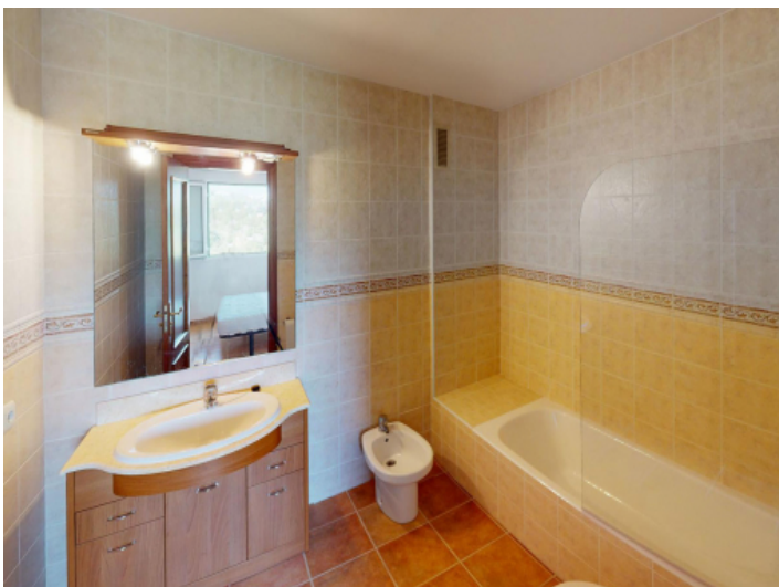
Das Badezimmer der Mastersuite