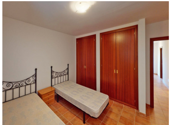
Eins von 3 Doppelschlafzimmern im Obergeschoss