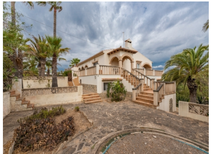
Außenansicht der Finca