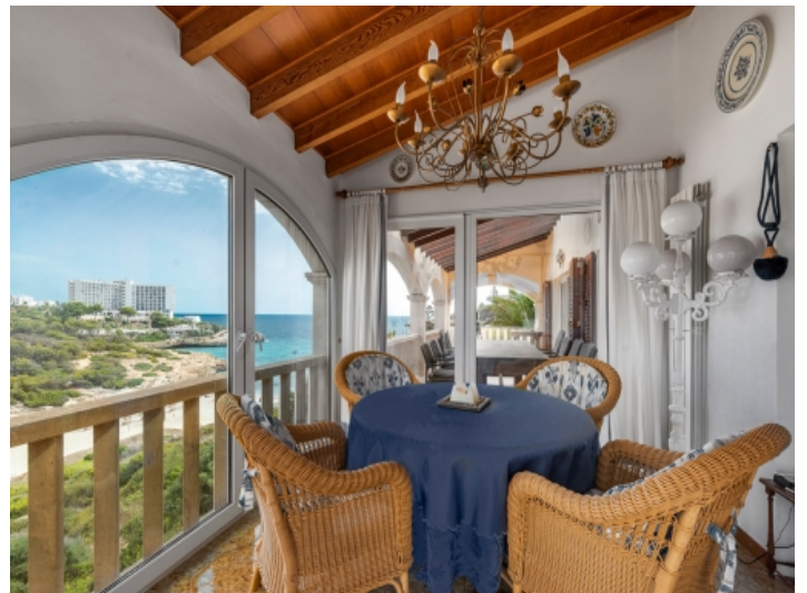
Separate Essbereiche auf dem Balkon