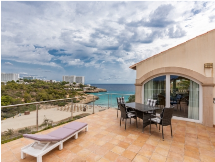
Terrasse mit Meerblick