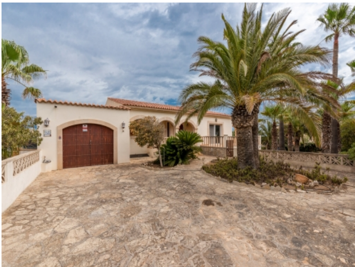
Garage und Auffahrt