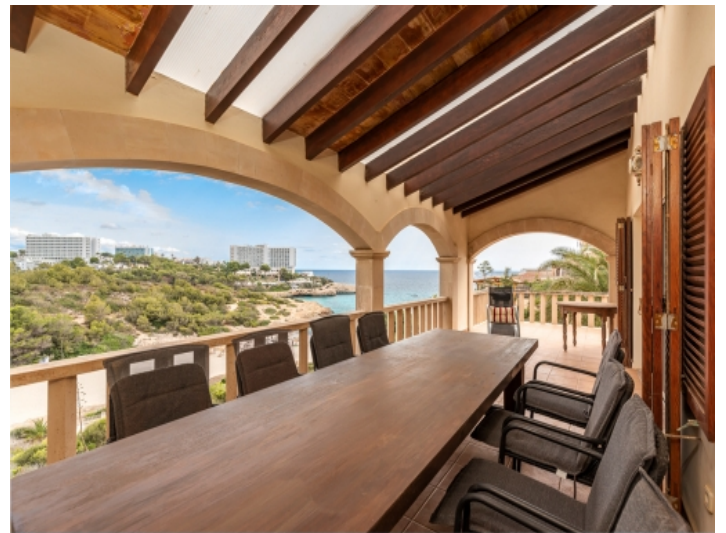
Essbereich mit Meerblick auf dem Balkon