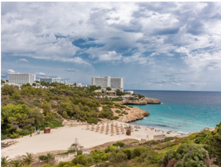
Blick zur Bucht Cala Murada