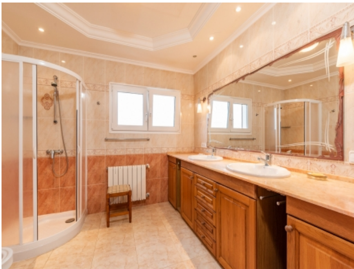
Großes Badezimmer mit Dusche