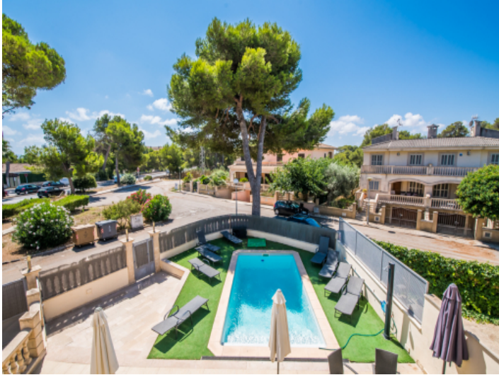
Blick auf den Poolbereich