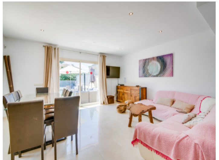
Wohn-und Essbereich mit Zugang nach Außen