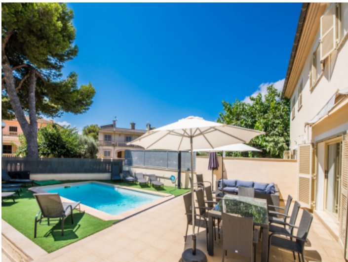
Essbereich neben dem Pool