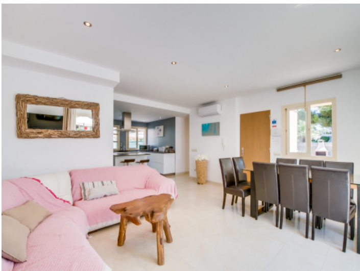
Blick zur offenen Küche