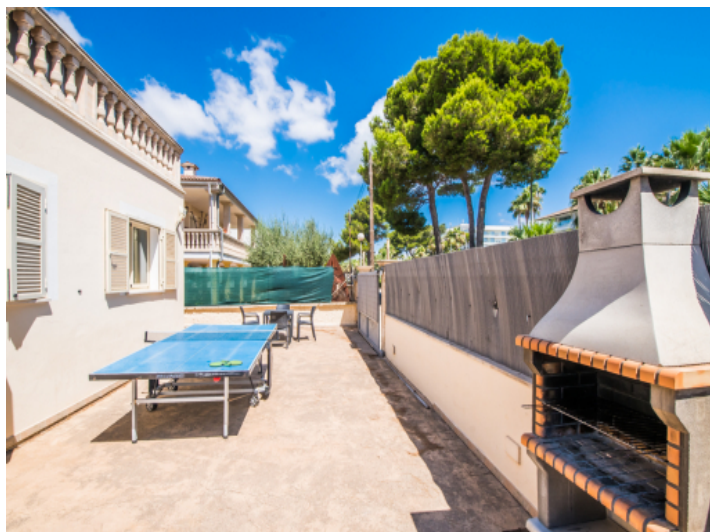
Weitere Terrasse mit Grillbereich