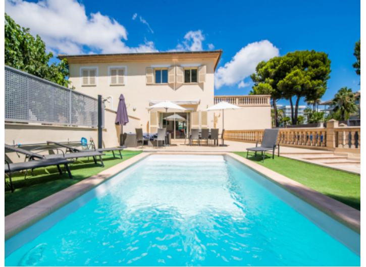
Außenansicht und Poolbereich