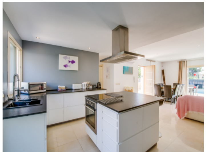
Moderne Küche mit Kochinsel