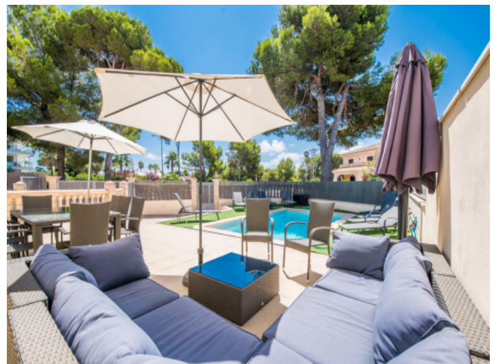
Loungebereich neben dem Pool