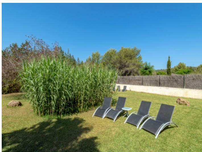
Garten mit Privatsphäre