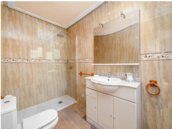
Eines von 4 Badezimmern