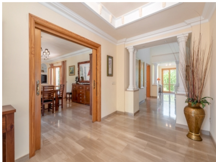
Einladender Eingangsbereich und Flur