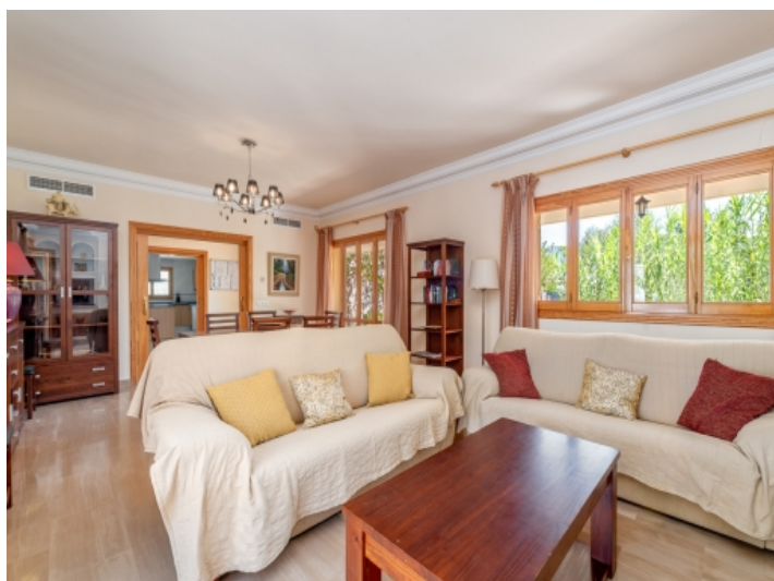
Großer Wohn-und Essbereich