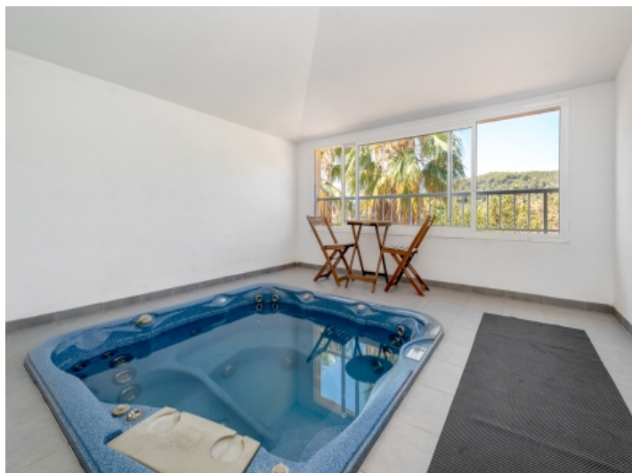
Weiterer Raum mit Jacuzzi