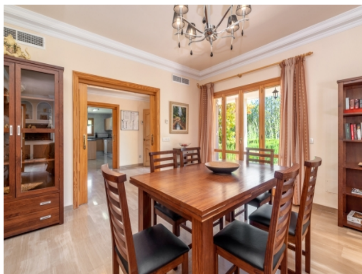
Heller Essbereich mit Terrassenzugang