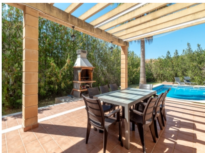
Schöne Terrasse mit Grill