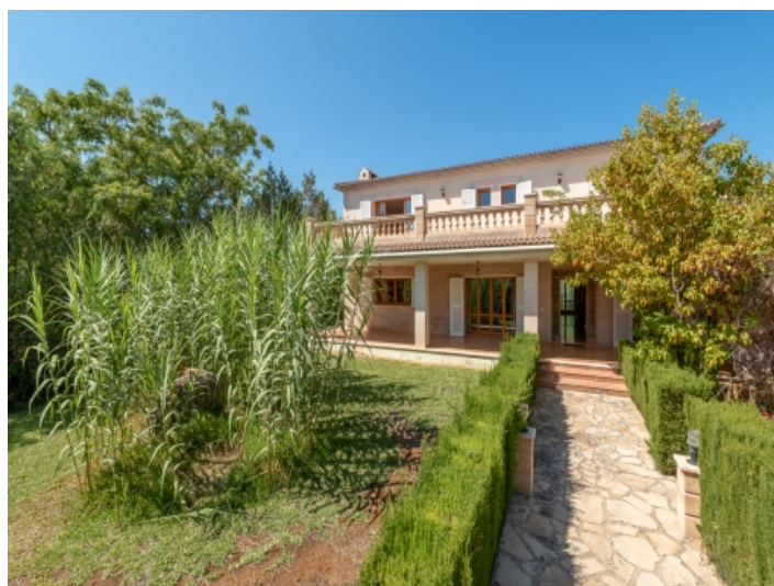
Vorgarten und Zugang zum Haus