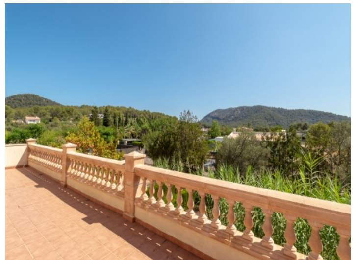
Obere Terrasse mit Ausblick