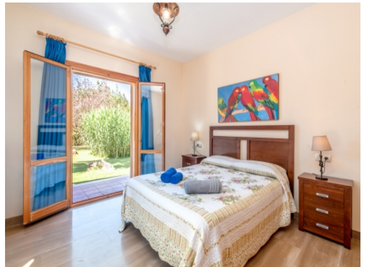
Doppelzimmer mit Gartenzugang