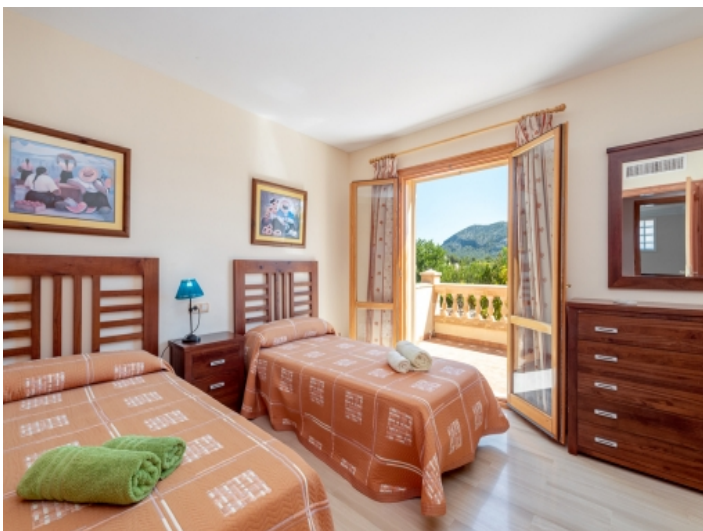
Schlafzimmer mit Zugang zur oberen Terrasse