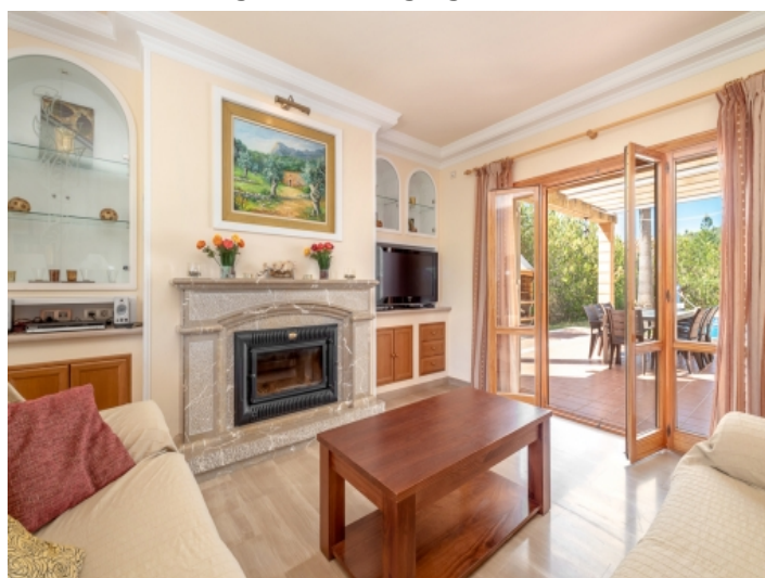
Wohnbereich mit Terrassenzugang