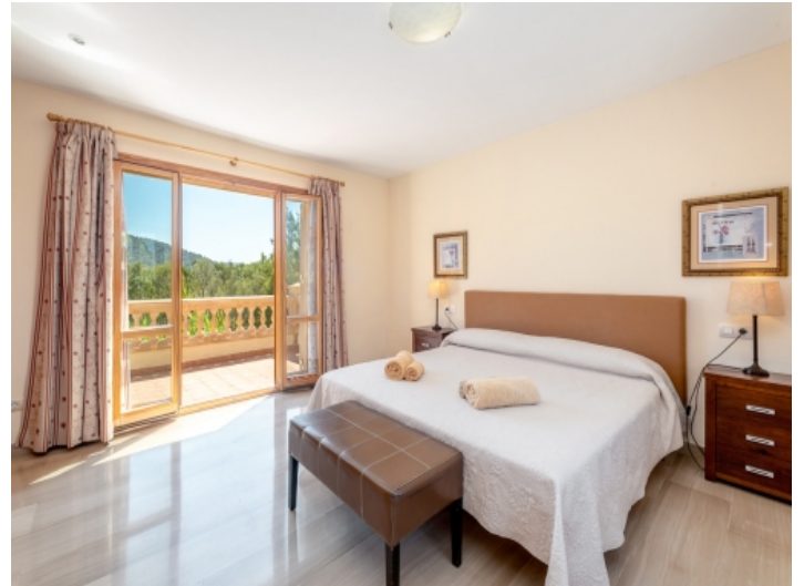
Eines von 5 Schlafzimmern