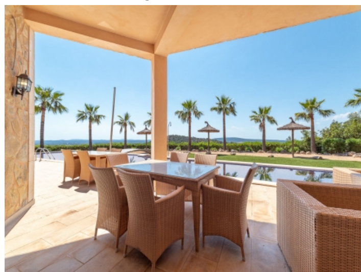
Überdachte Terrasse mit Essbereich