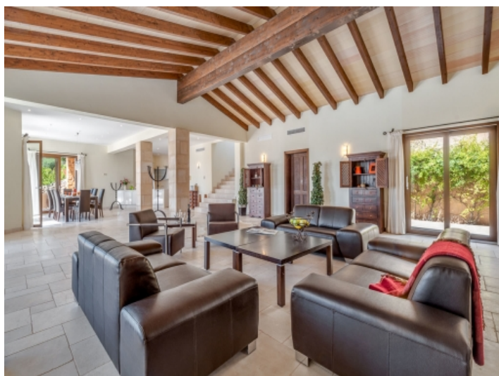
Offener Wohnbereich mit Holzdeckenbalken