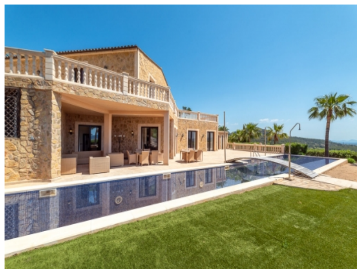
Langer 24 Meter Pool