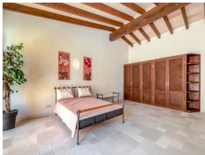
Eines von 10 Schlafzimmern