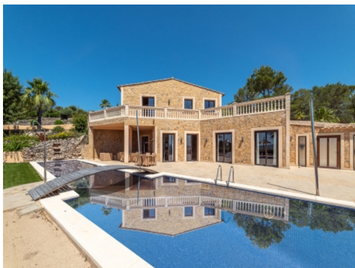
Außenansicht und Poolbereich