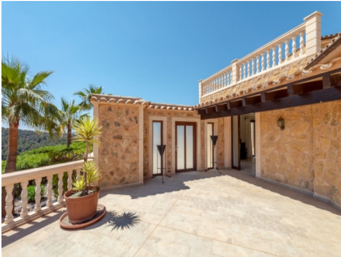
Obere, sonnige Terrasse