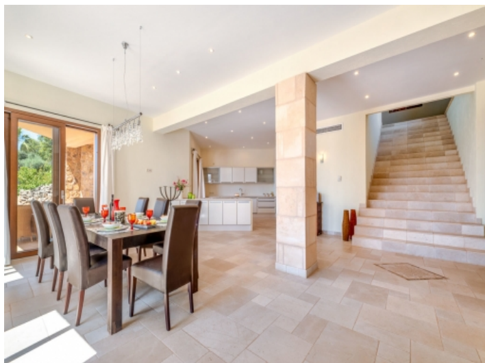
Essbereich und offene Küche