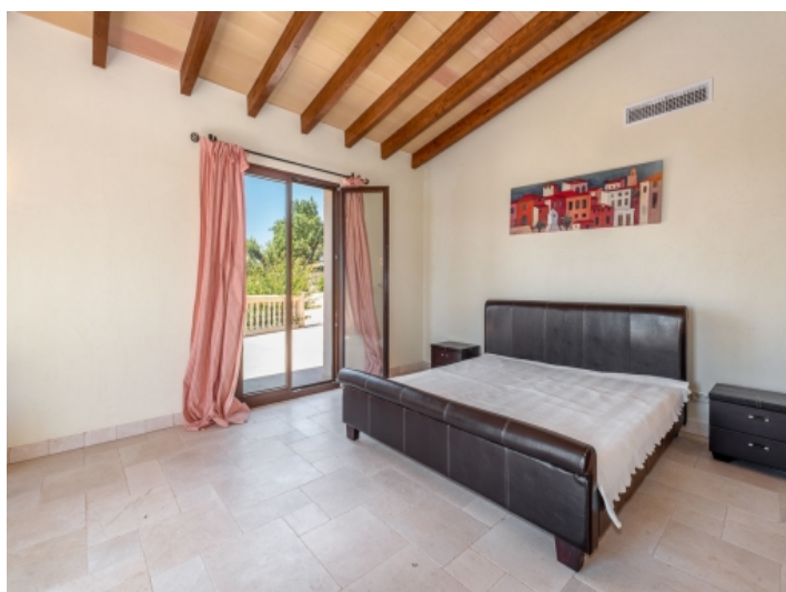
Eines von 10 Schlafzimmern