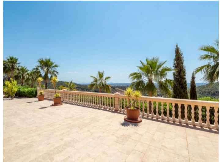
Terrasse mit Blick über die Landschaft