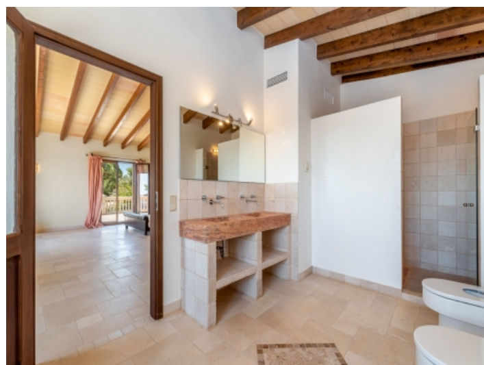
Eines von 6 Badezimmern