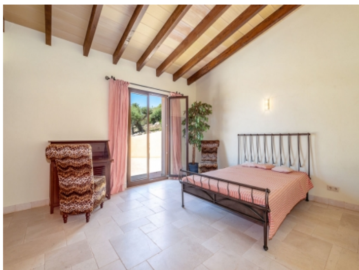
Eines von 10 Schlafzimmern