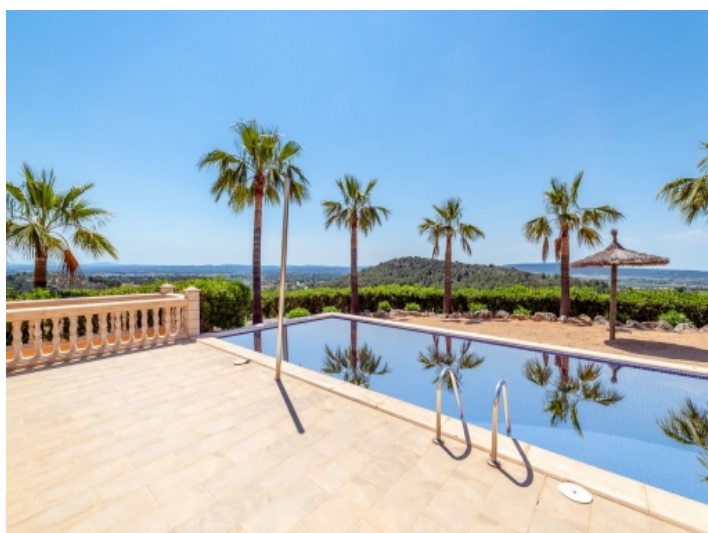
Poolbereich mit schönem Weitblick