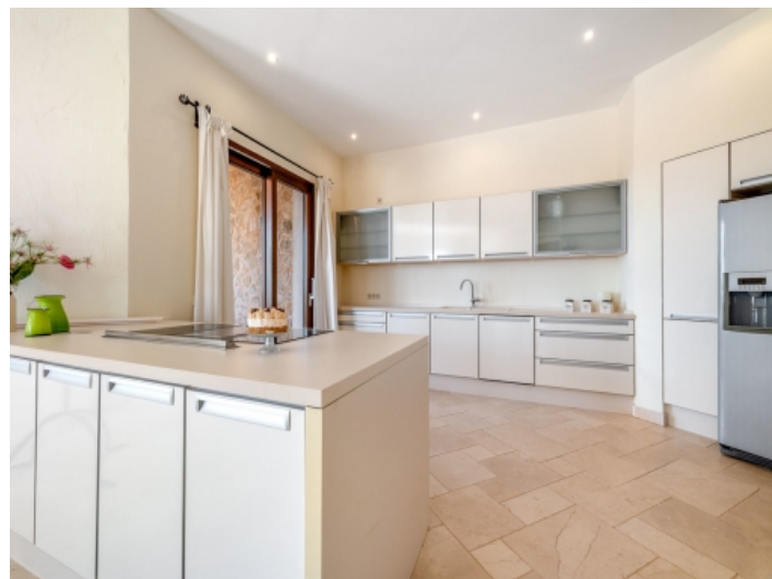
Große, moderne Küche