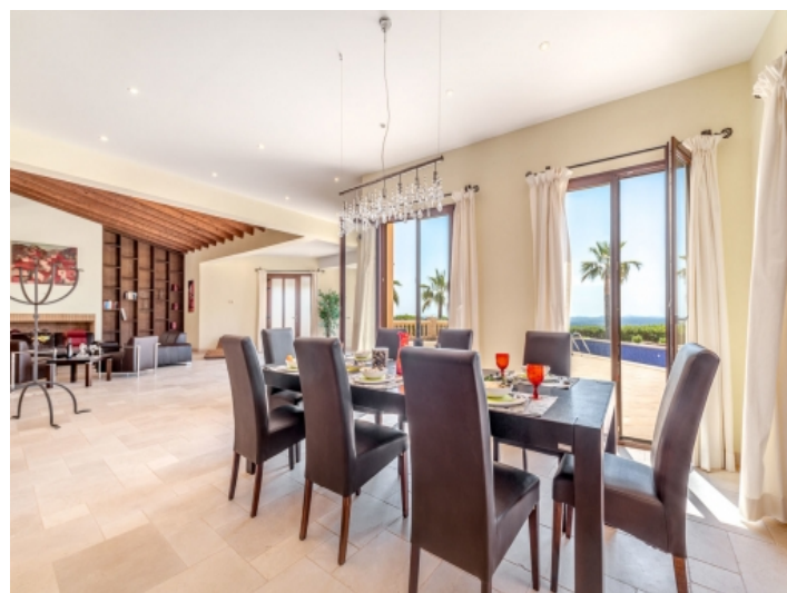
Lichtdurchfluteter Essbereich mit Terrassenzugang