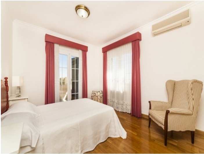
Schlafzimmer mit Panoramafenster