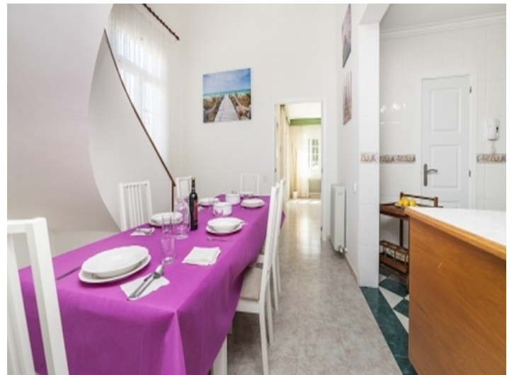
Offene Küche und Essbereich