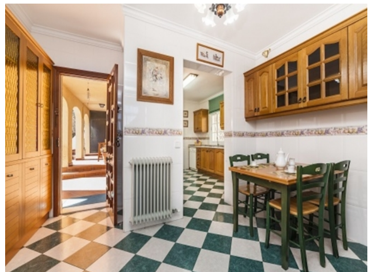
Essbereich der Küche