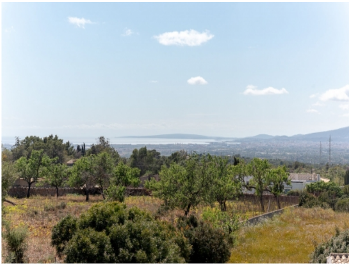
Panoramablick auf die Bucht von Palma