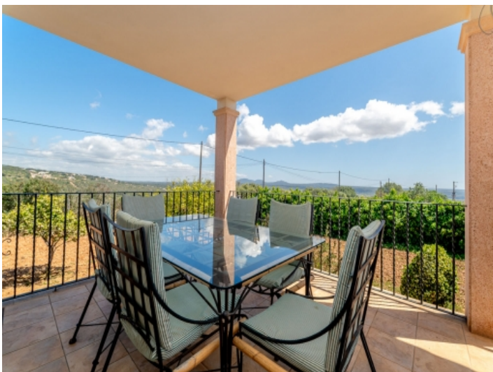
Entspannter Essbereich im Freien