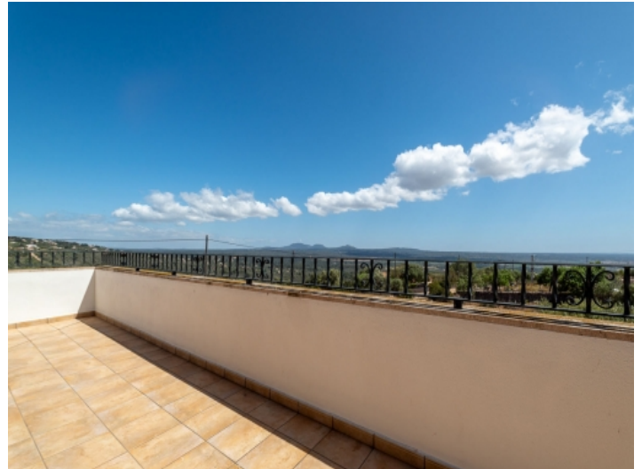
Obere Terrasse mit Weitblick