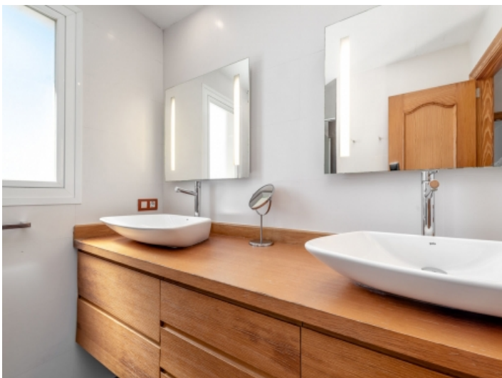
Modernes en Suite Badezimmer