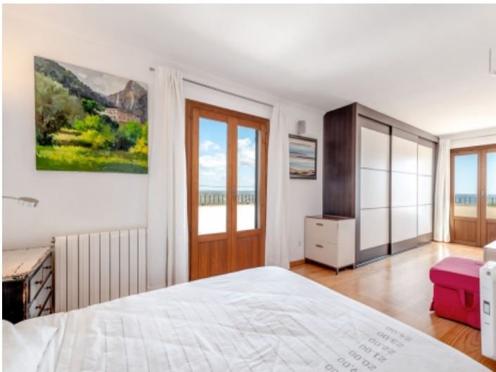
Hauptschlafzimmer mit Terrassenzugang