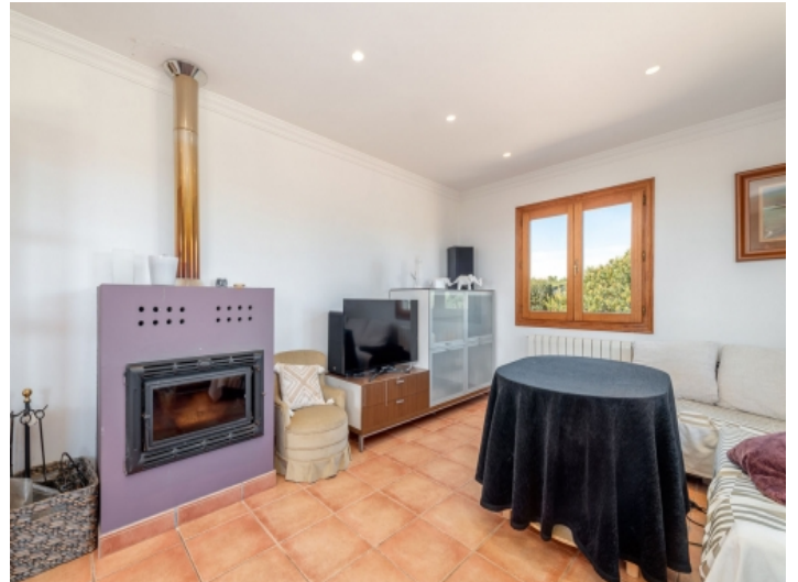
Kamin für Wintertage