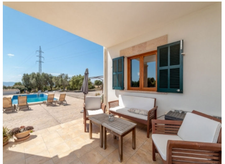
Überdachter Sitzbereich auf der Terrasse