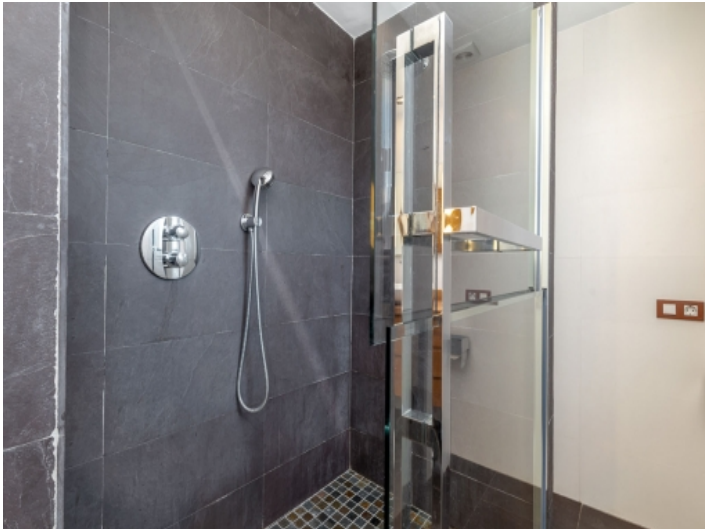
Eines von 2 Badezimmern