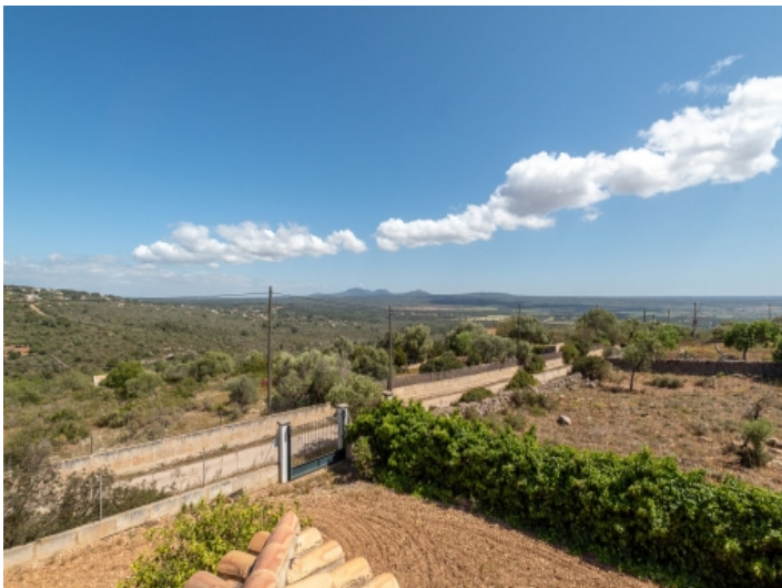
Blick auf die umliegende Landschaft