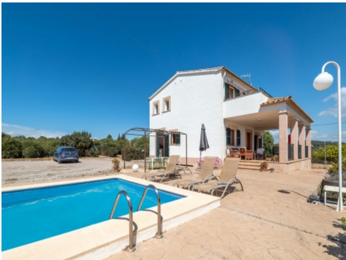
Großer Pool- und Außenbereich