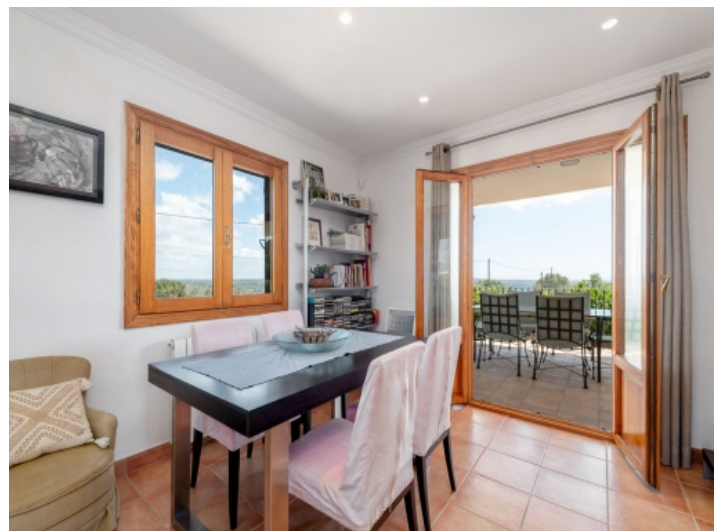
Essbereich mit Terrassenzugang