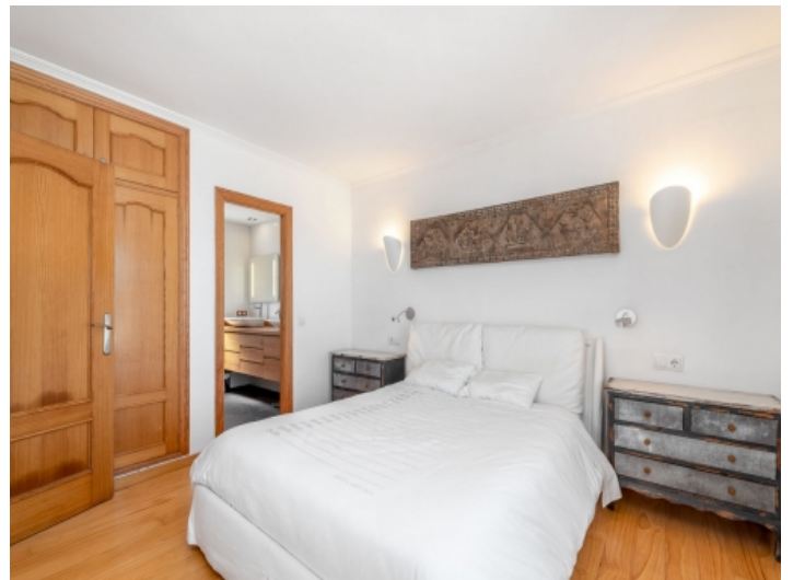
Hauptschlafzimmer mit Bad en Suite