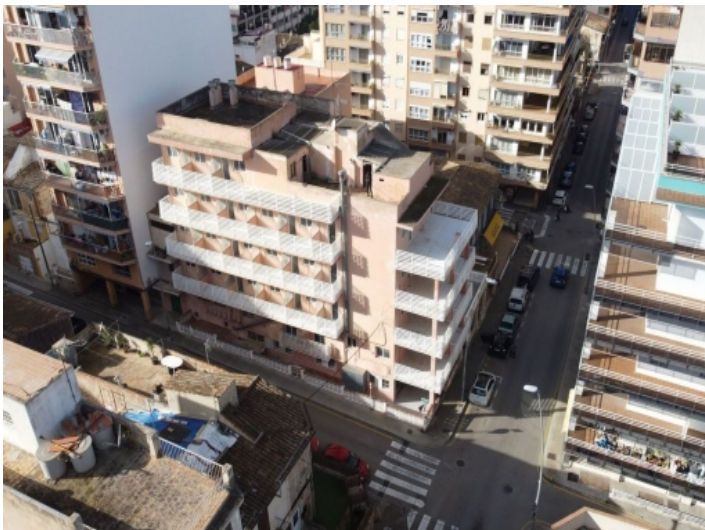
Hostal aus der Vogelperspektive