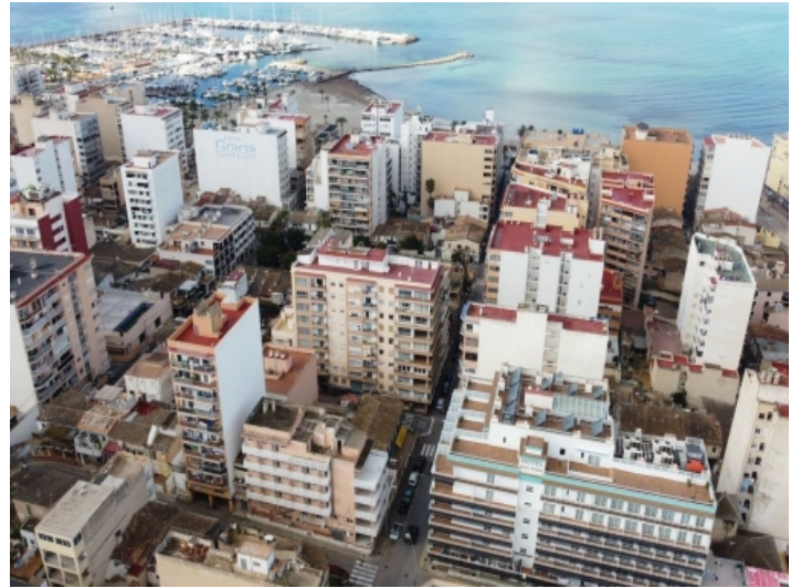
Hostal aus der Vogelperspektive