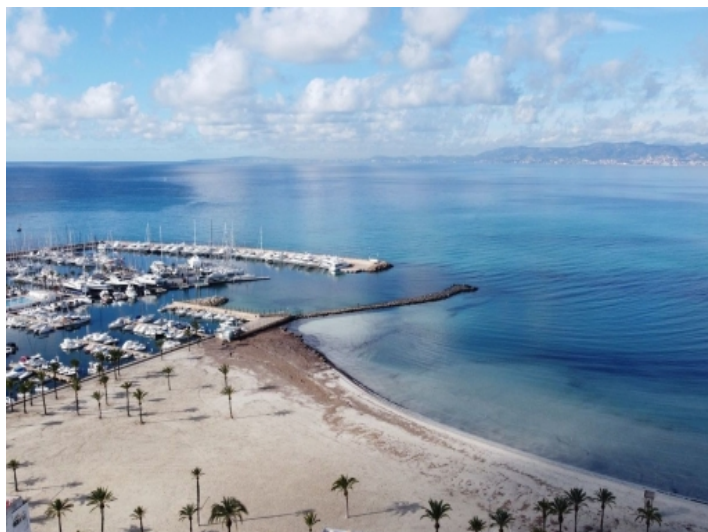
Blick auf den Strand