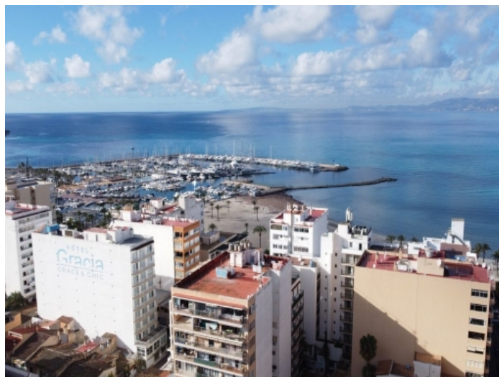
Blick über S'Arenal