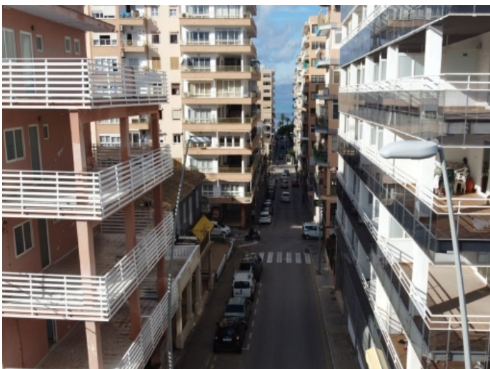
Straßenansicht und Meerblick