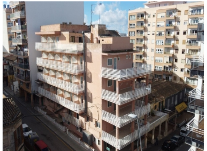
Seitenansicht des Gebäudes